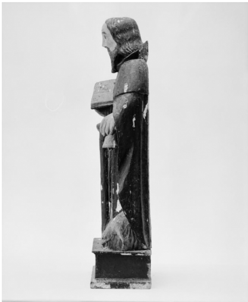
Vue de profil gauche.