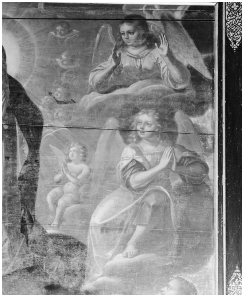
Détail des anges de partie droite.