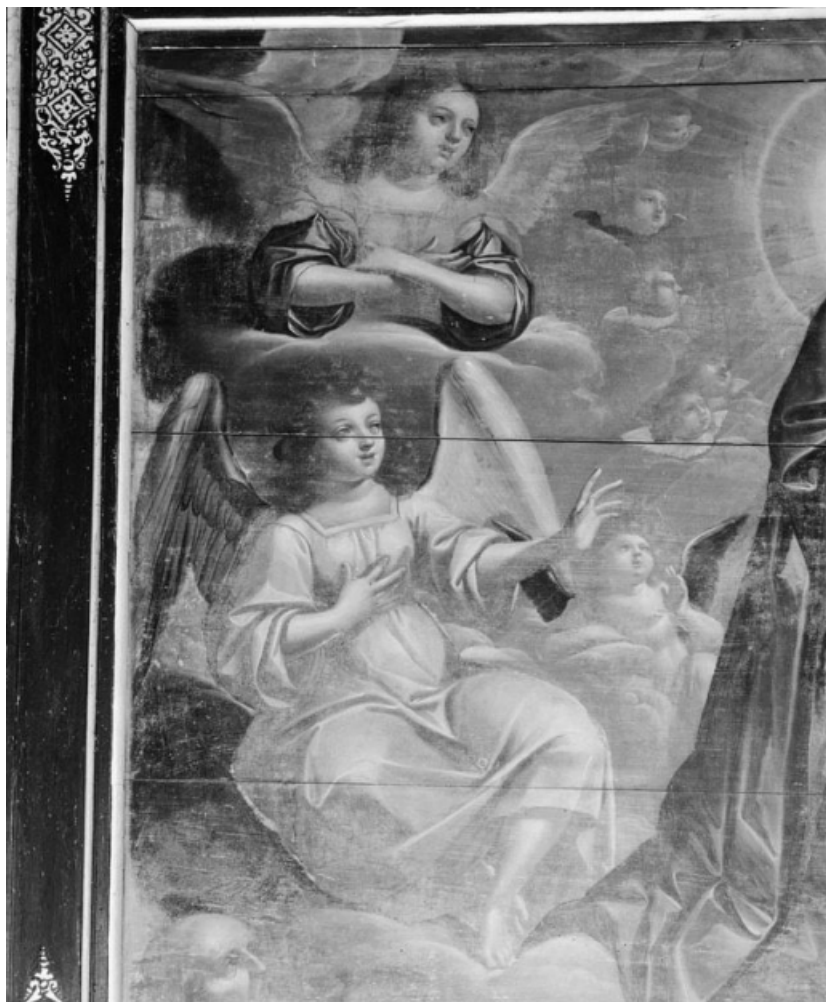
Détail des anges de la partie gauche. 21, Chassagne-Montrachet