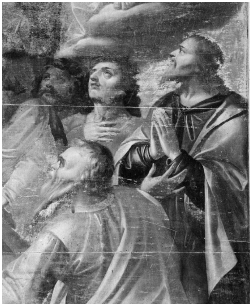
Détail du groupe d'apôtres.