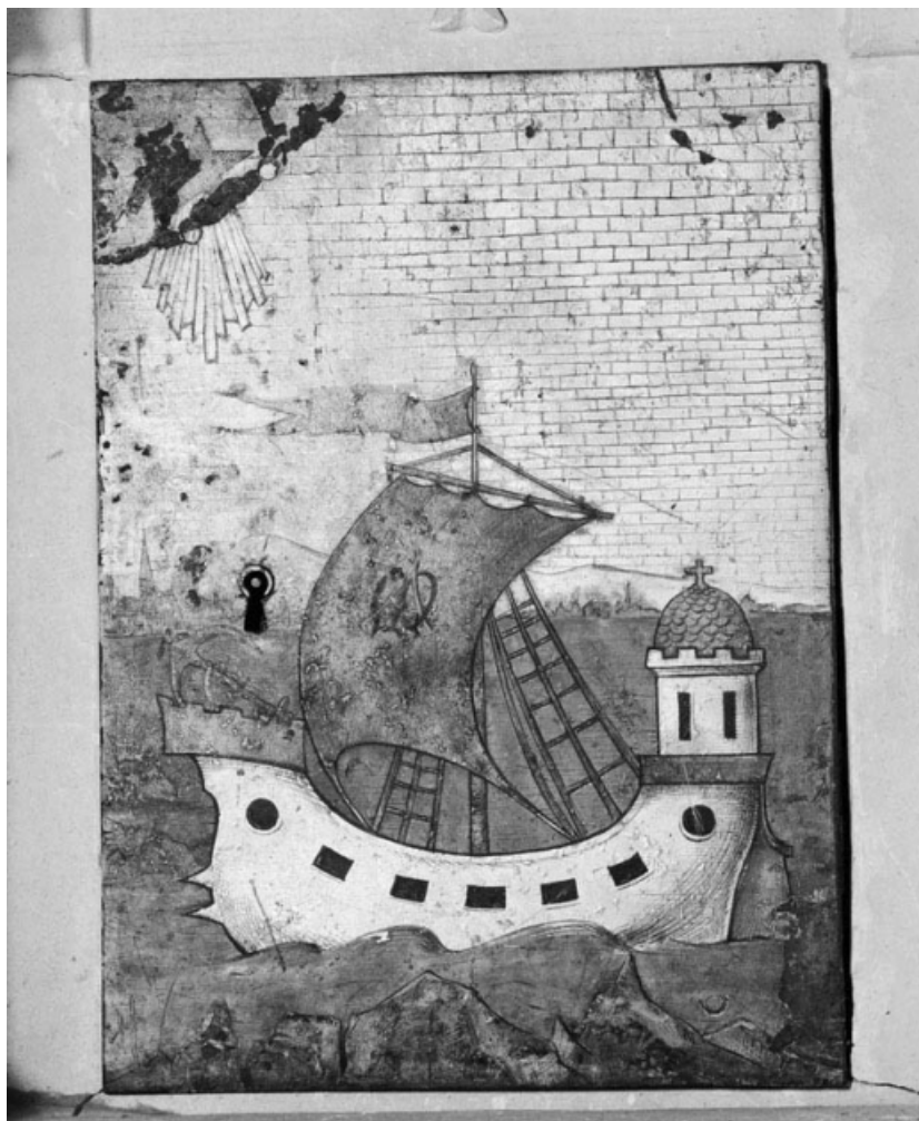
Détail de la porte du tabernacle.