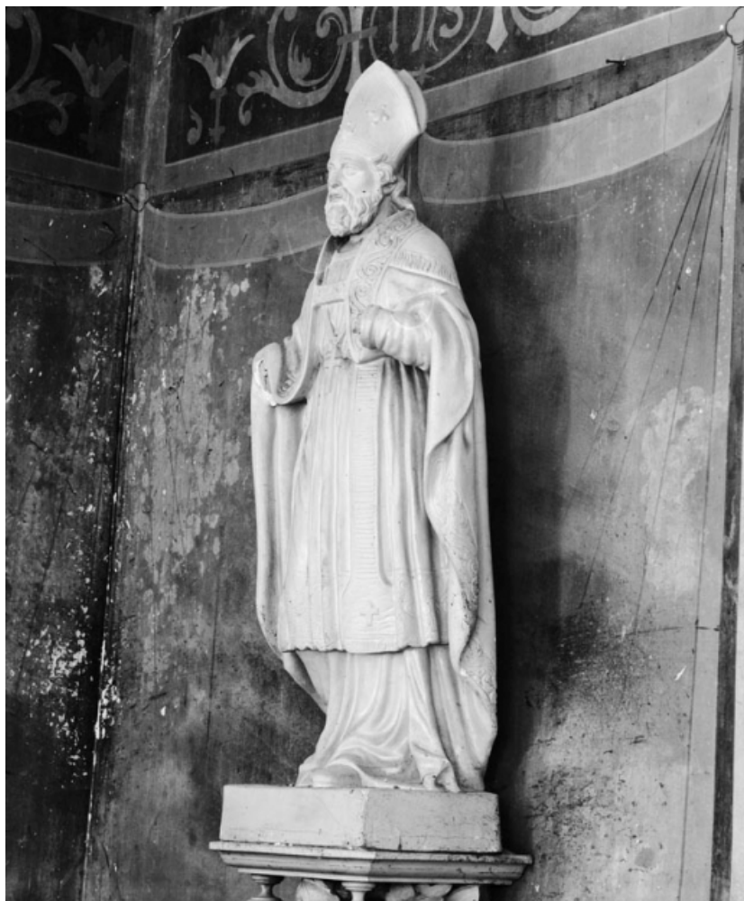
Vue d'ensemble, de trois quarts.