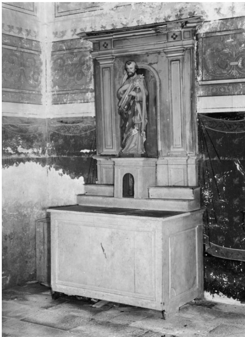
Vue d'ensemble de l'autel-retable de la chapelle gauche.