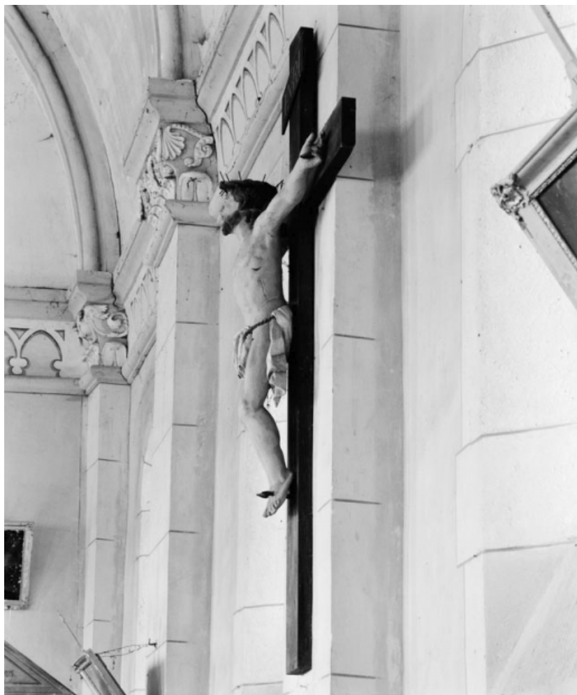
Vue du profil gauche.