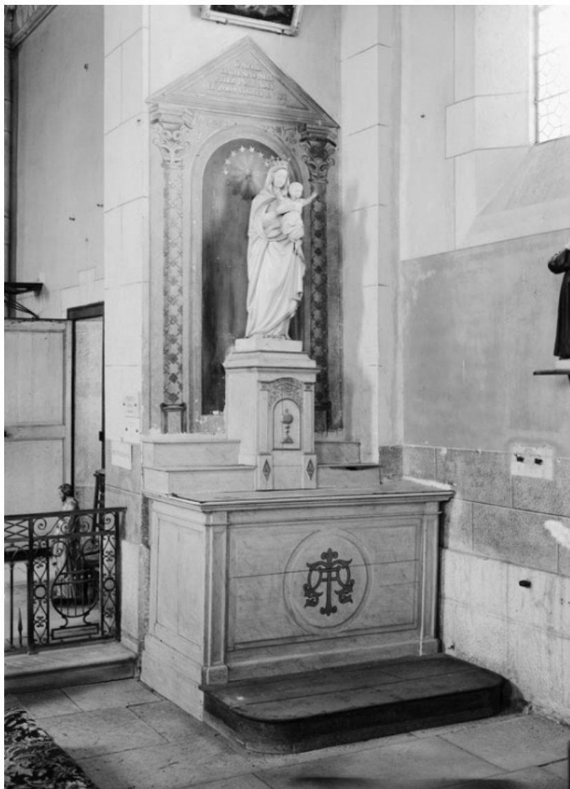
Vue d'ensemble de l'autel latéral droit. 21, Aubigny-la-Ronce