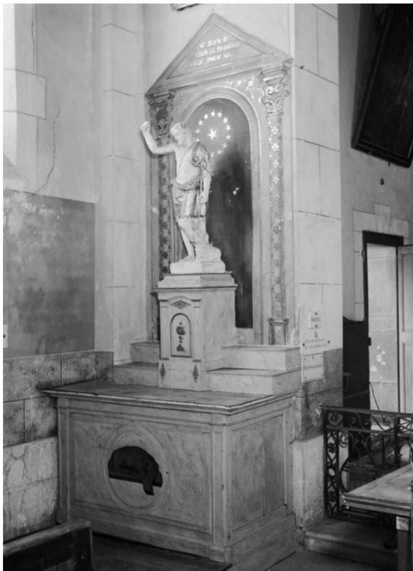
Vue d'ensemble de l'autel latéral gauche.