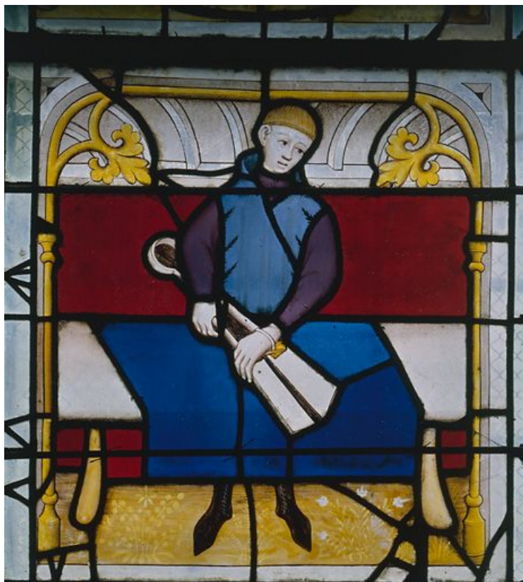
Lancette gauche, registre inférieur, la tonte