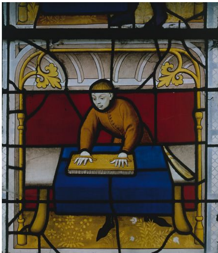
Lancette droite, registre inférieur, le lustrage