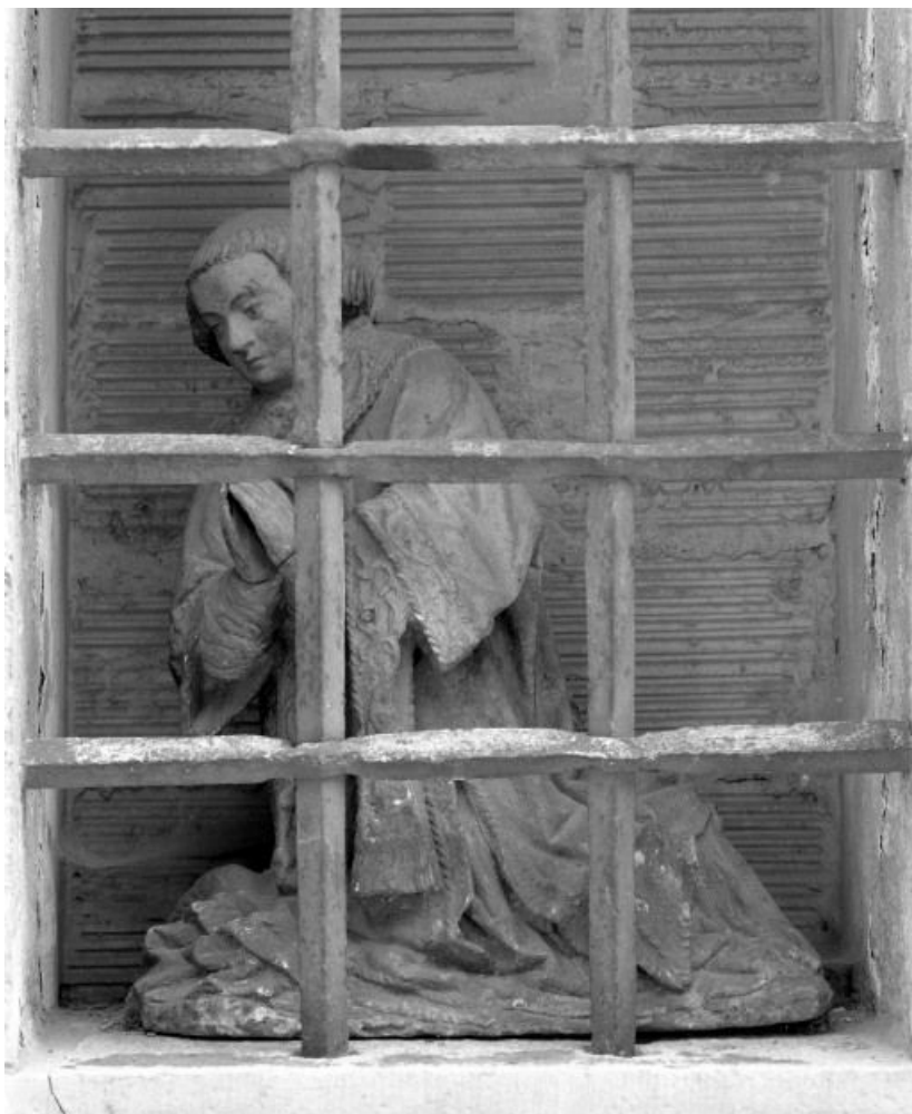
Vue d'ensemble 21, Seurre maison