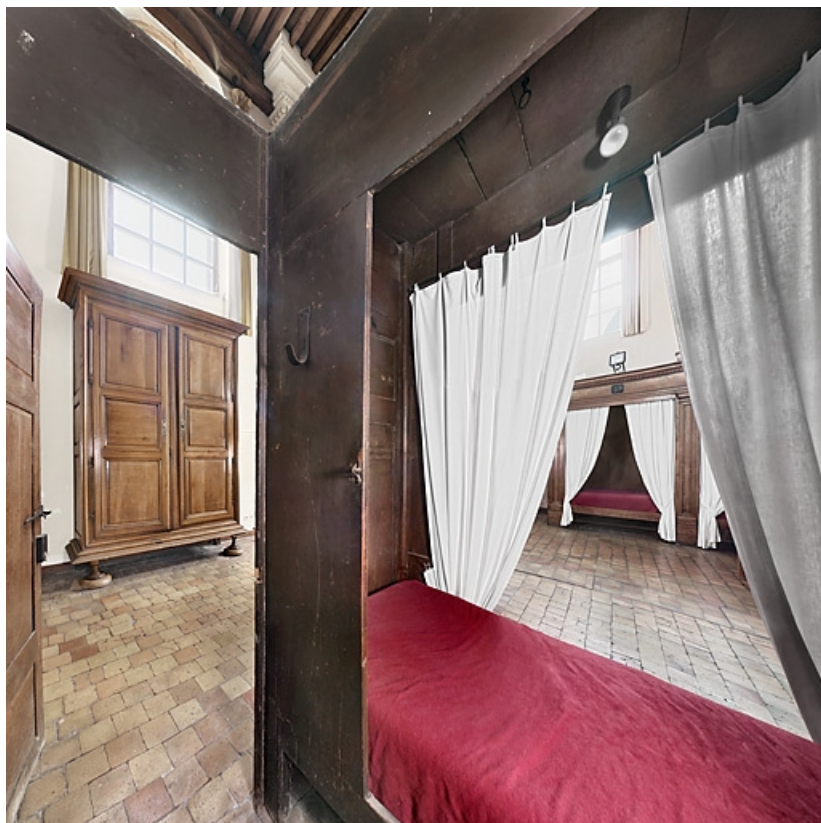
Lits de l'extrémité des 2 rangées (en 2010).

21, Seurre, 14 rue du Faubourg Saint-Georges