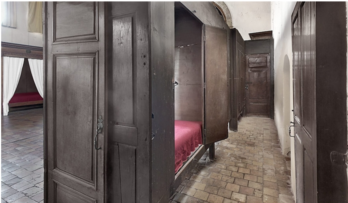
Ruelle des lits mi-clos de la salle des hommes (en 2010).

21, Seurre, 14 rue du Faubourg Saint-Georges