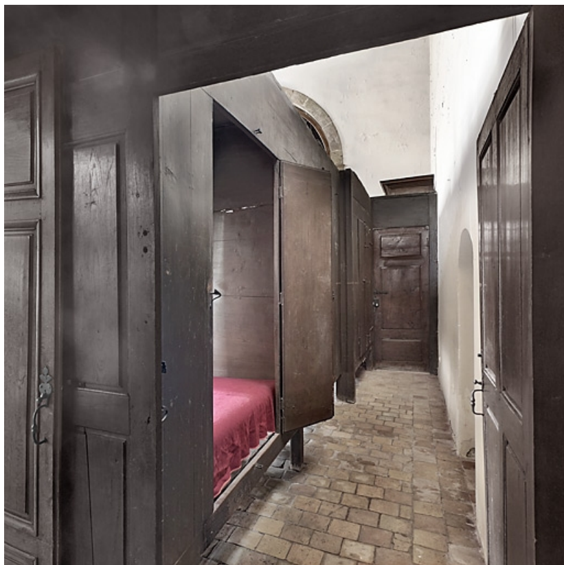
Ruelle des lits mi-clos de la salle des hommes (en 2010).

21, Seurre, 14 rue du Faubourg Saint-Georges