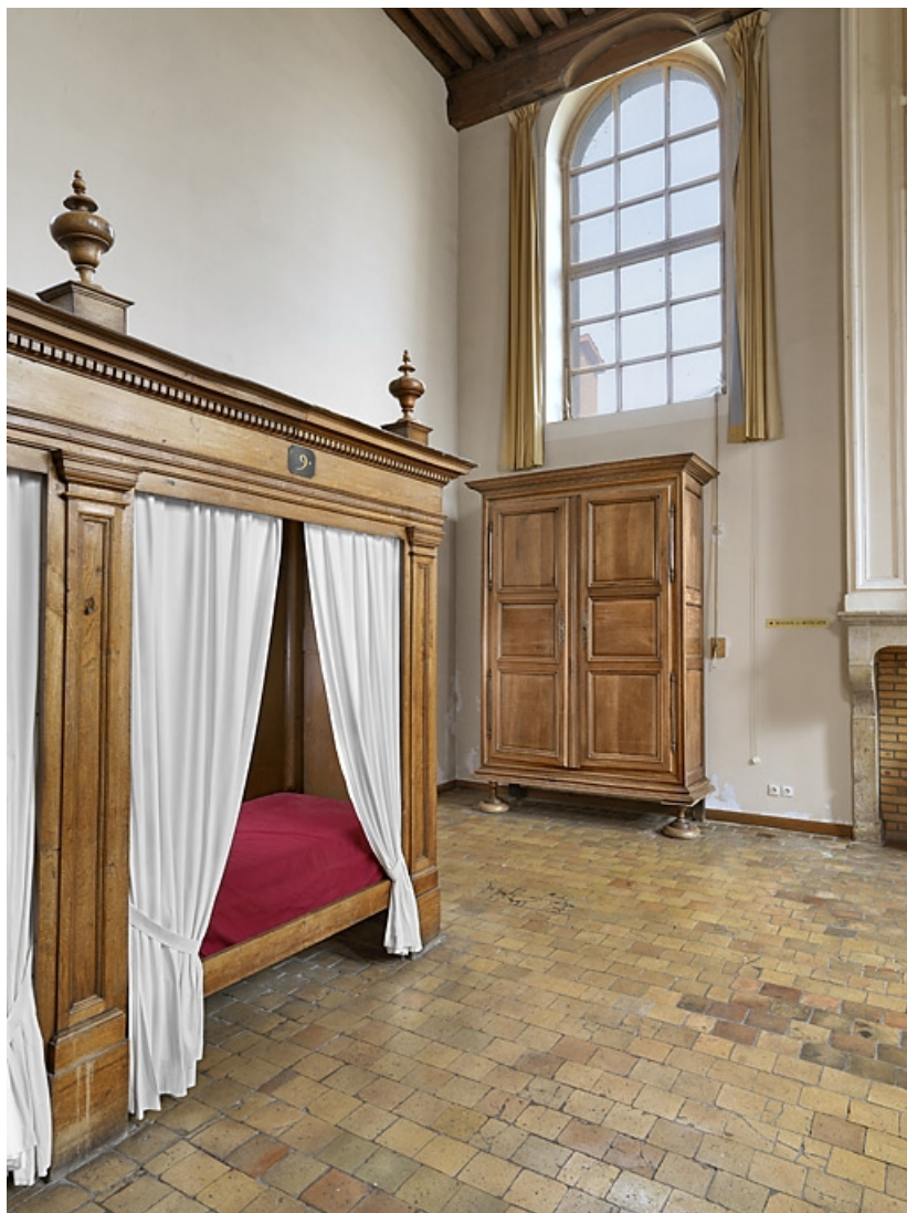
Vue d'un lit (en 2010).

21, Seurre, 14 rue du Faubourg Saint-Georges