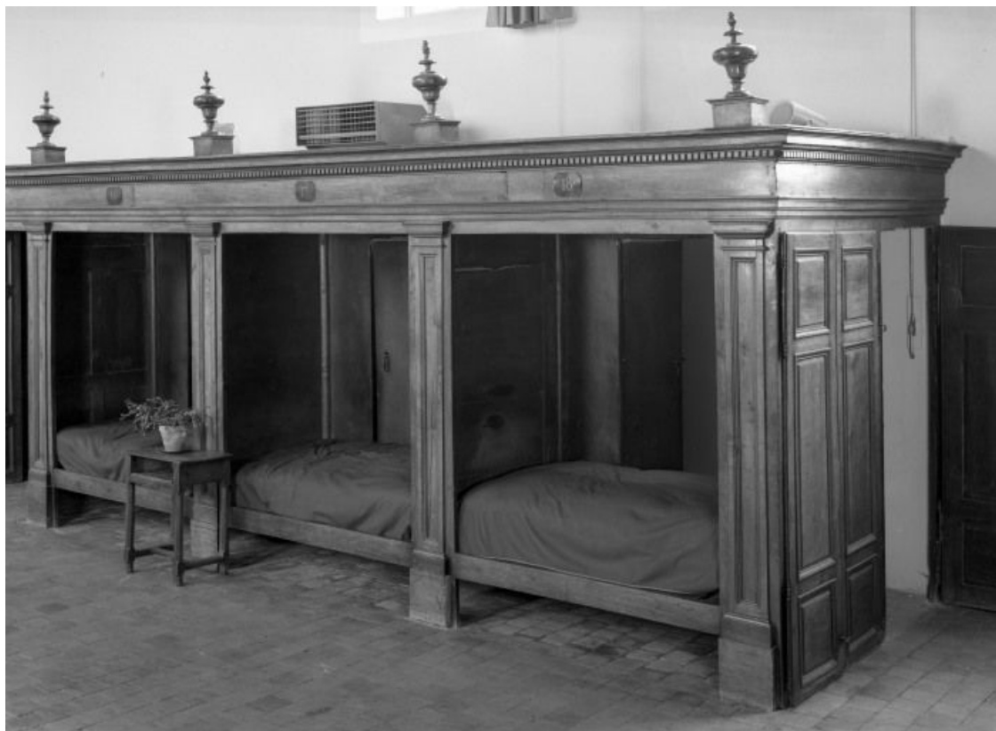
Travée droite, détail des trois lits antérieurs 21, Seurre, 14 rue du Faubourg Saint-Georges