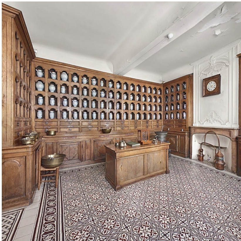
Vue d'ensemble (en 2010).

21, Seurre, 14 rue du Faubourg Saint-Georges