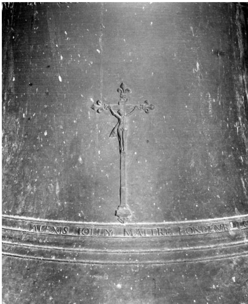
Détail : Christ en croix