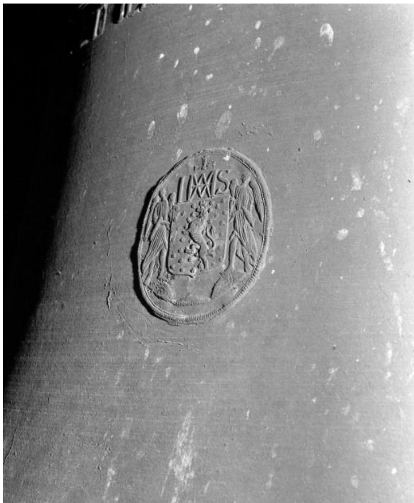
Détail : Armoiries de la ville de Seurre