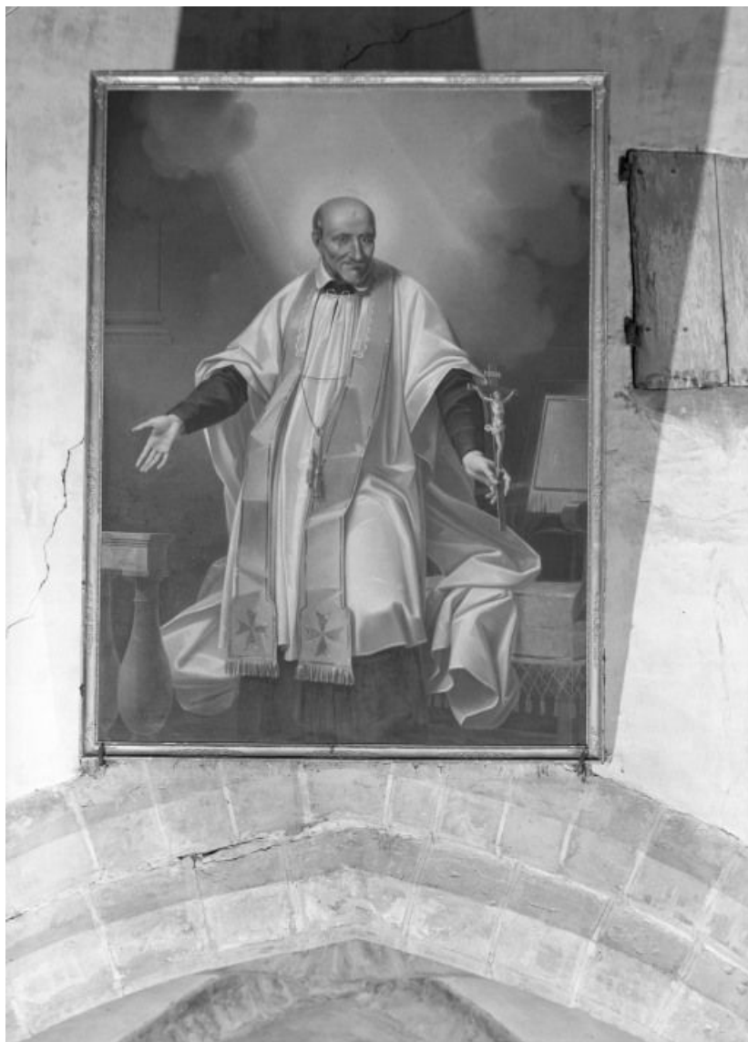
Saint Vincent de Paul