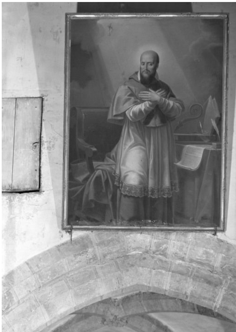
Saint François de Sales 21, Seurre rue des Ecoles