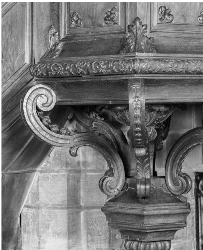
Cuve, détail du culot