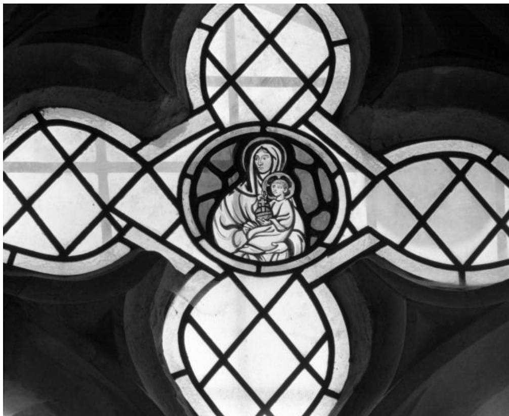
Détail : Vierge à l'Enfant 21, Seurre rue des Ecoles