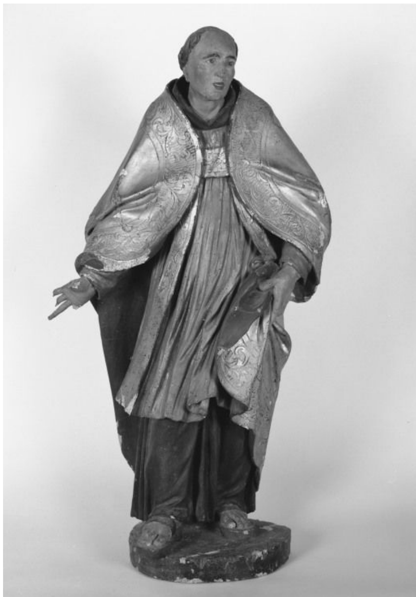
Saint Antoine de Padoue, face