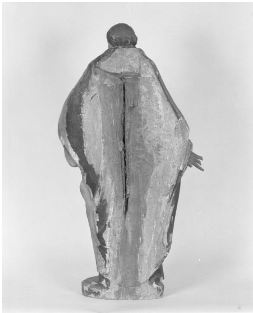
Saint Antoine de Padoue, revers