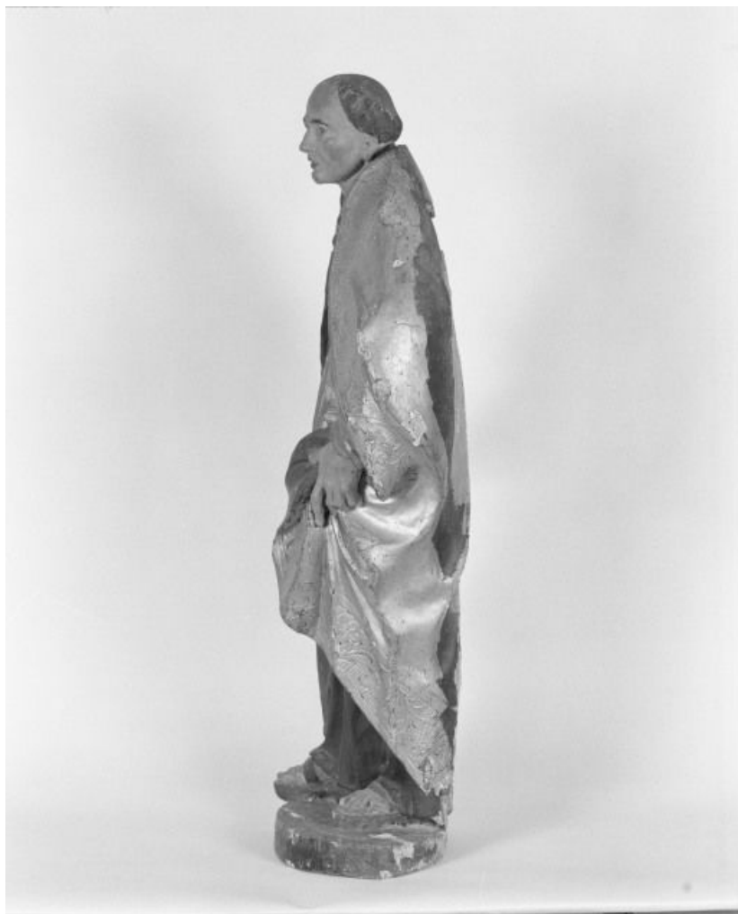
Saint Antoine de Padoue, profil gauche