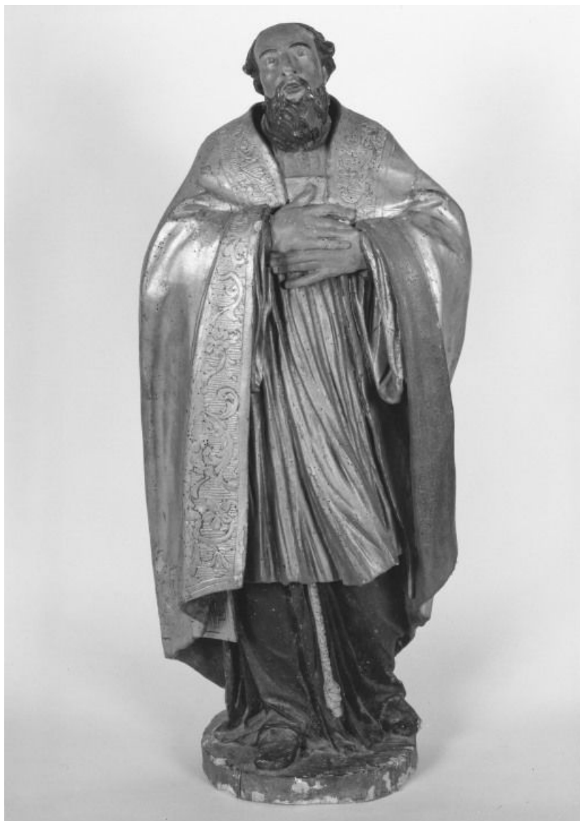
Saint Bonaventure, face