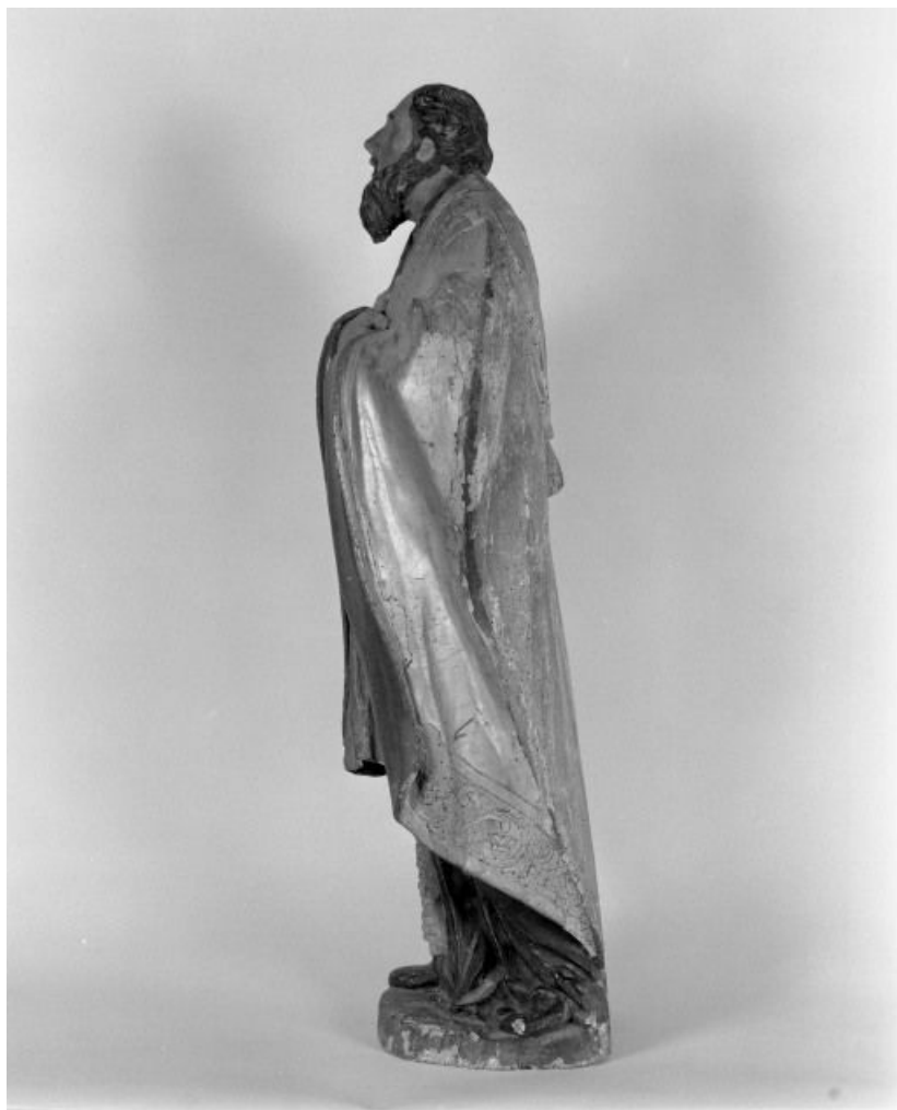
Saint Bonaventure, profil gauche