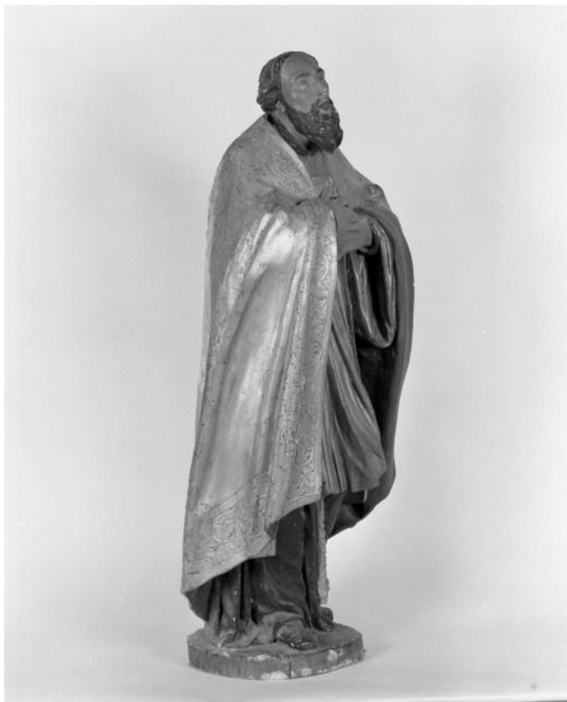
Saint Bonaventure, trois-quarts droit