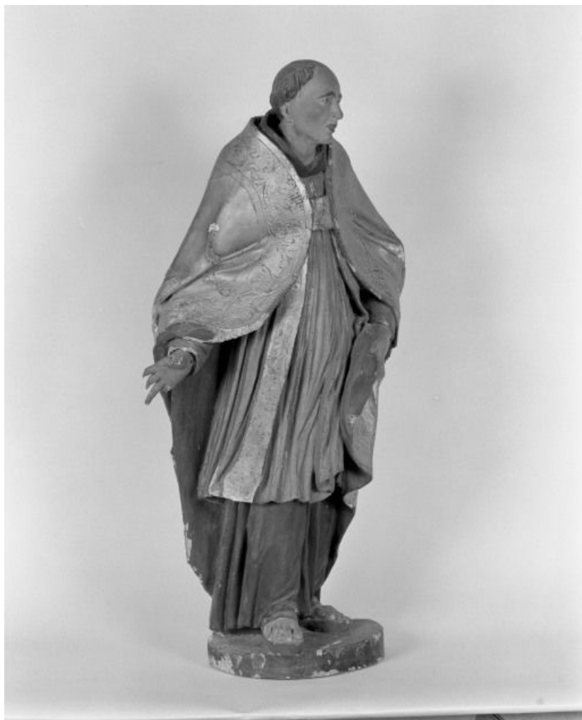
Saint Antoine de Padoue, trois-quarts droit