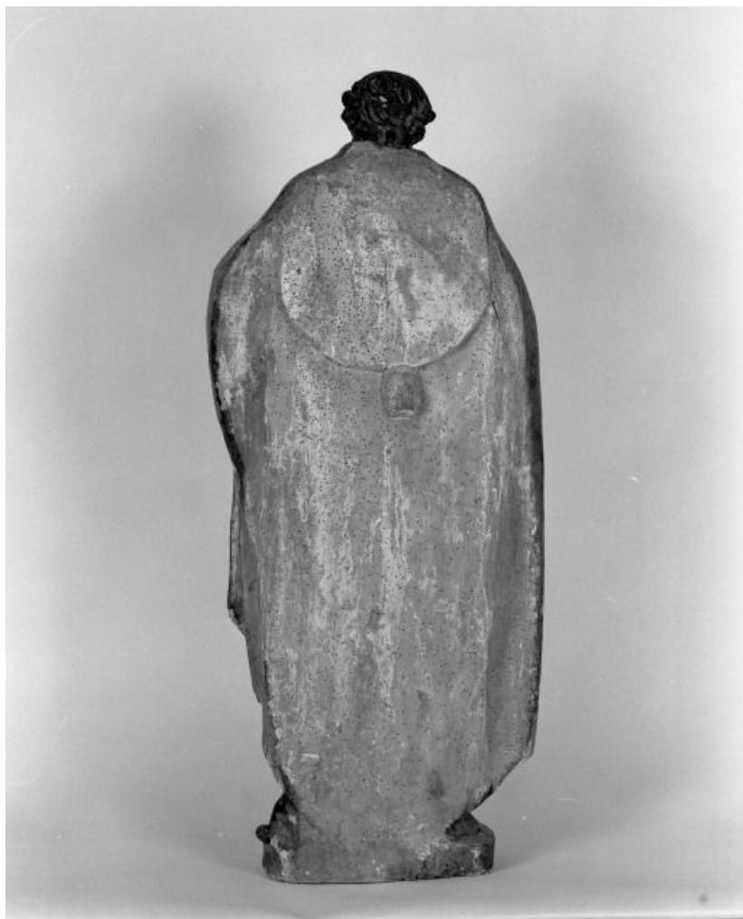
Saint Bonaventure, revers