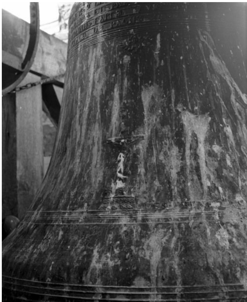
Détail, Christ en croix