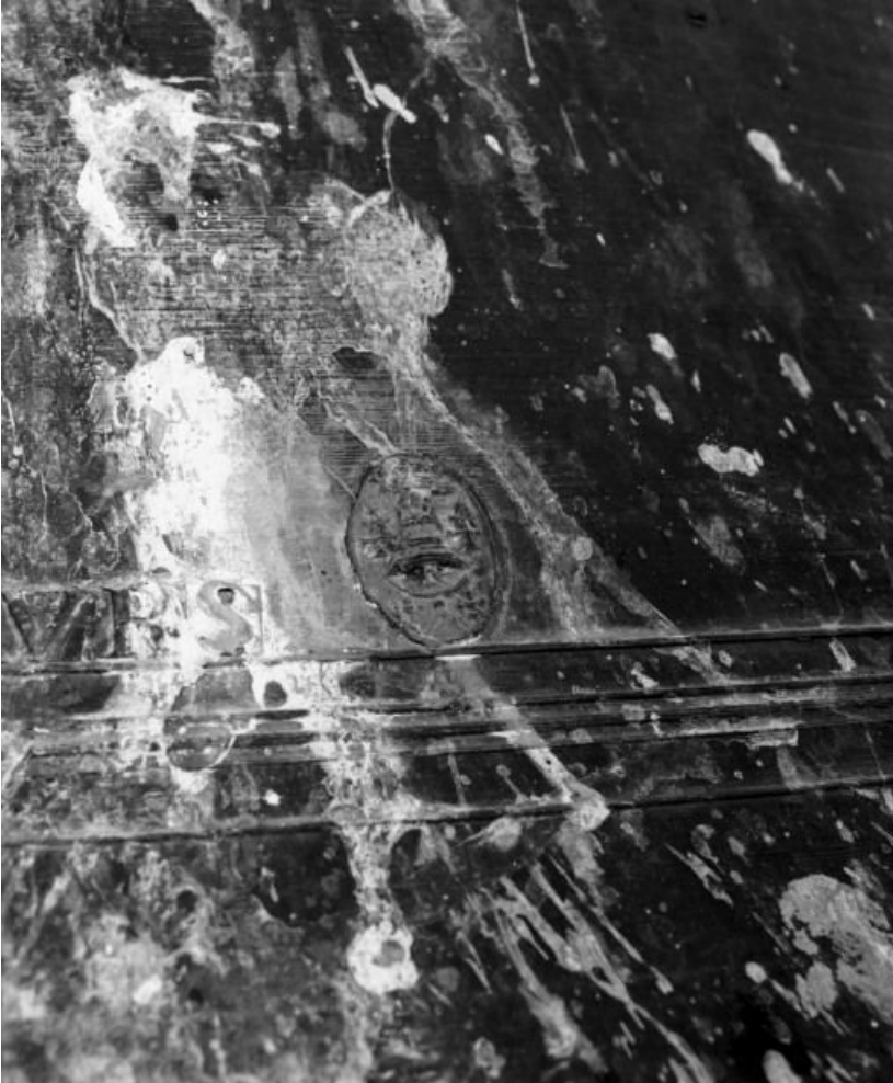
Détail, marque du fondeur.