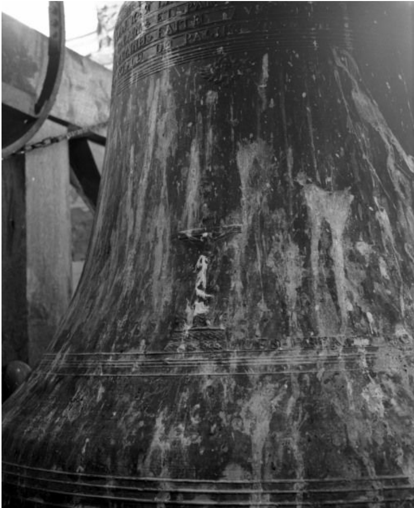
Détail, Christ en croix