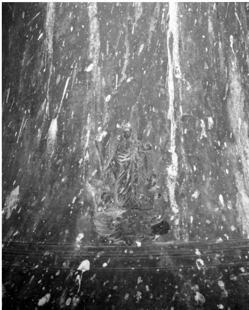
Détail, Vierge à l'Enfant