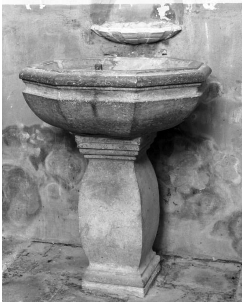
Vue générale sans couvercle