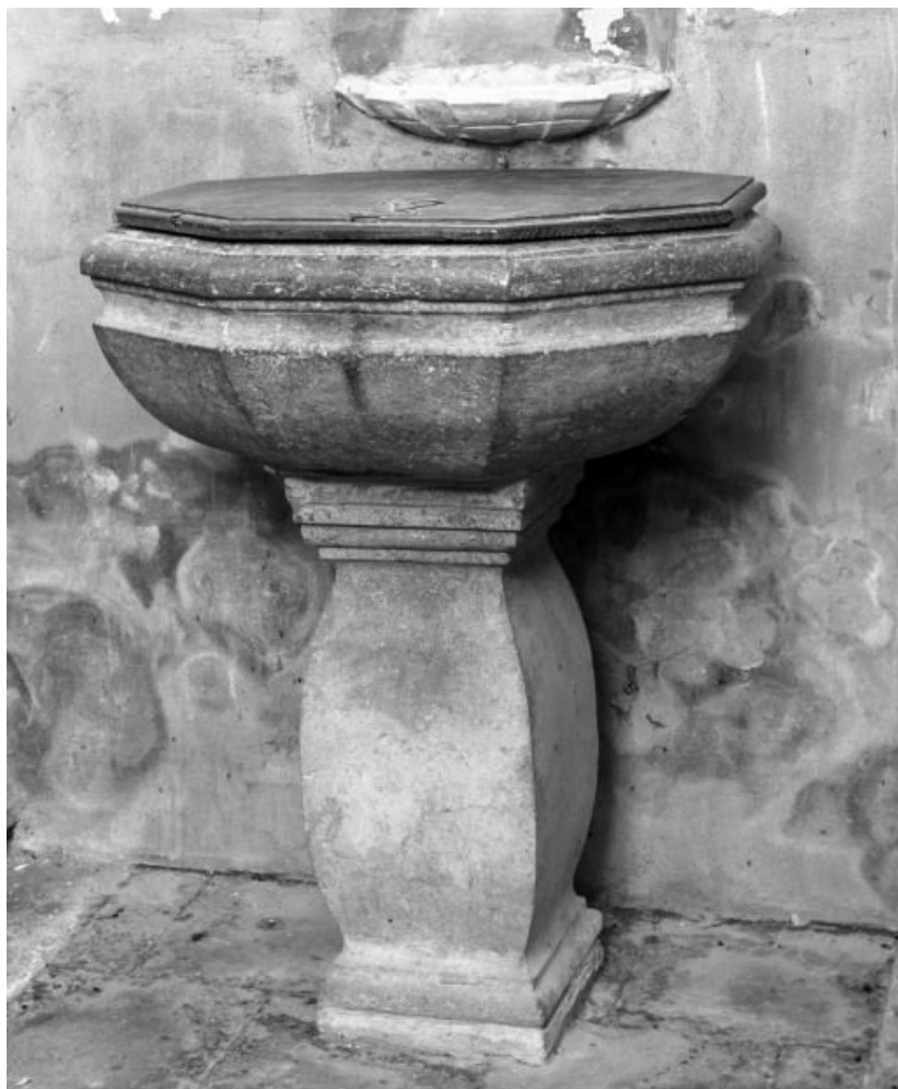
Vue générale avec couvercle