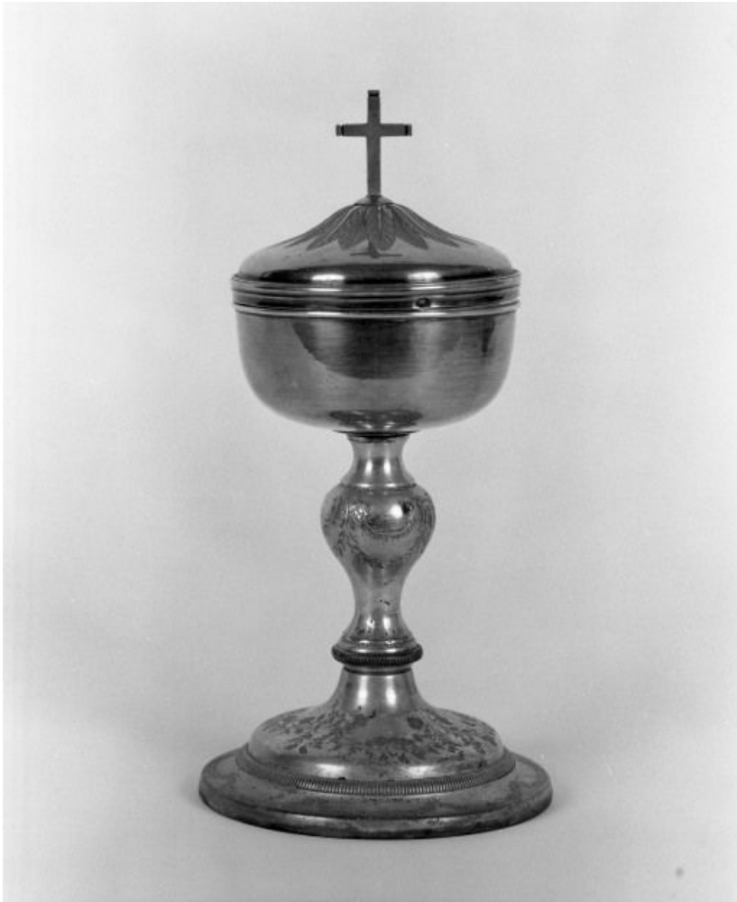
Vue générale 21, Montmain