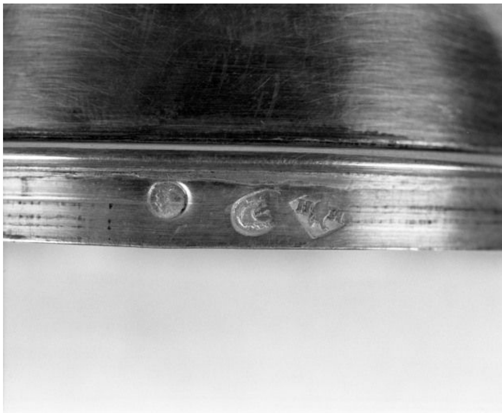
Détail de poinçons 21, Montmain