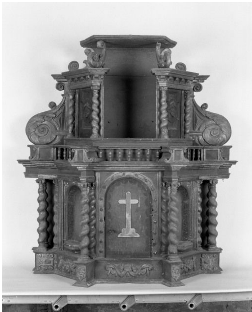
Vue de face 21, Montmain