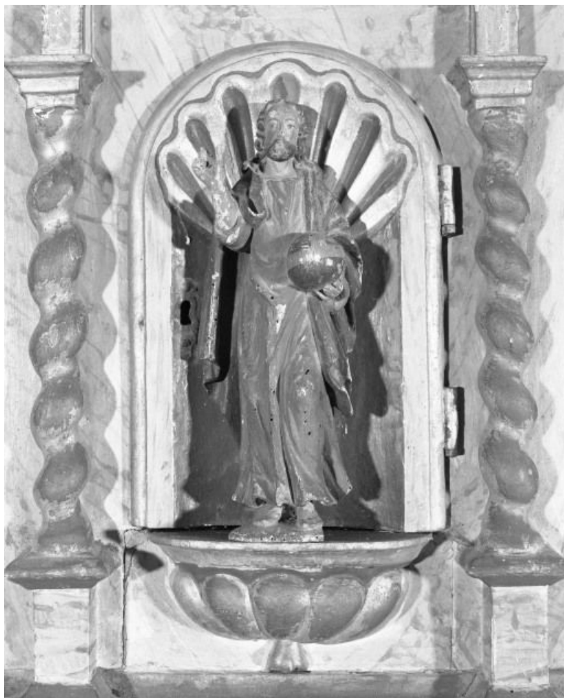
Statuette, Salvator Mundi