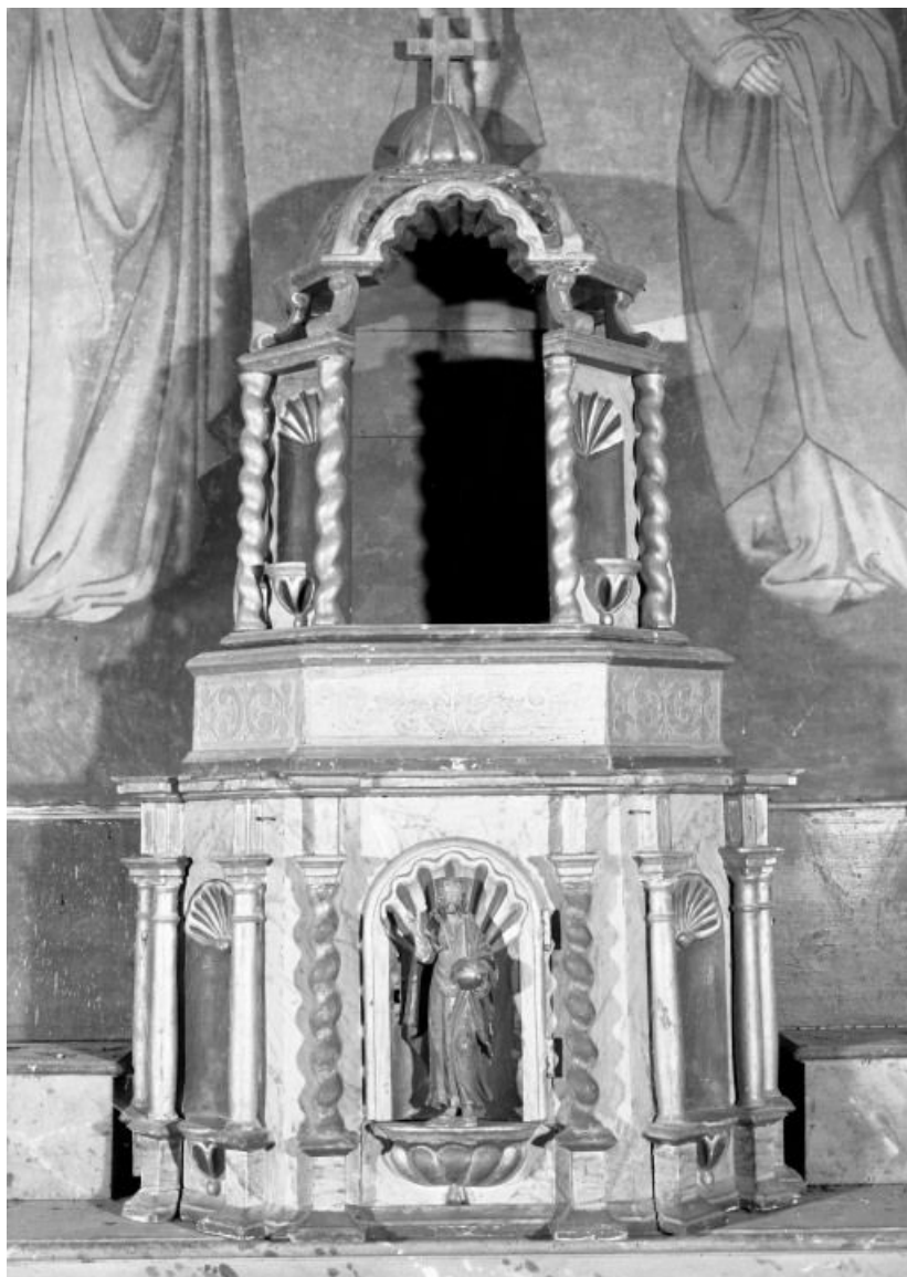
Vue de face 21, Montmain