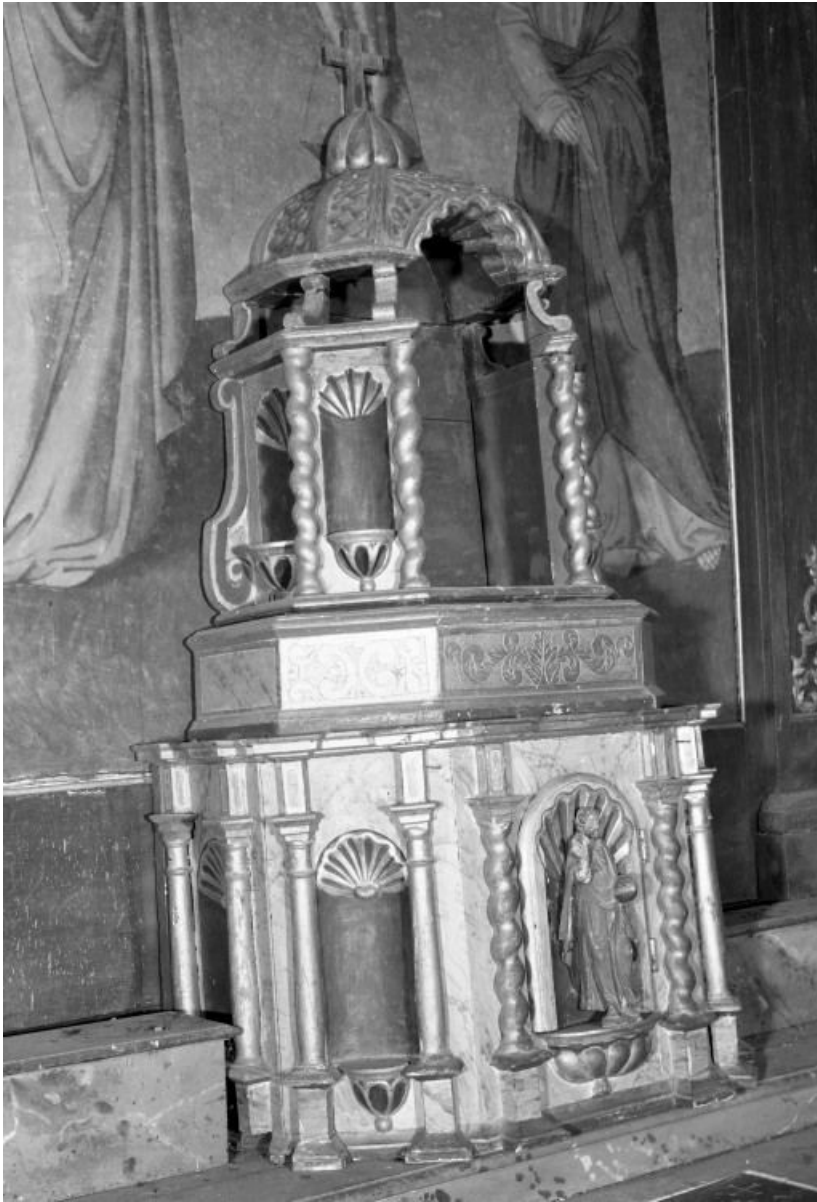
Vue de trois-quarts 21, Montmain