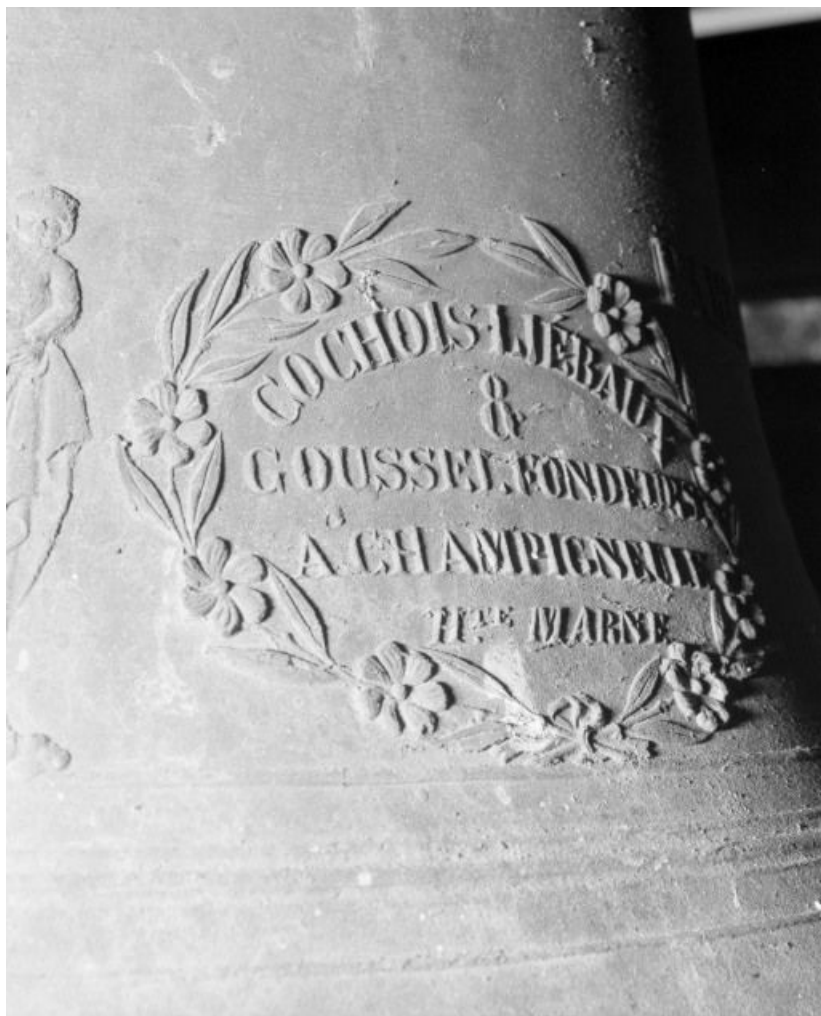
Détail : marque de fondeur