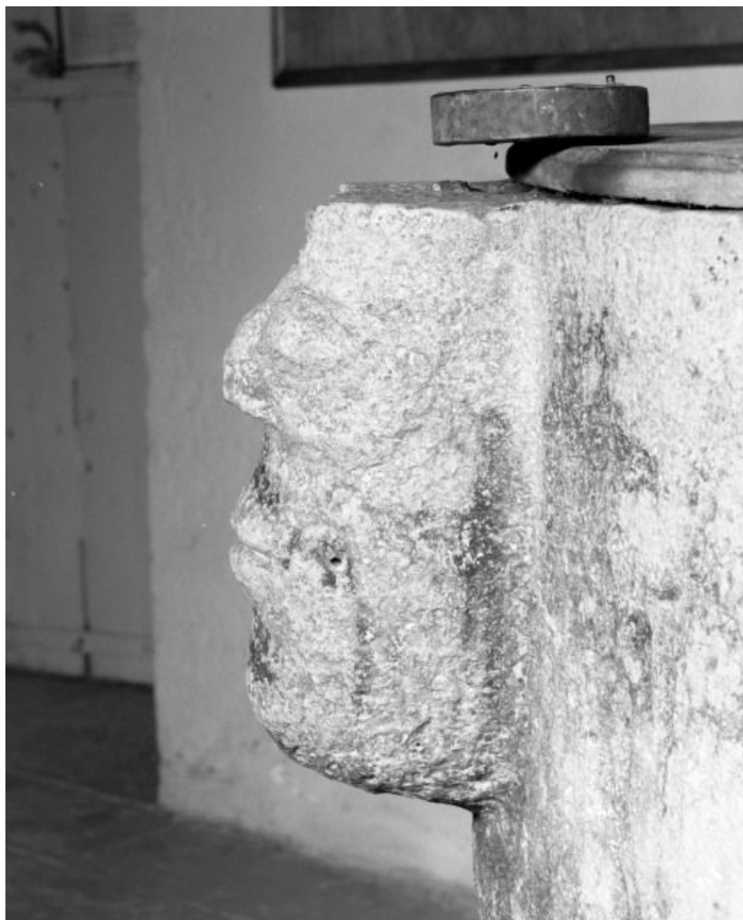
Détail : tête humaine