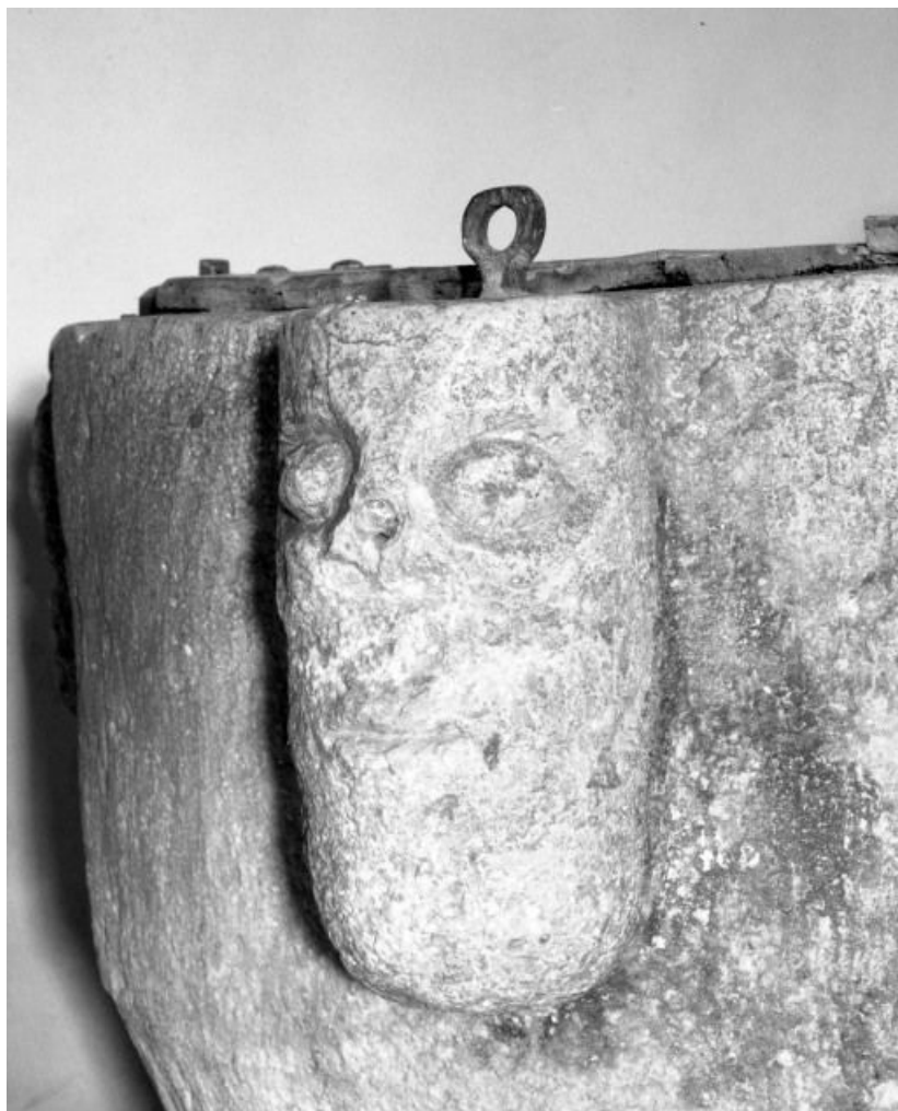
Détail : tête humaine