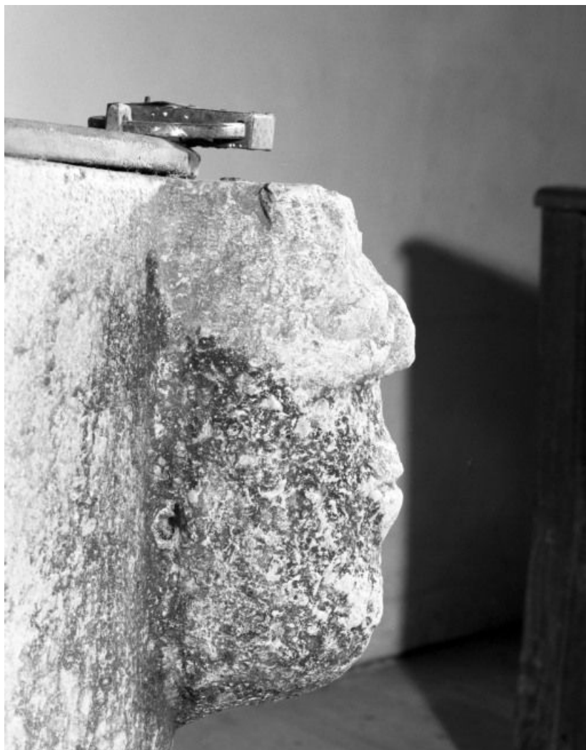
Détail : tête humaine 21, Llanthes