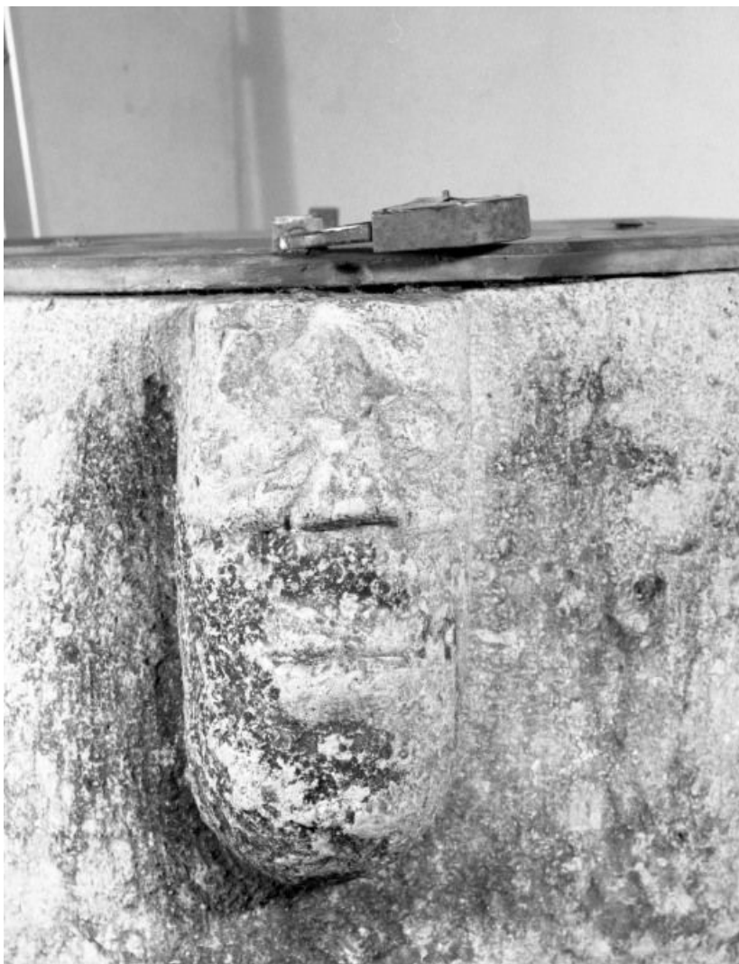
Détail : tête humaine