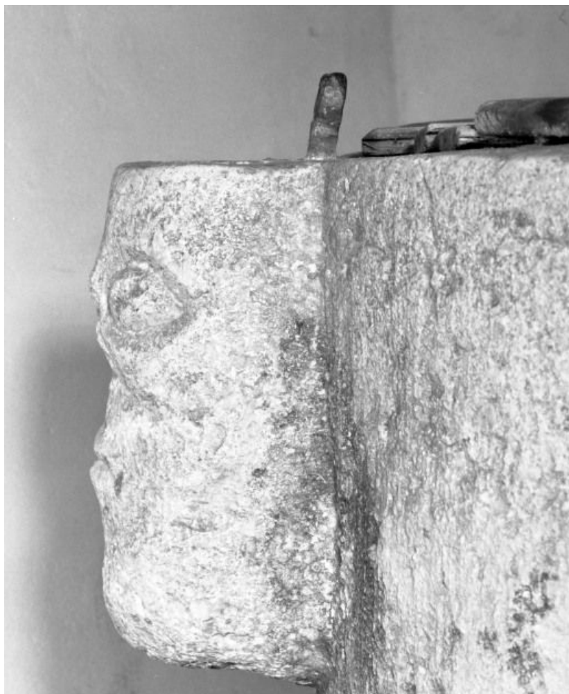
Détail : tête humaine