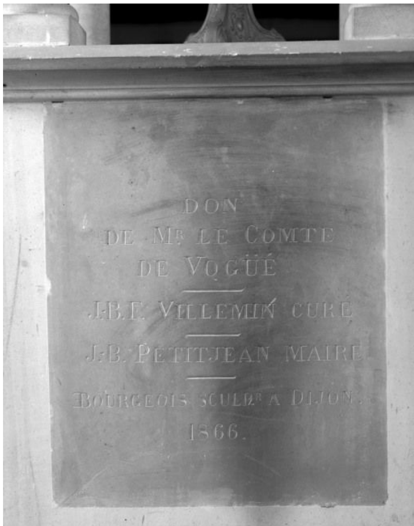
Détail de l'inscription gravée au revers du tabernacle