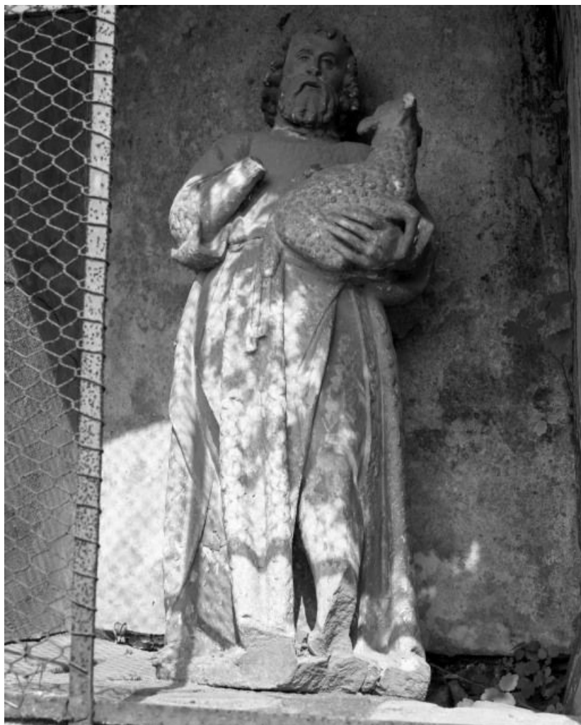
Vue d'ensemble. 21, Labruyère RD 34