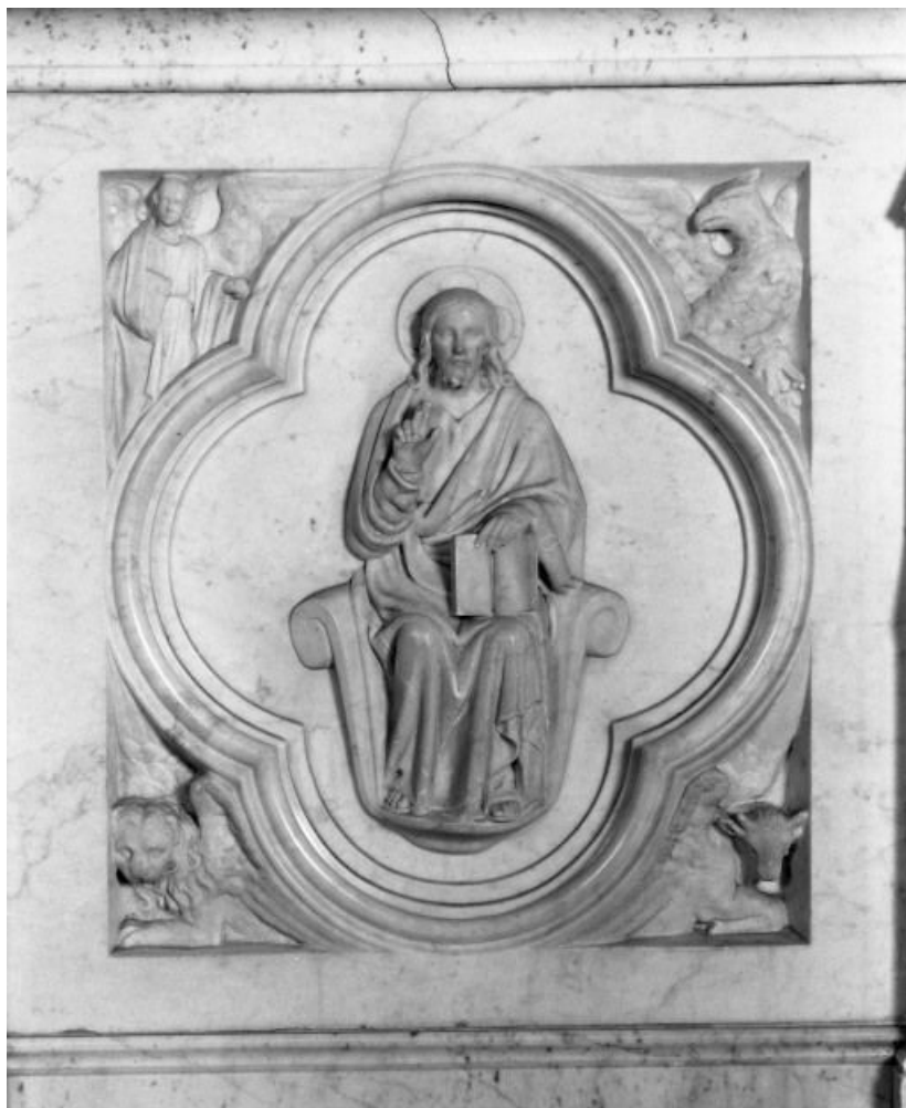
Devant d'autel, détail: le Christ et le Tétramorphe

21, Labergement-lès-Seurre rue de l' Eglise