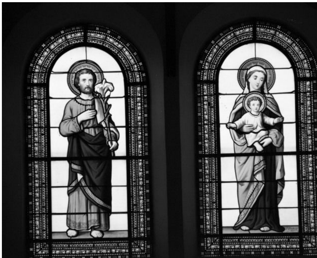
Saint Joseph et la Vierge à l'Enfant. 21, Glanon