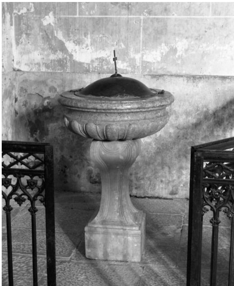
Vue générale 21, Corgengoux