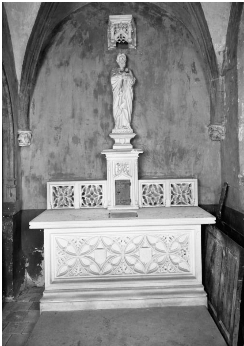
Vue générale 21, Corgengoux