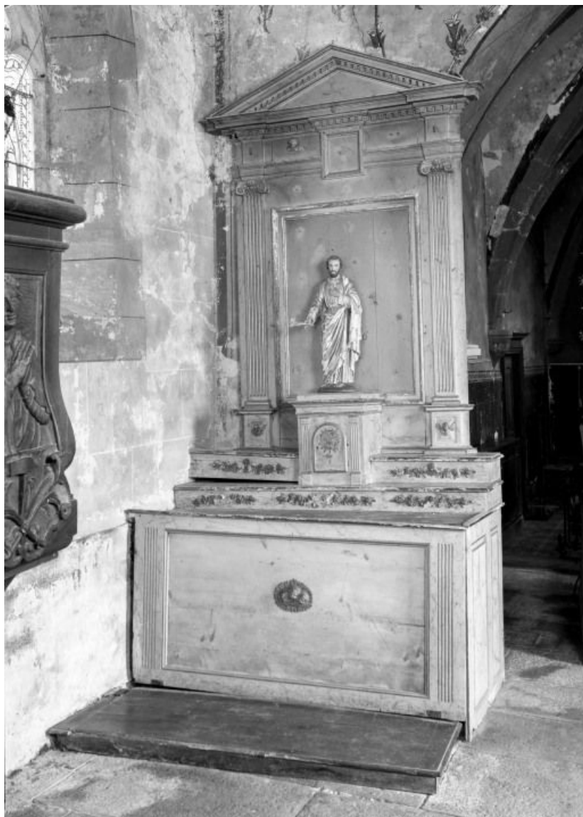
Autel retable gauche 21, Corgengoux