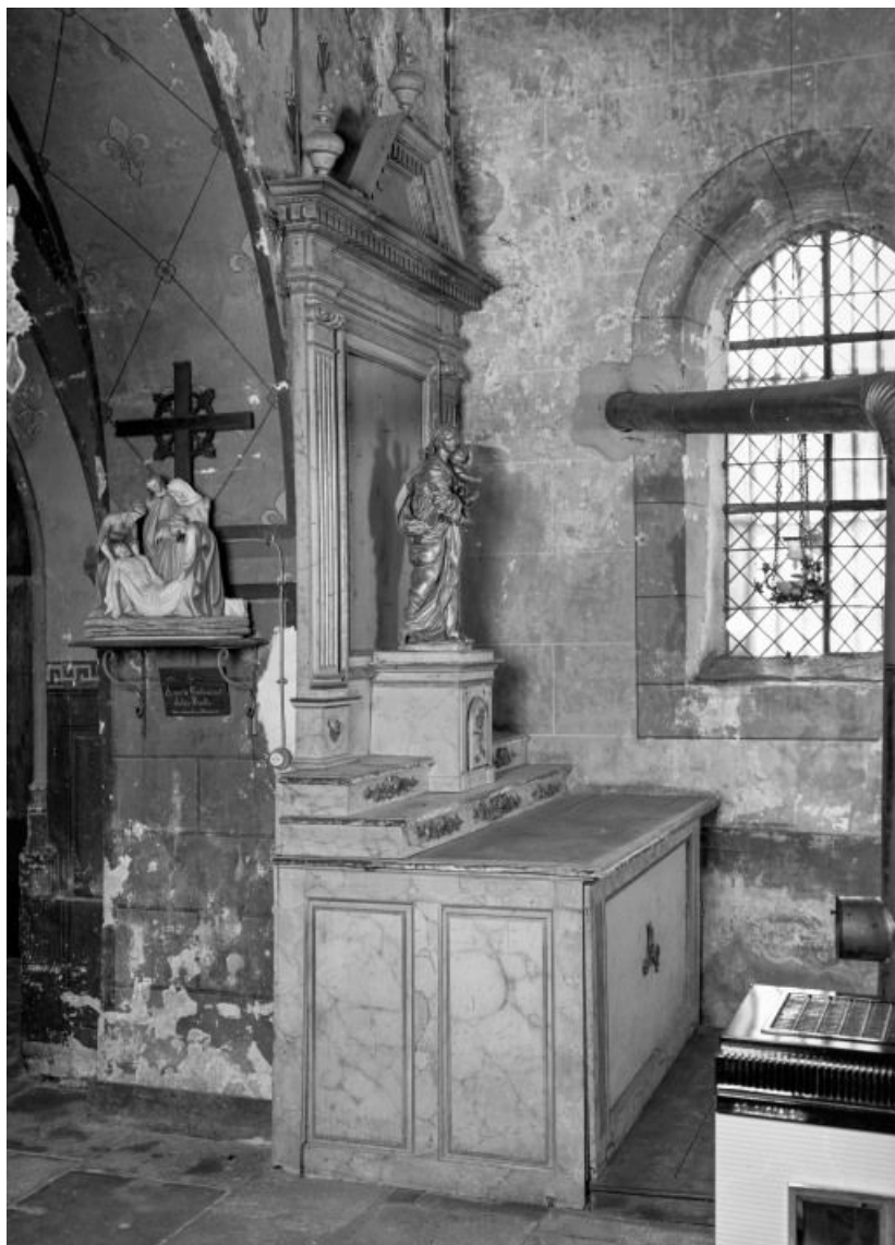
Autel retable droit 21, Corgengoux