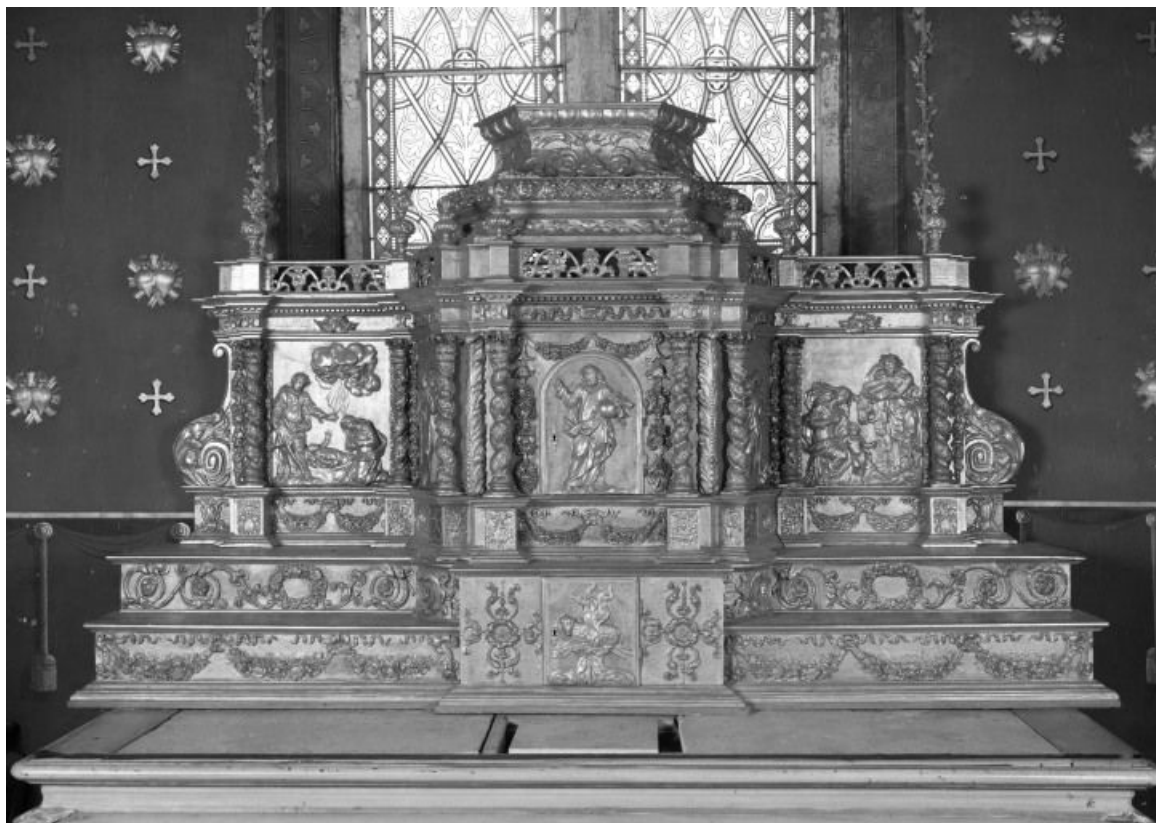
Vue d'ensemble 21, Corgengoux