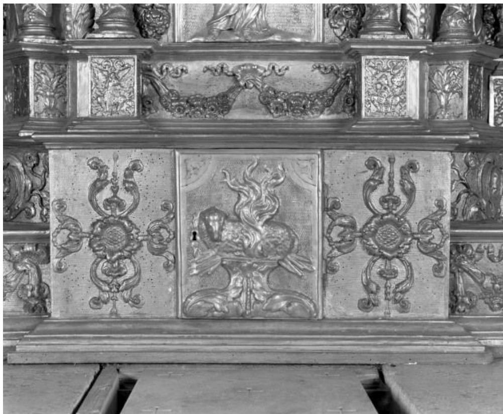
Détail: Agneau mystique 21, Corgengoux