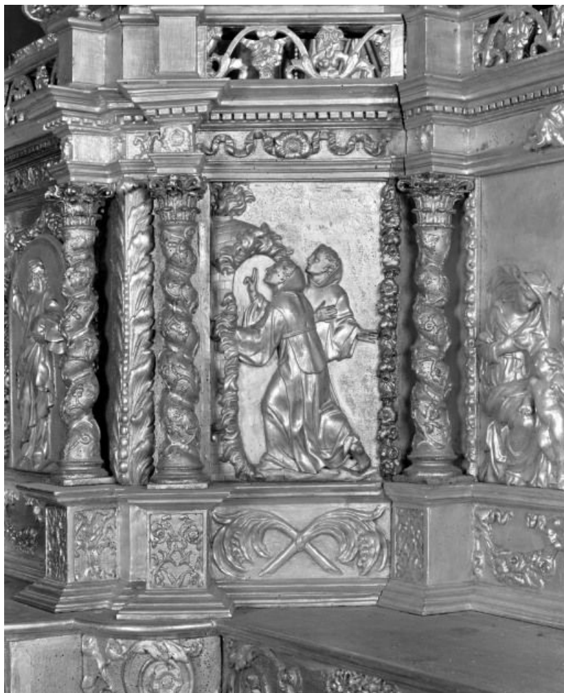
Détail: franciscains 21, Corgengoux