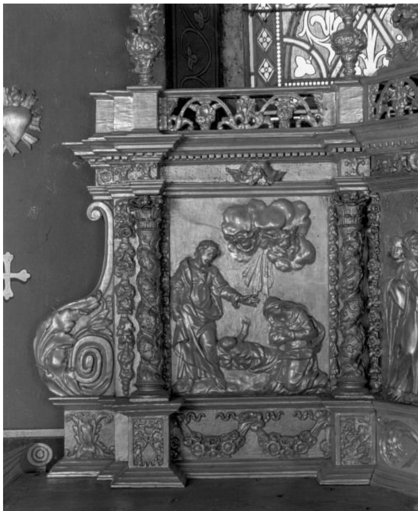
Détail: Nativité 21, Corgengoux