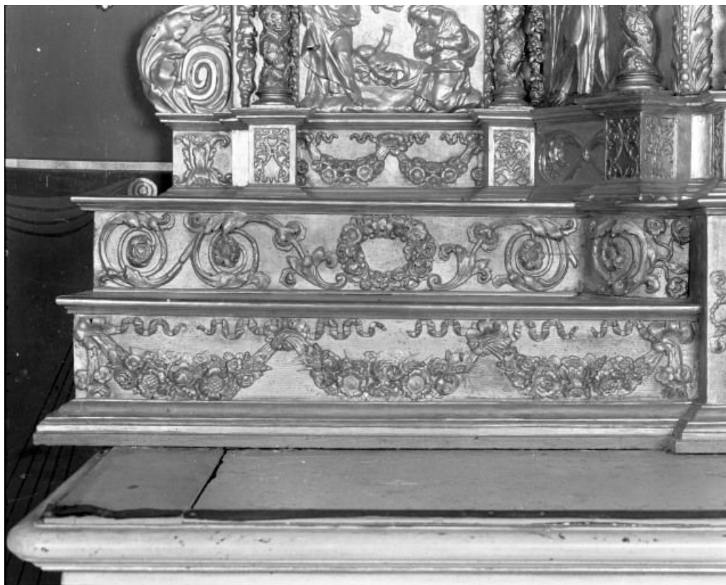
Détail: décor végétal 21, Corgengoux