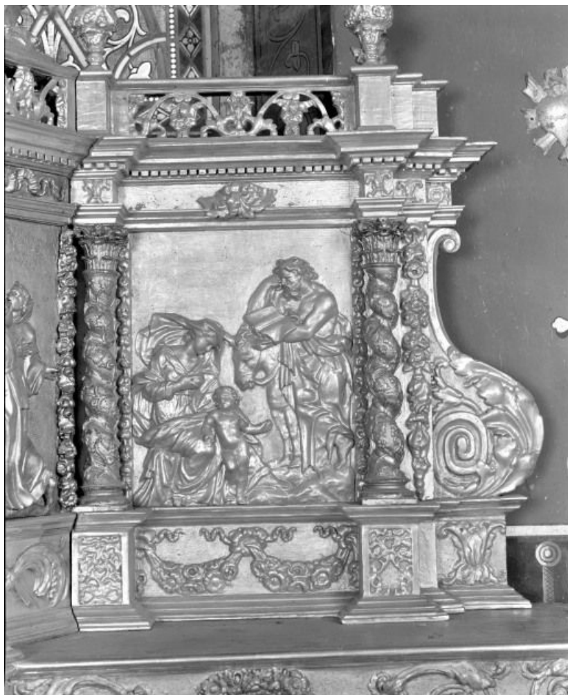
Détail: repos pendant la fuite en Egypte 21, Corgengoux