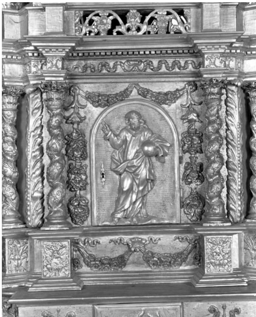
Détail de la porte du tabernacle: Salvator Mundi 21, Corgengoux