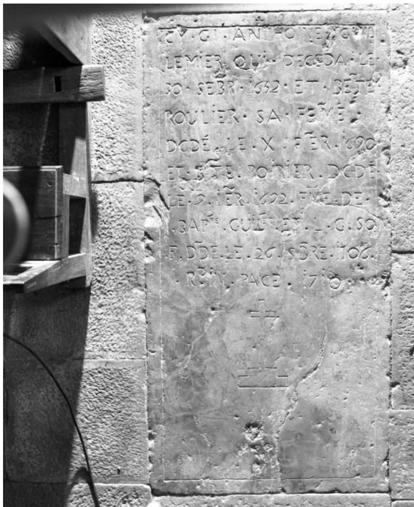
Vue générale 21, Corgengoux