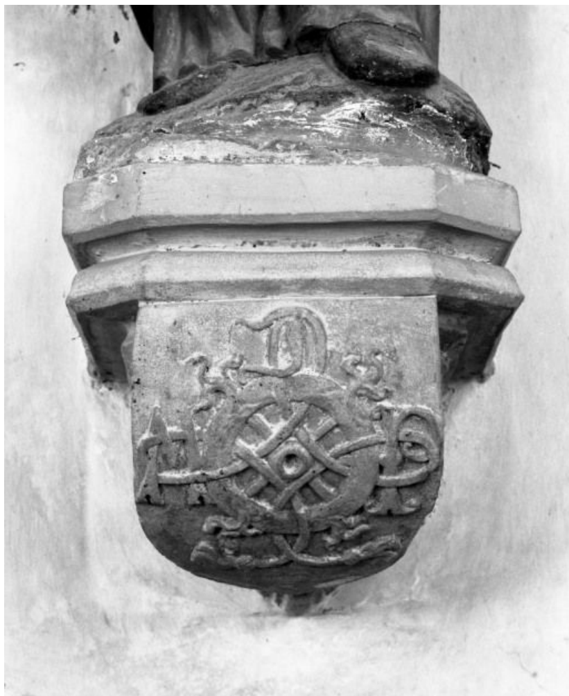
Vue de face 21, Corberon