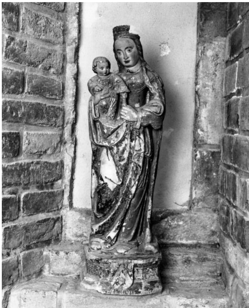
Vue de face 21, Chamblanc