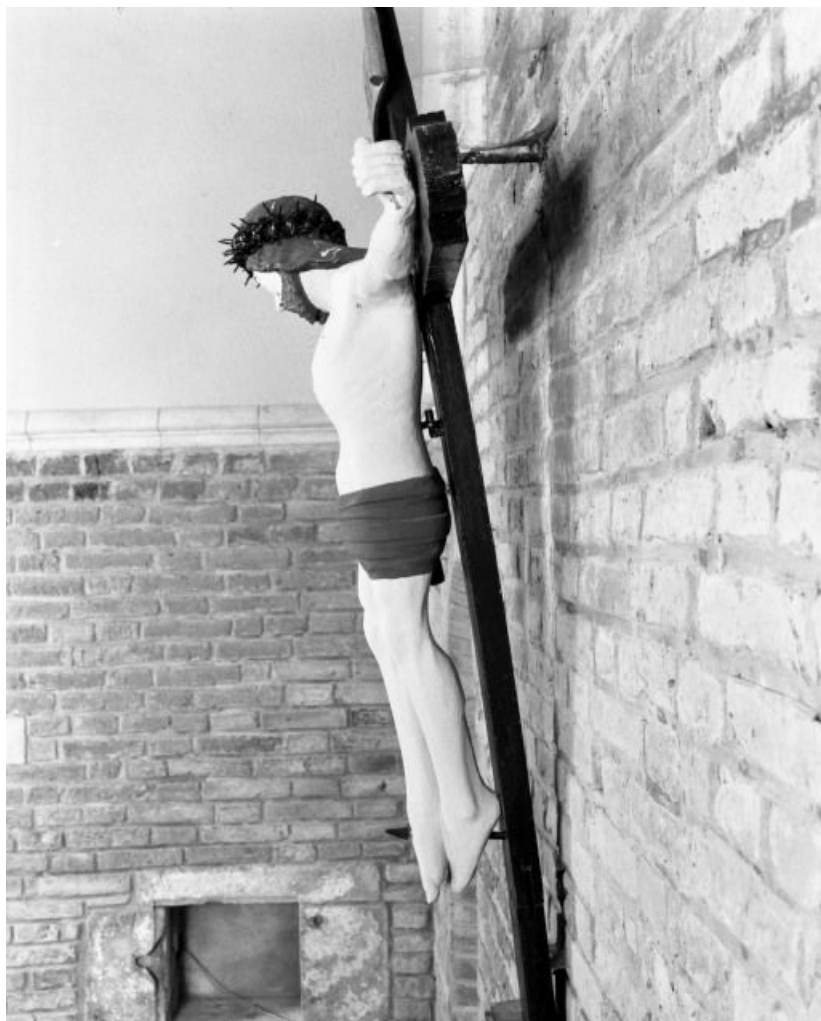
Vue de profil 21, Chamblanc