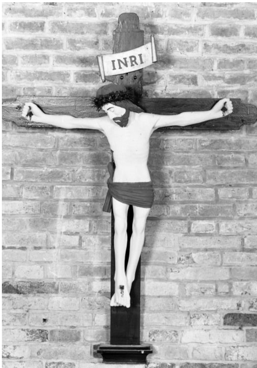
Vue de face 21, Chamblanc