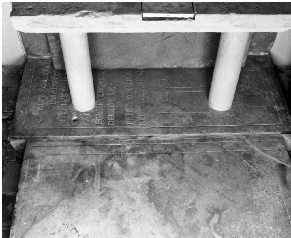
Vue d'ensemble 21, Chamblanc