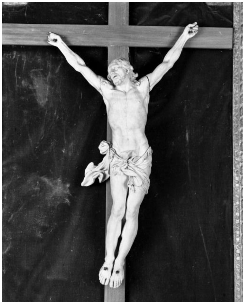
Détail du Christ