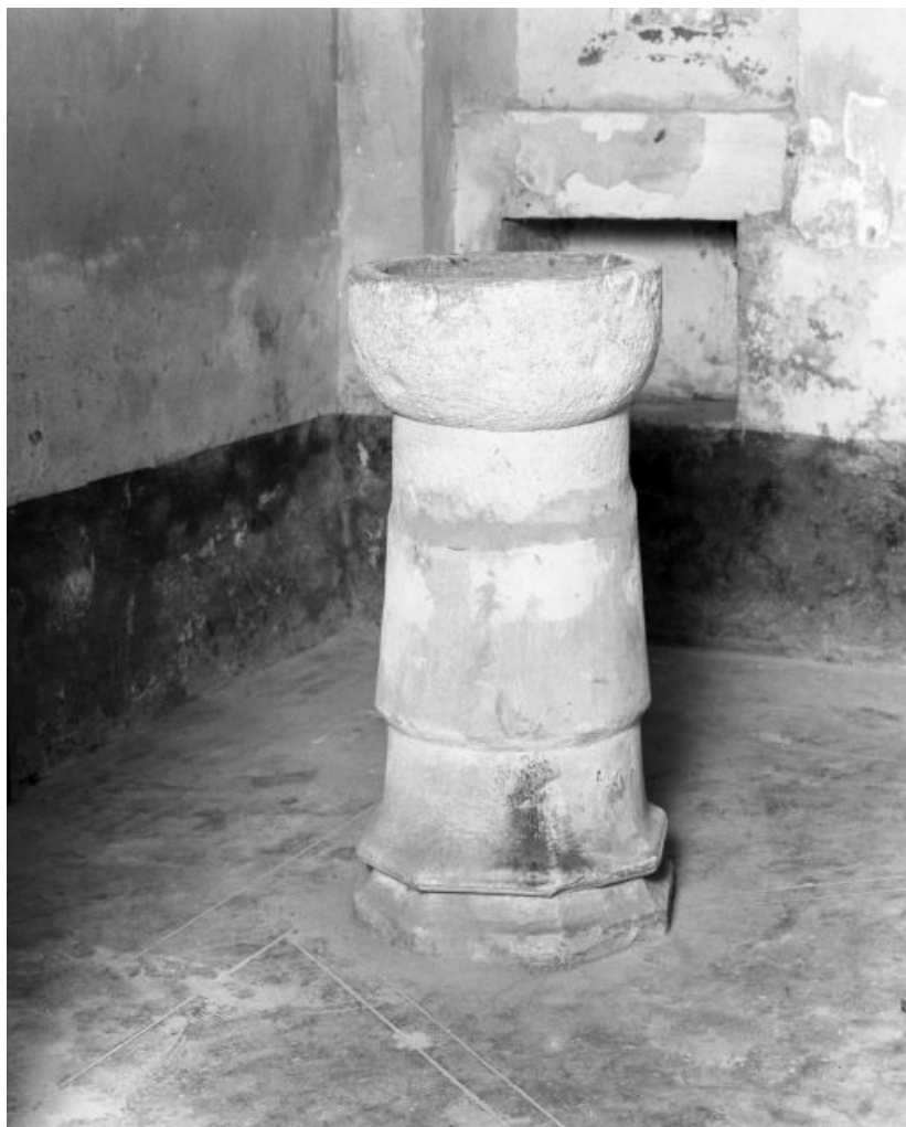
Vue générale sans couvercle