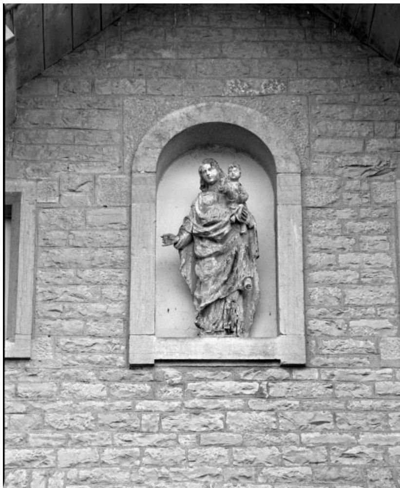
Statue dans une niche.