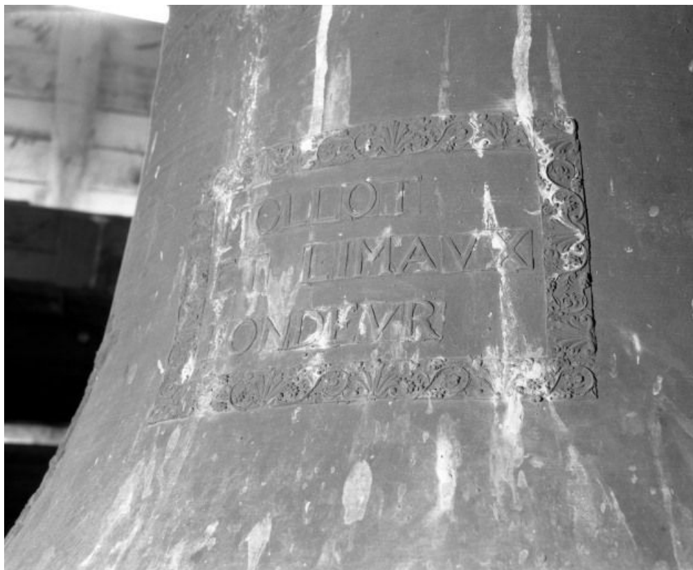
Marque de fondeurs sur la 2e cloche 21, Bagnot