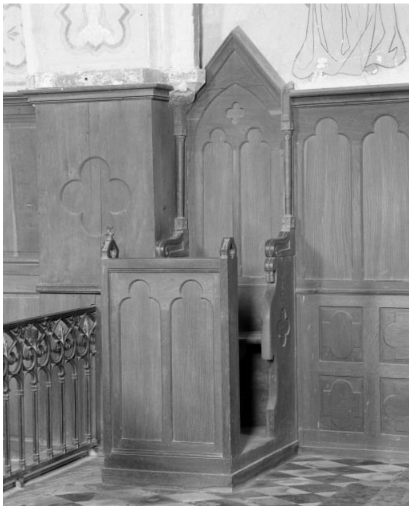
Lambris et stalle gauche