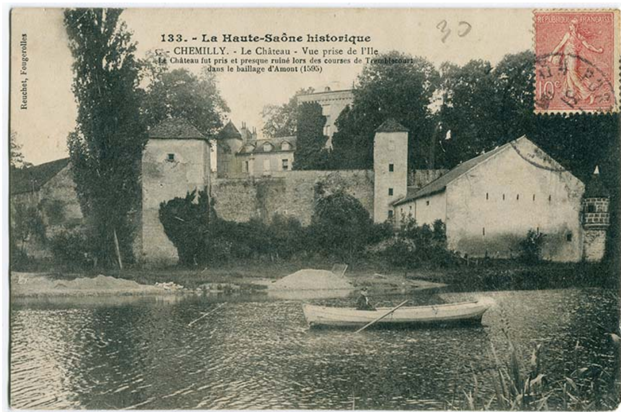
Vue d'ensemble du château, prise depuis l'île 70, Chemilly