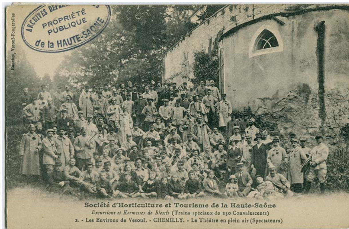
Le théâtre en plein air de Chemilly. Excursion et kermesse de blessés, trains spéciaux de 250 militaires convalescents, le 15 septembre 1916.