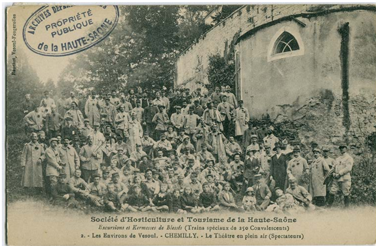
Le théâtre en plein air de Chemilly. Excursion et kermesse de blessés, trains spéciaux de 250 militaires convalescents, le 15 septembre 1916.