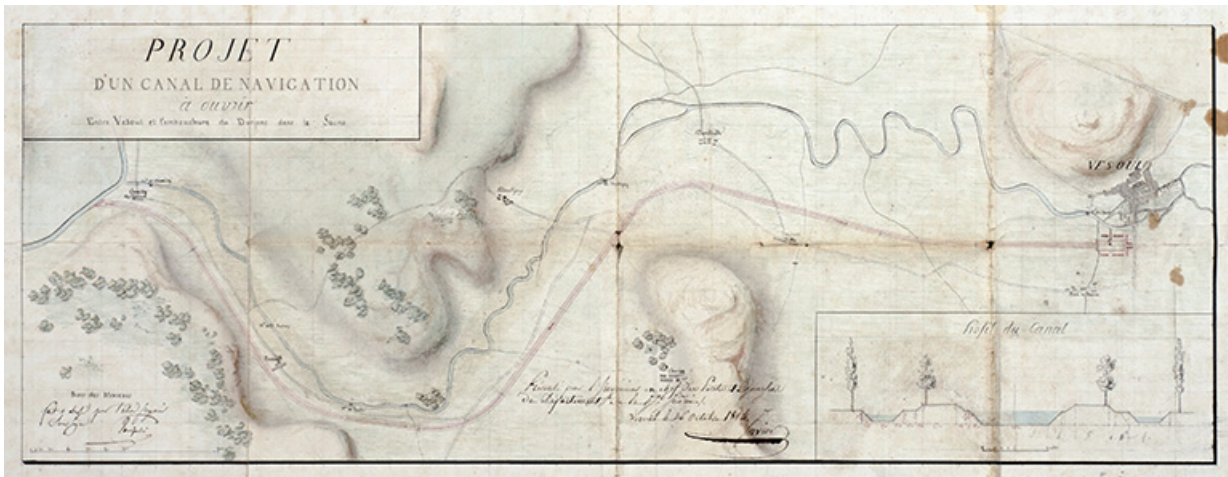
Projet de canal de navigation à ouvrir entre Vesoul et l'embouchure du Durgeon, 1814.