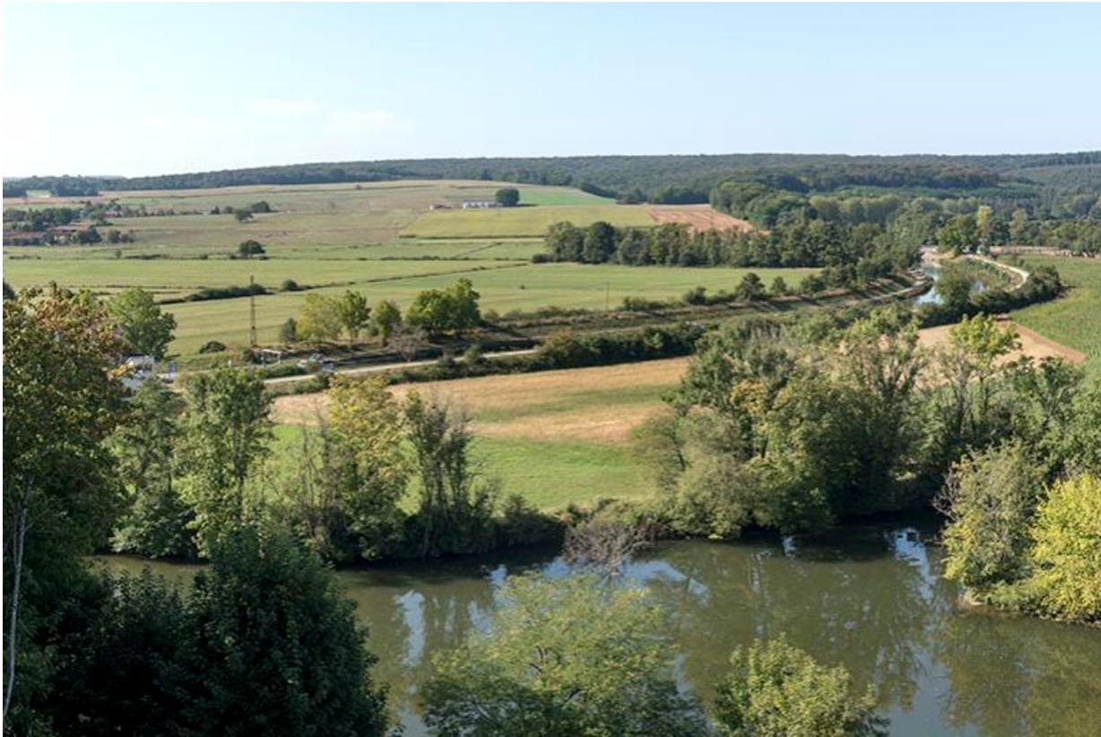
Les méandres de la Saône