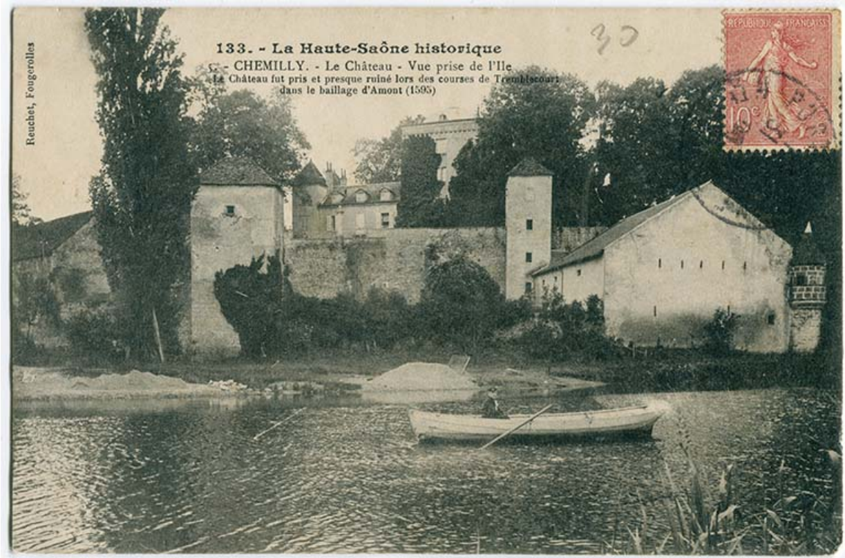
Vue d'ensemble du château, prise depuis l'île 70, Chemilly