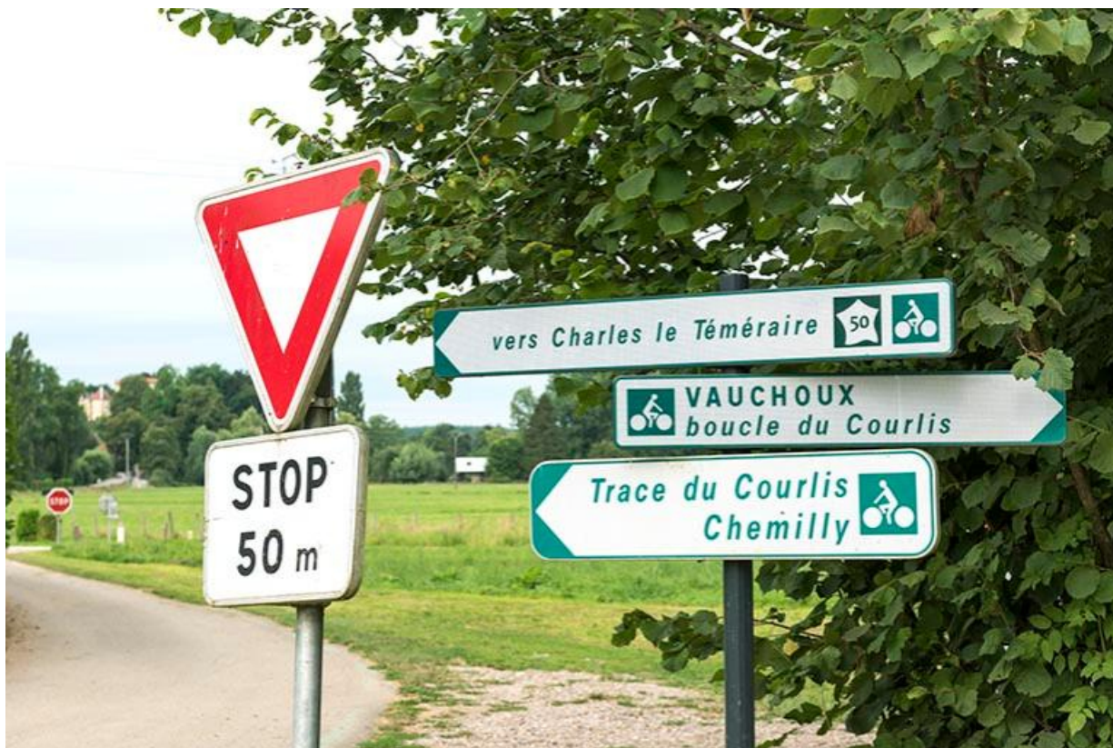
Entrée du village depuis la route départementale 6. La villa Kielwasser et le château en arrière plan. 70, Chemilly