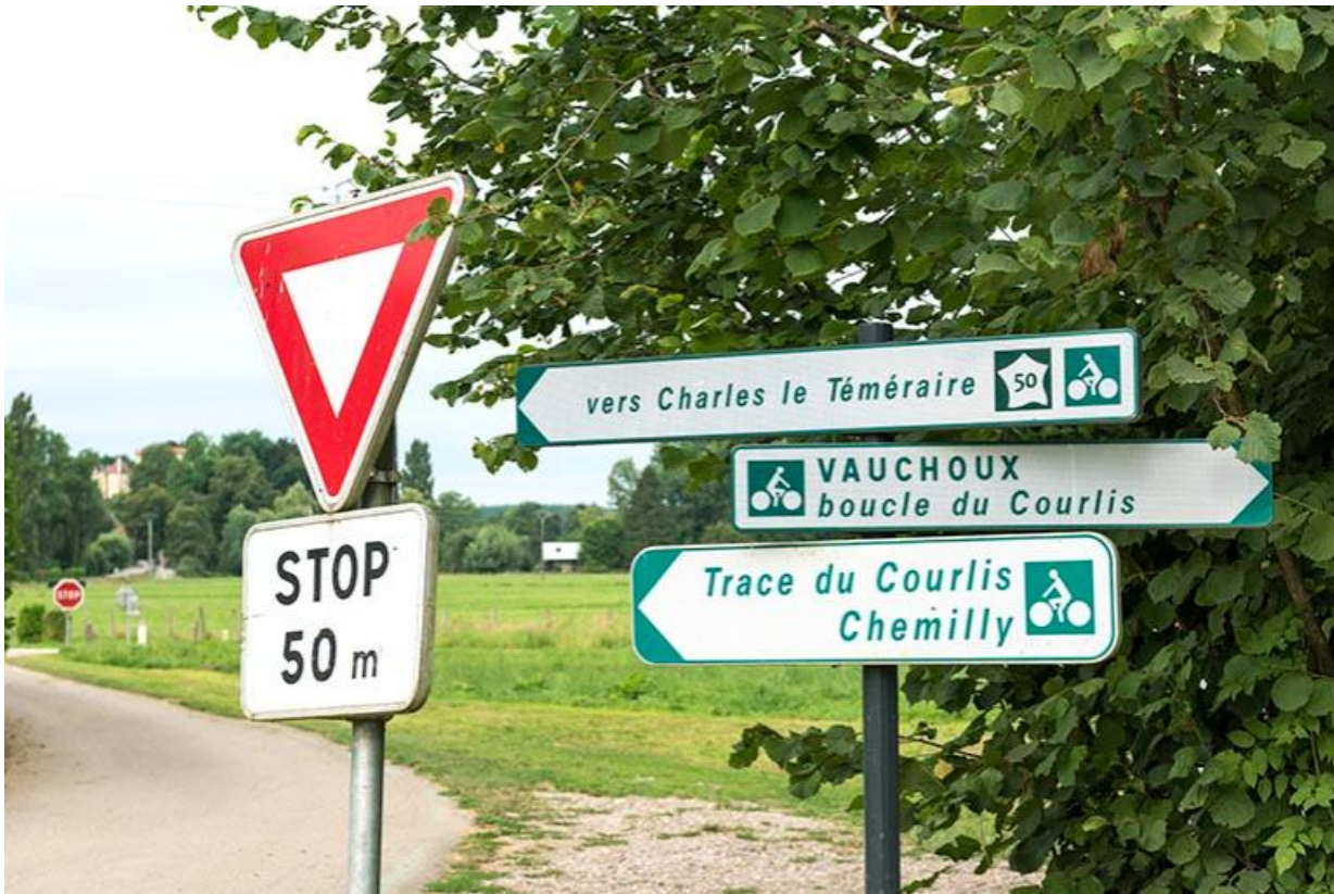
Entrée du village depuis la route départementale 6. La villa Kielwasser et le château en arrière plan. 70, Chemilly