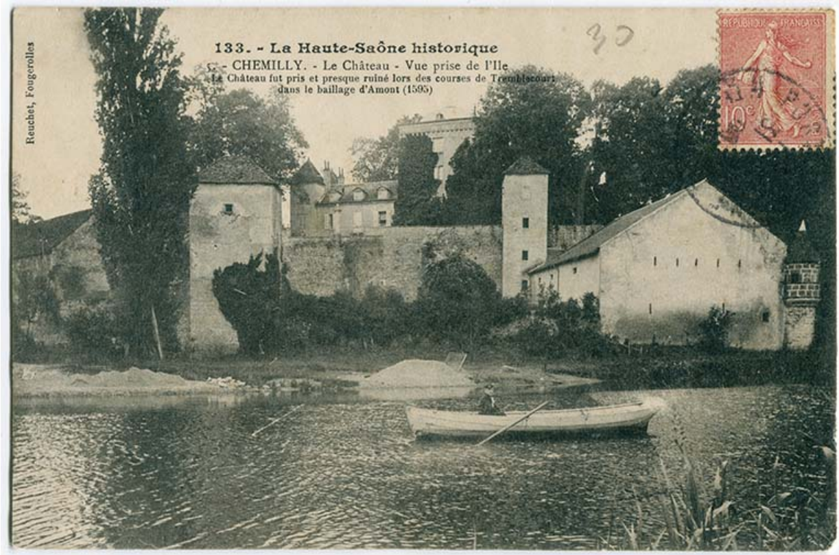
Vue d'ensemble du château, prise depuis l'île 70, Chemilly