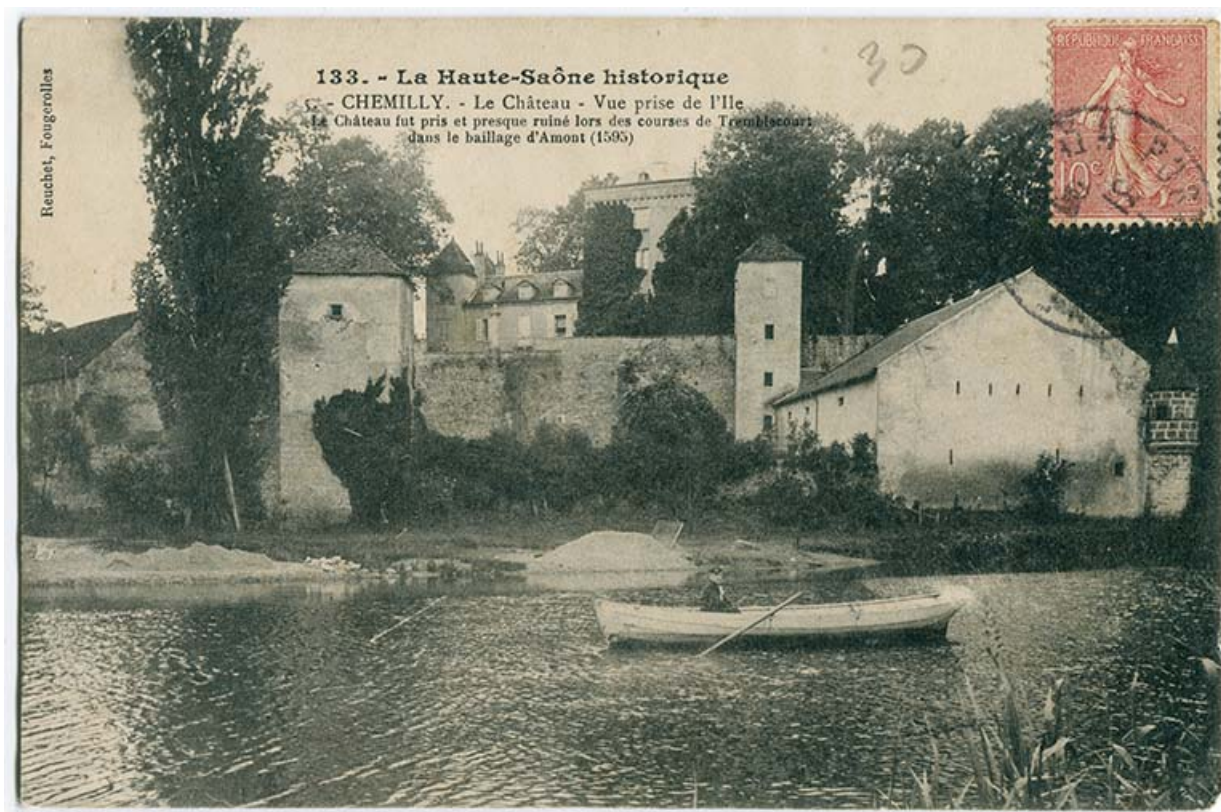
Vue d'ensemble du château, prise depuis l'île 70, Chemilly

Lieu de conservation : Archives départementales de la Haute-Saône, Vesoul - Cote du document : 11Fi148/7