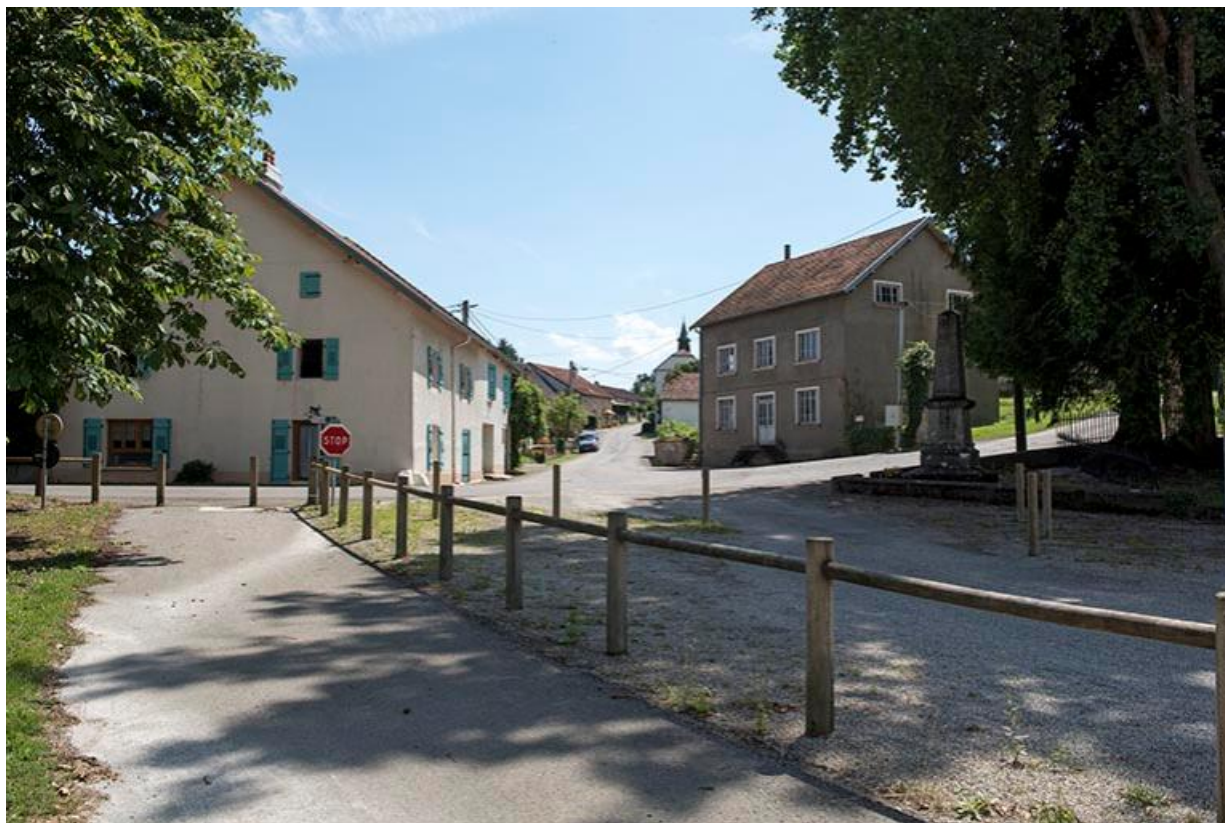
Vue de la véloroute Charles le Téméraire, la Grande rue et l'huilerie 70, Chemilly