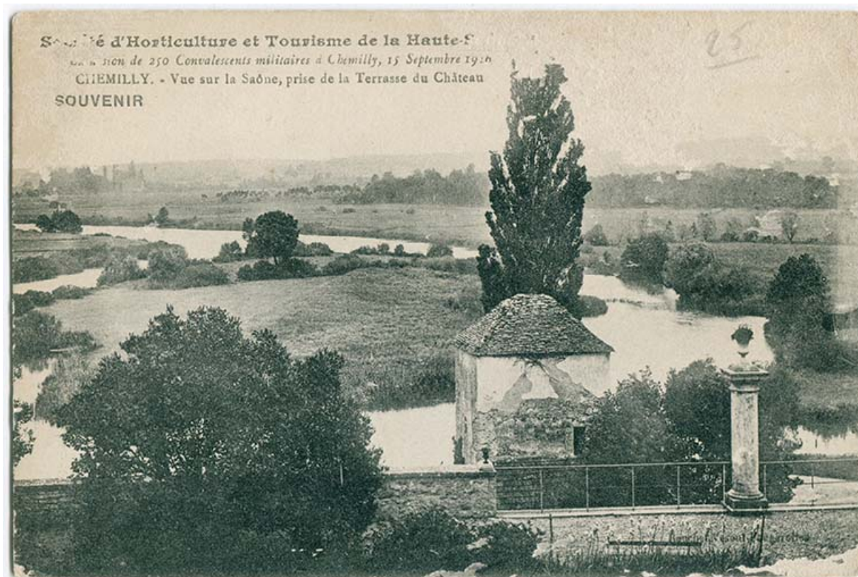
Vue de la Saône, prise depuis la terrasse du château. Souvenir de 250 militaires convalescents à Chemilly le 15 septembre 1916. 70, Chemilly