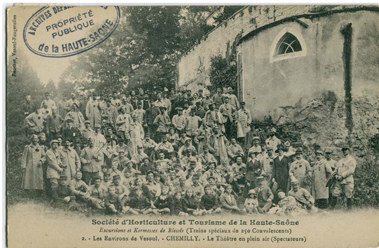
Le théâtre en plein air de Chemilly. Excursion et kermesse de blessés, trains spéciaux de 250 militaires convalescents, le 15 septembre 1916.