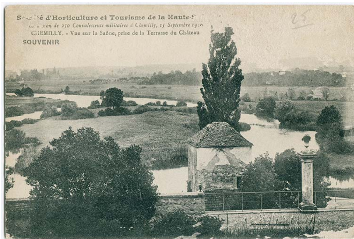
Vue de la Saône, prise depuis la terrasse du château. Souvenir de 250 militaires convalescents à Chemilly le 15 septembre 1916. 70, Chemilly

Chemilly, vue sur la Saône, depuis la terrasse du château, 1916. Carte postale. Souvenir de 250 militaires convalescents à Chemilly le 15 septembre 1916.