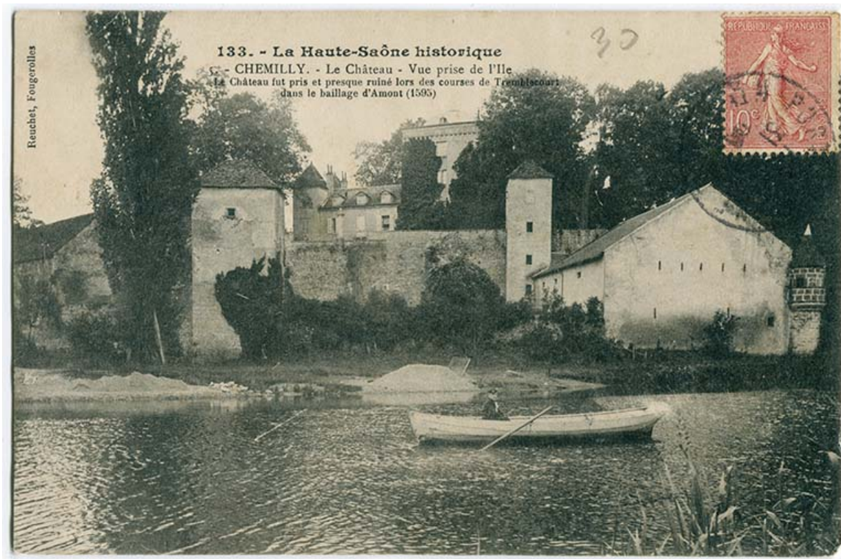
Vue d'ensemble du château, prise depuis l'île 70, Chemilly