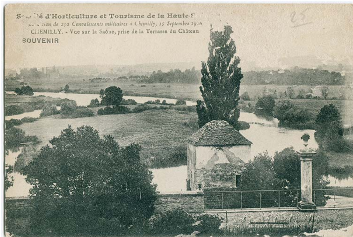
Vue de la Saône, prise depuis la terrasse du château. Souvenir de 250 militaires convalescents à Chemilly le 15 septembre 1916. 70, Chemilly