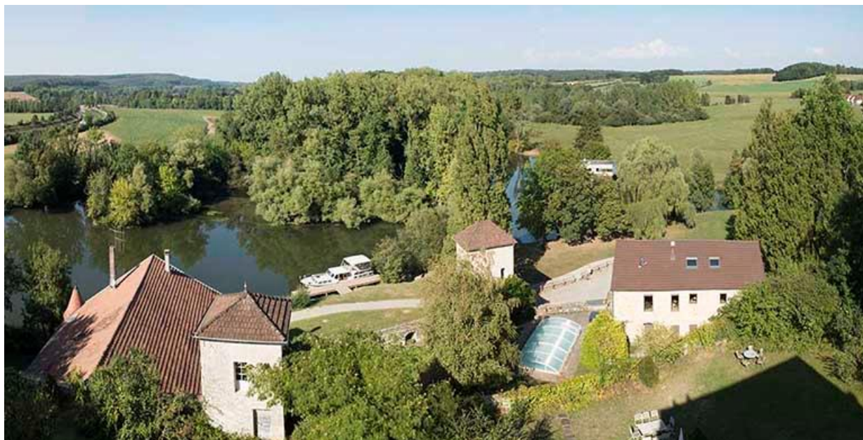
Les bâtiments des communs dans la basse cour, depuis le toit-terrasse du donjon du château, la Saône et le Durgeon. 70, Chemilly, lieudit : La Côte