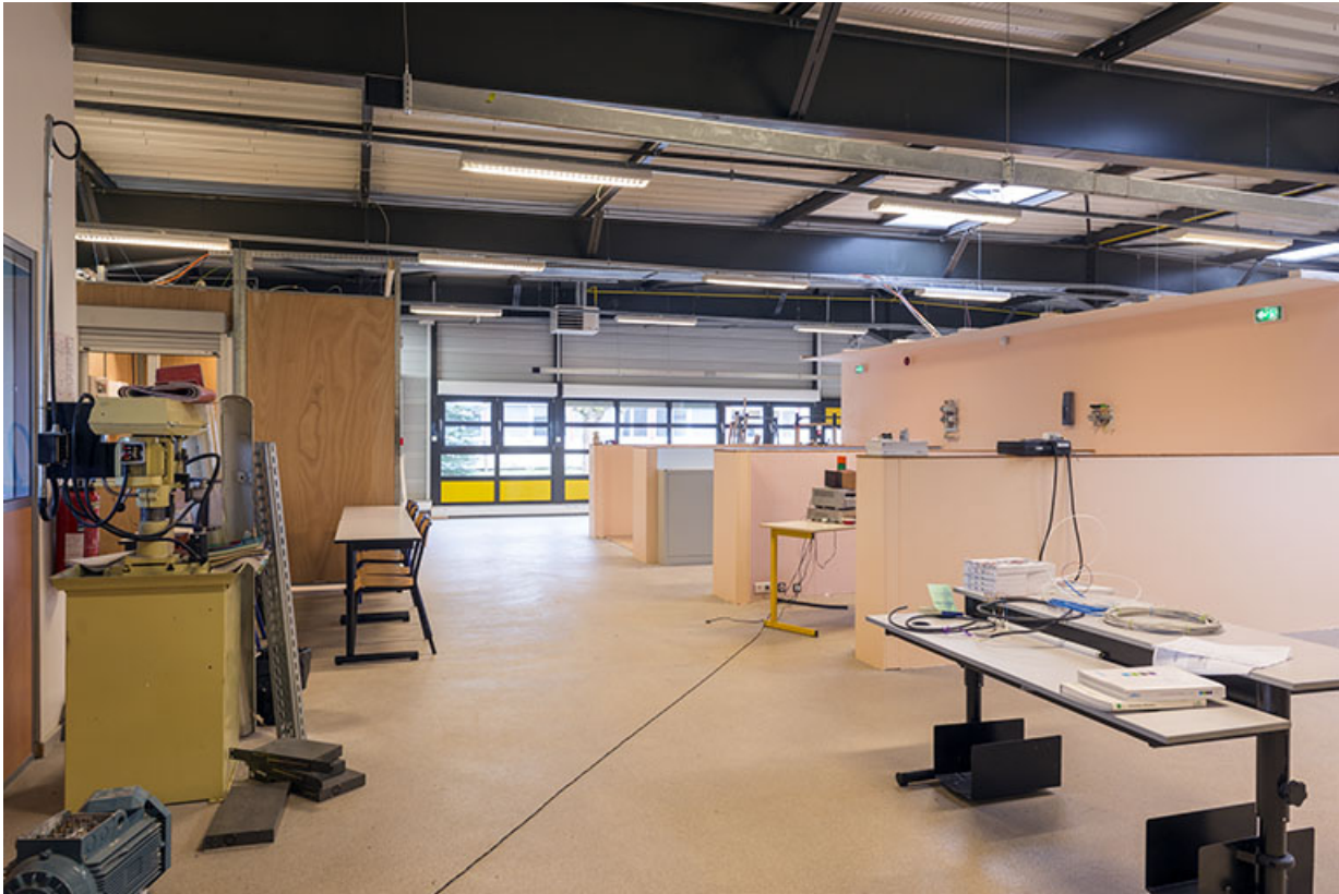
Vue intérieure d'un atelier.