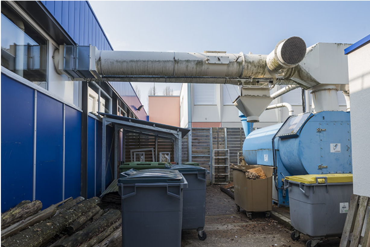
Traitement des déchets bois au nord de l'atelier bois.