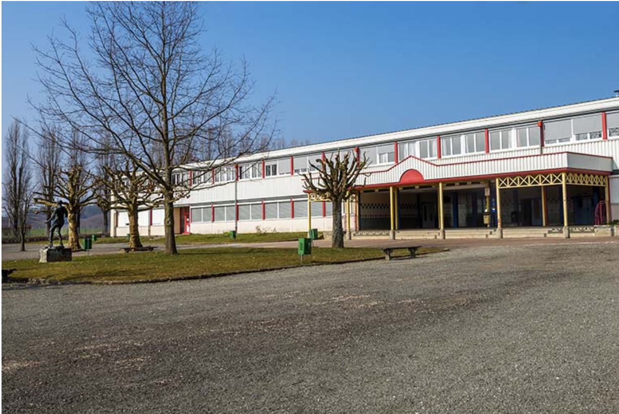
La sculpture de Jeanclos dans la cour devant la façade sud de l'externat nord. 90, Delle, 18 rue de Verdun