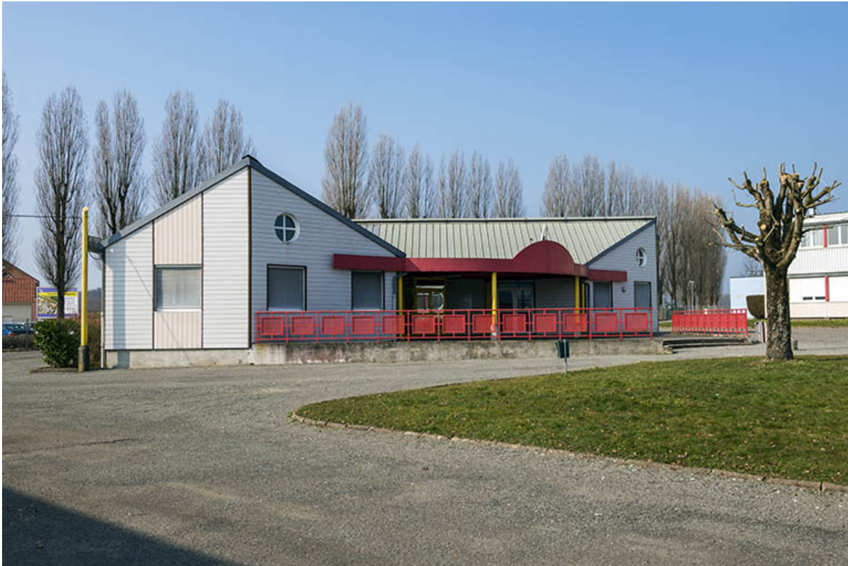
Façade ouest d'entrée du bâtiment de la vie scolaire.