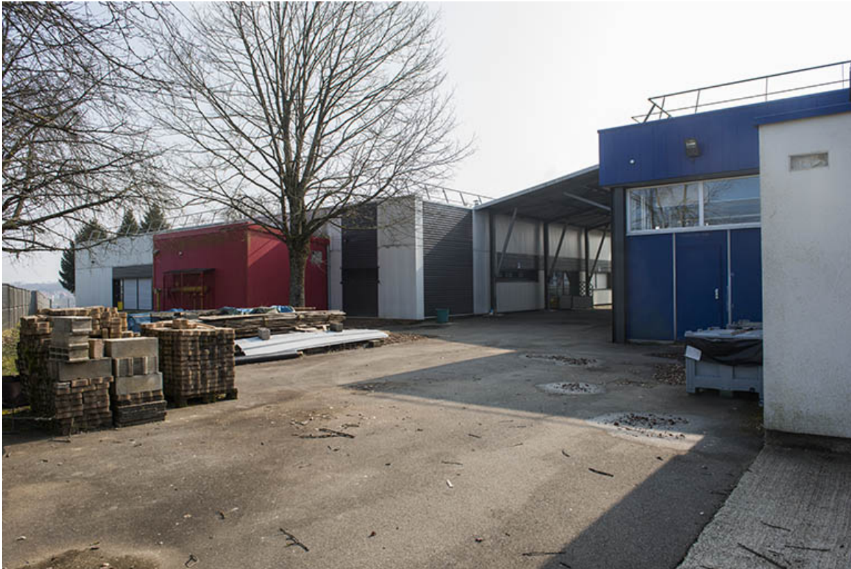
Passage couvert entre les ateliers est et ouest, vu du nord.