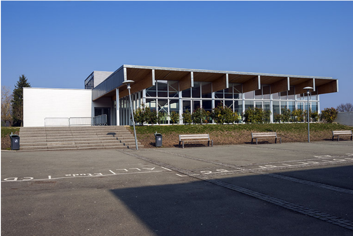
Façade sud de la cantine.