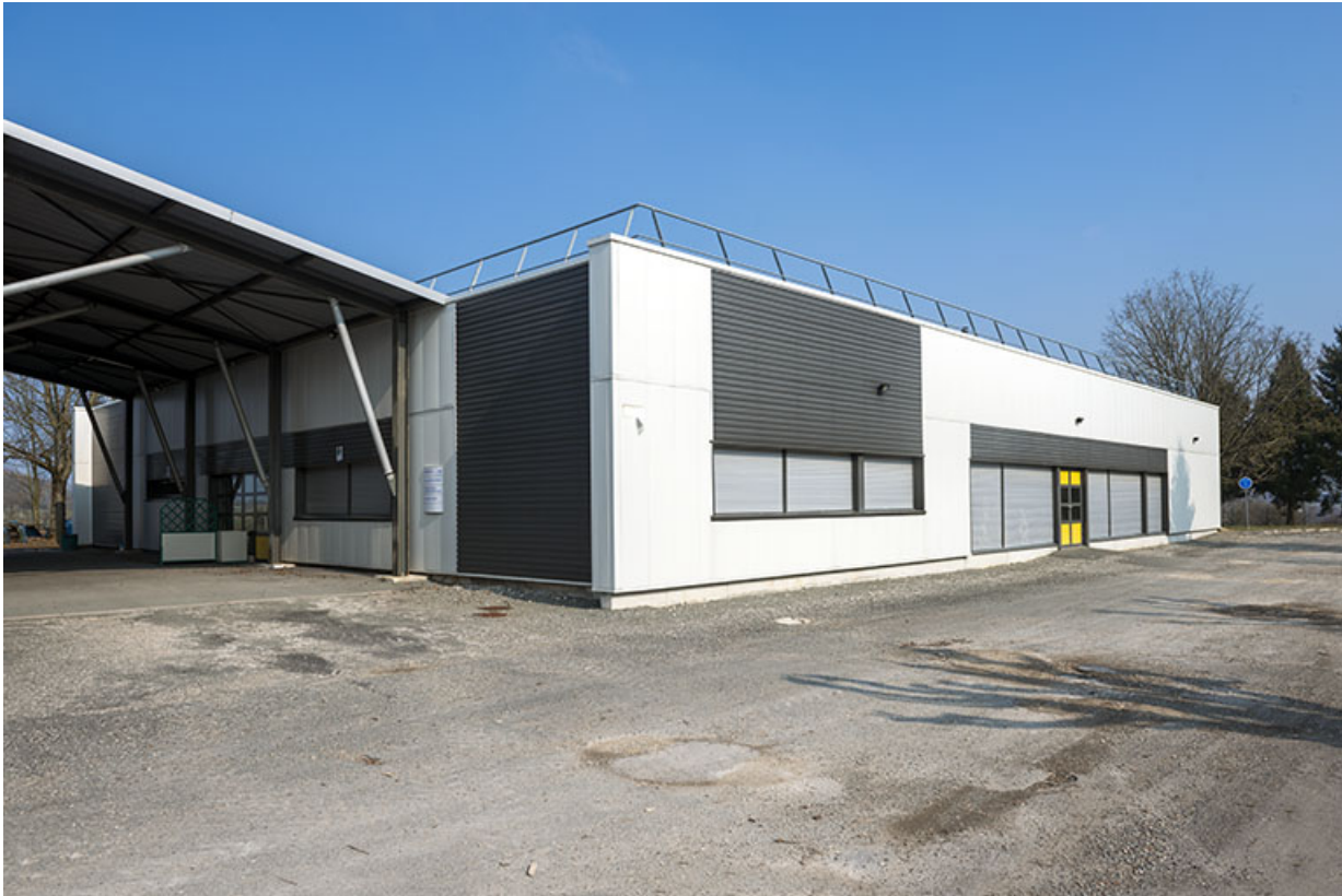
Angle sud-ouest de l'atelier est.