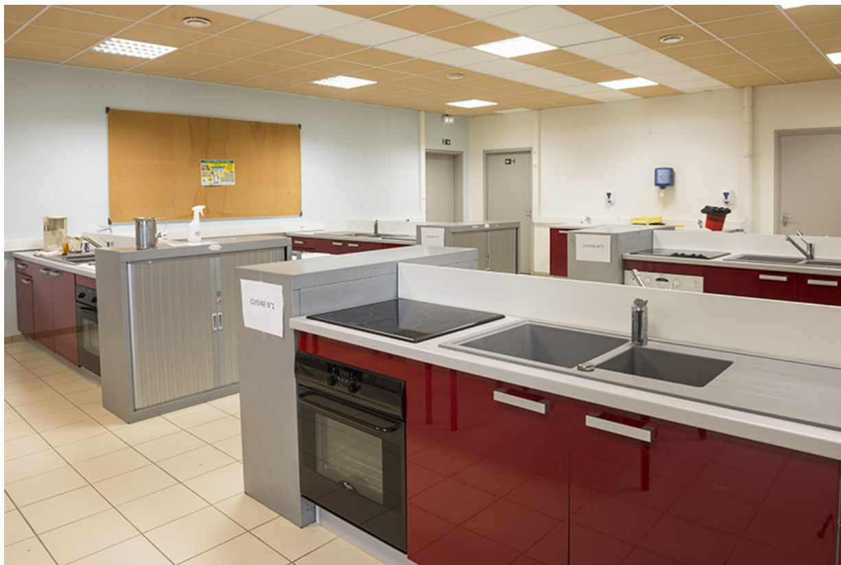
Salle de cours du bac pro accompagnement soins et services à la personne. 90, Delle, 18 rue de Verdun