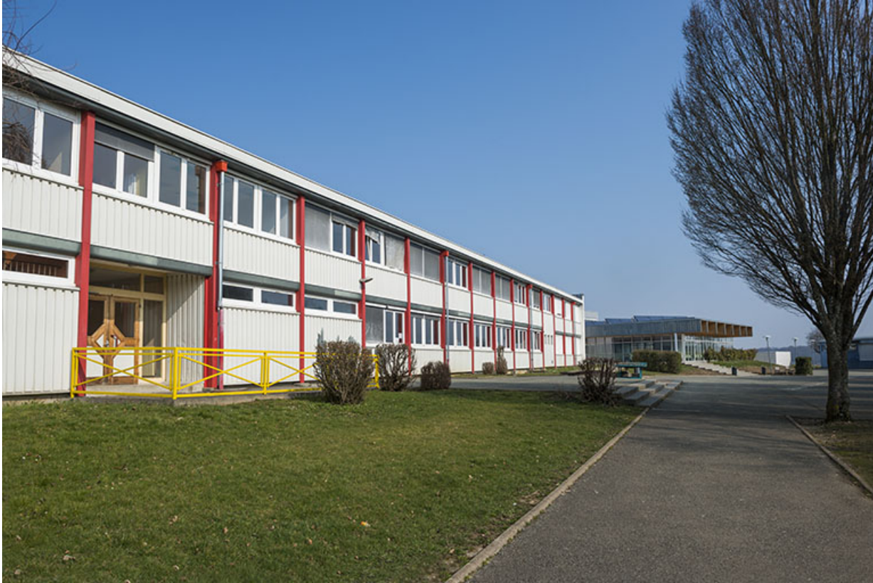
Façade sud de l'externat sud.