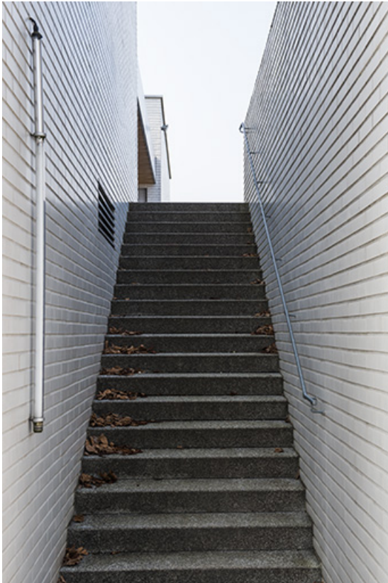
Détail d'escalier le long de la façade orientale de la restauration. 90, Delle, 18 rue de Verdun