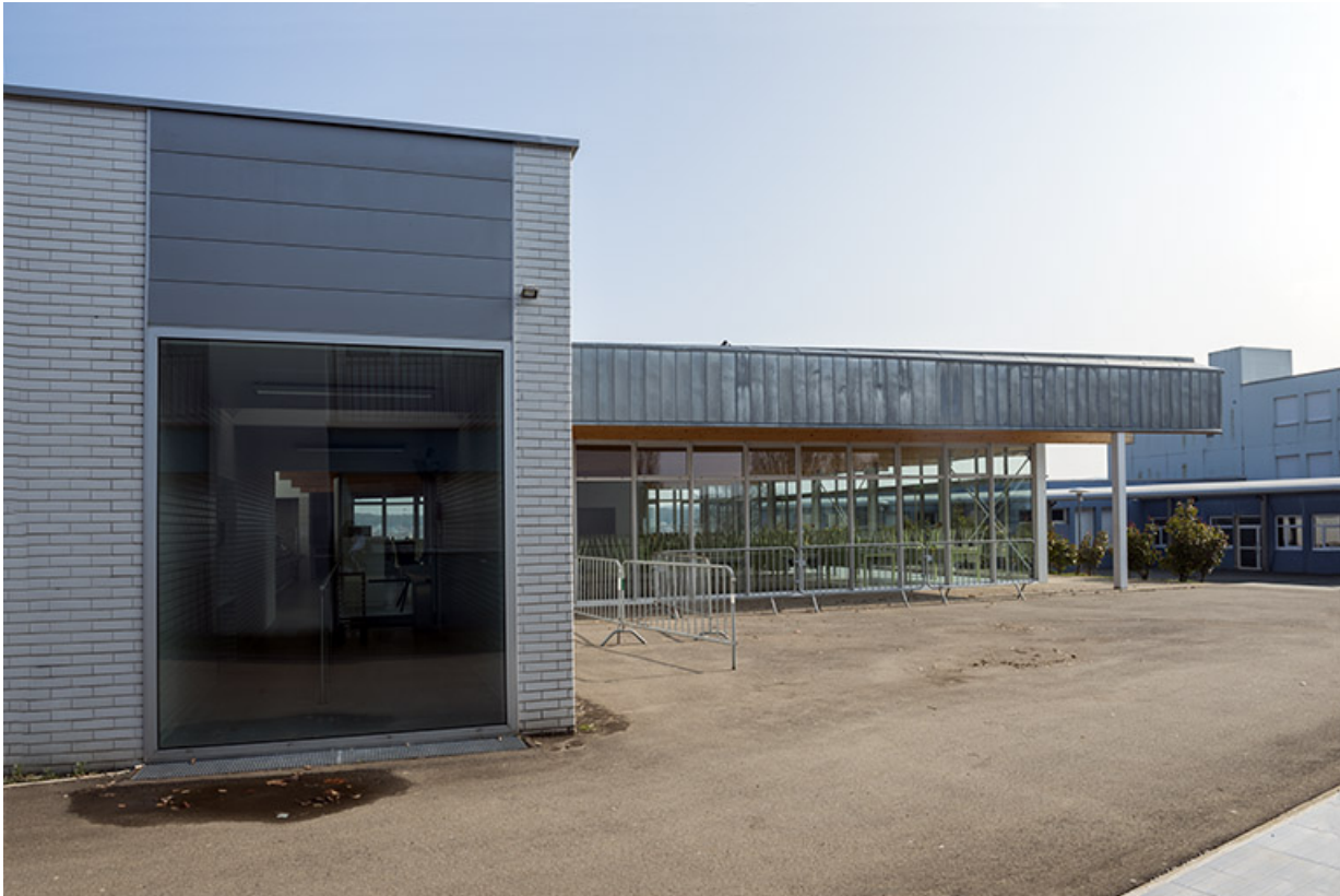
Détail de la façade ouest d'entrée de la cantine.