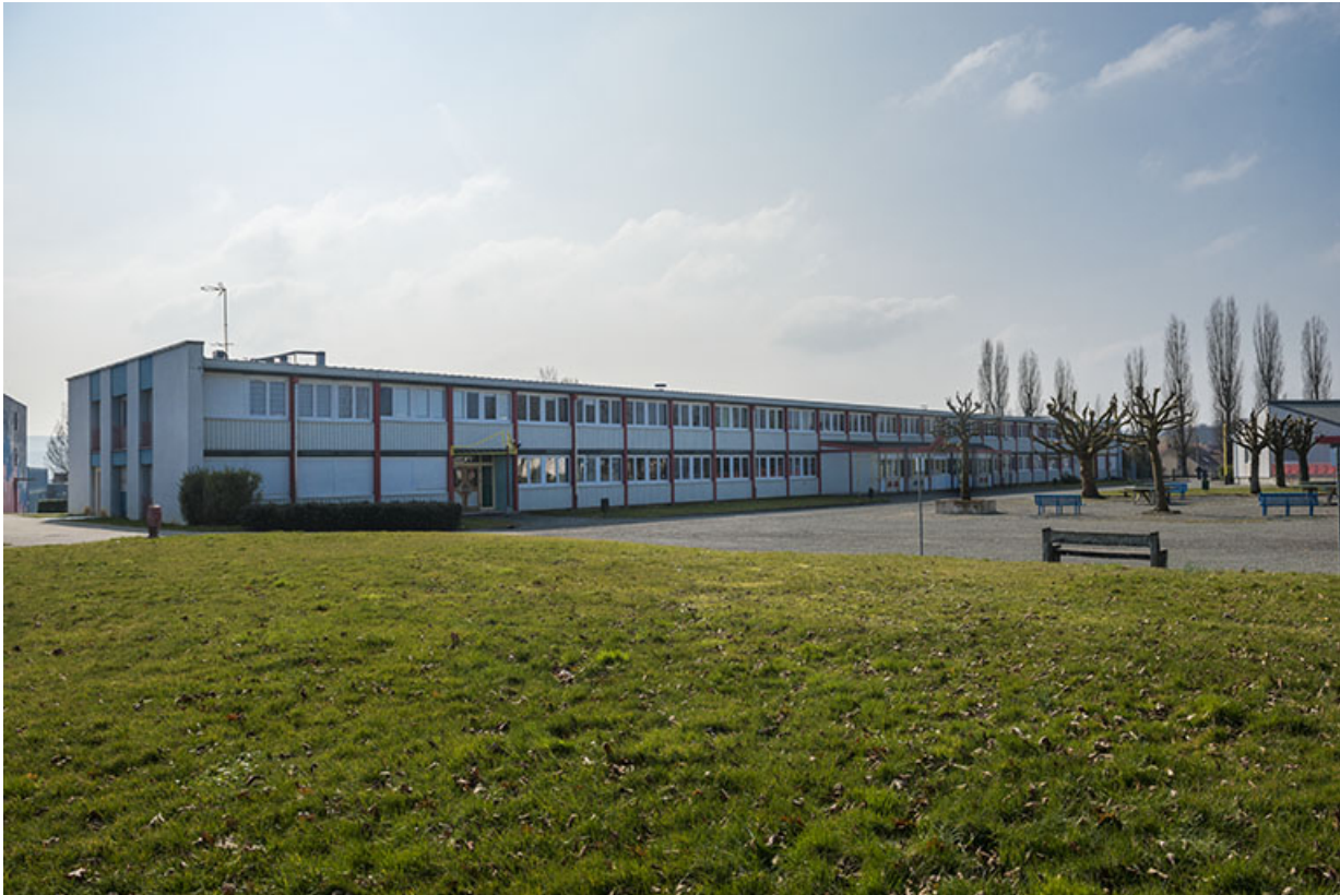
Façade antérieure nord sur cour de l'externat sud.