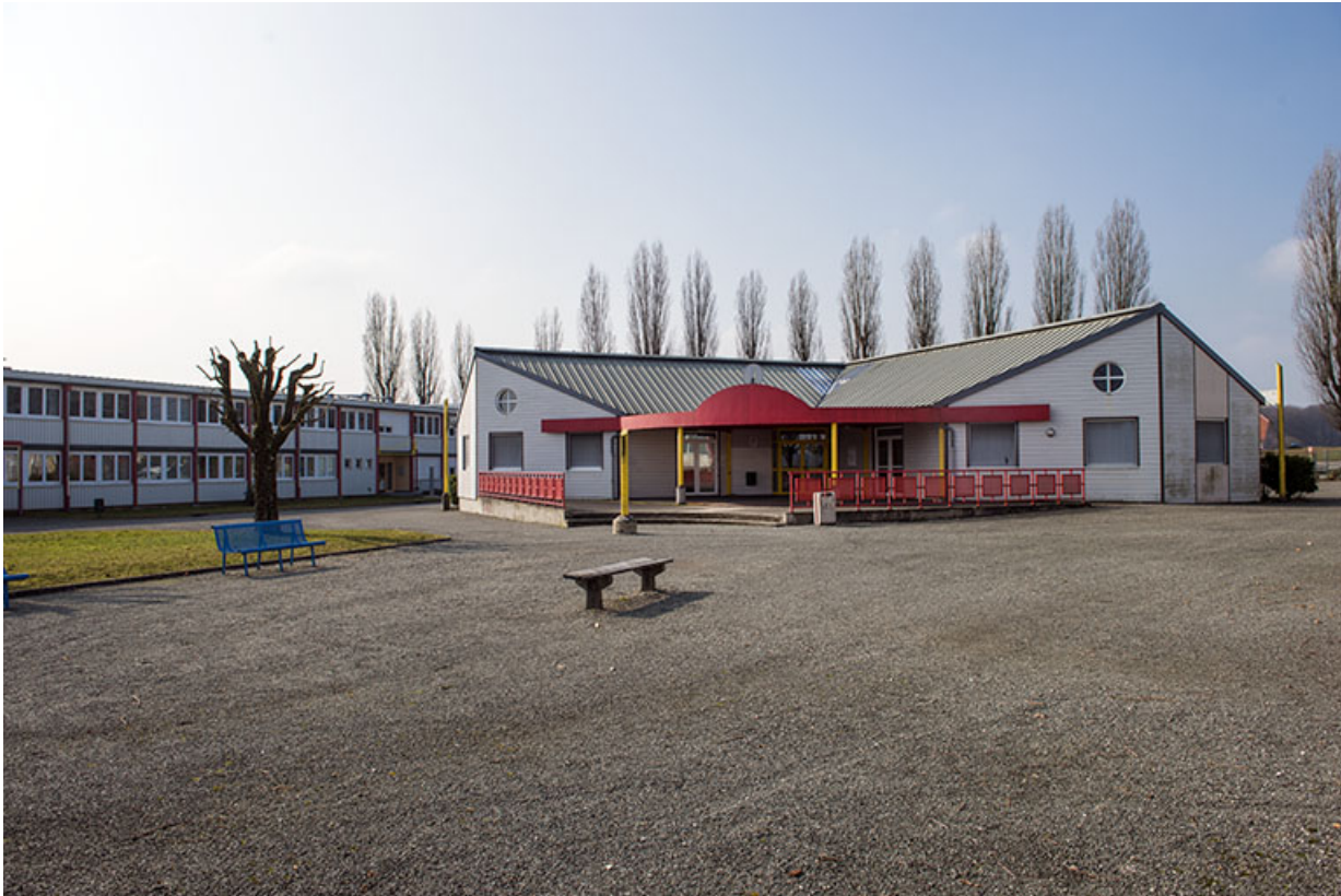
Façade ouest d'entrée du bâtiment de la vie scolaire.