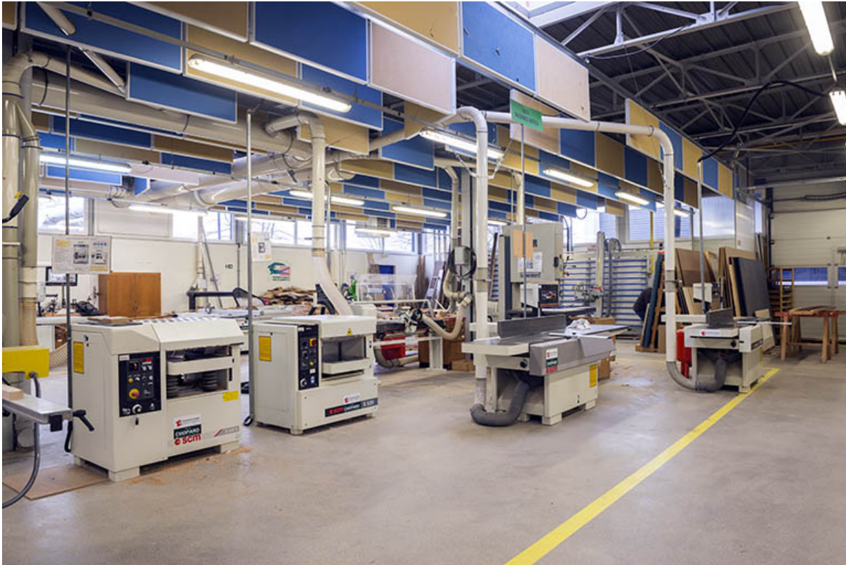
Vue intérieure d'un atelier.