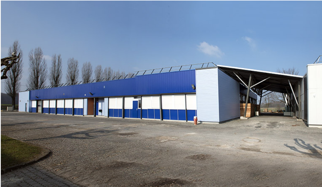
Façade sud et angle sud-est de l'atelier ouest consacré au bois.