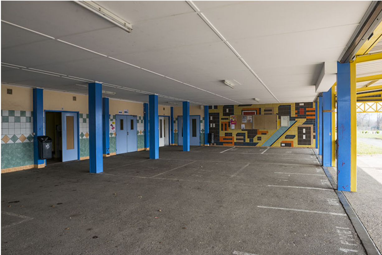
Préau sur la façade sud de l'externat nord.