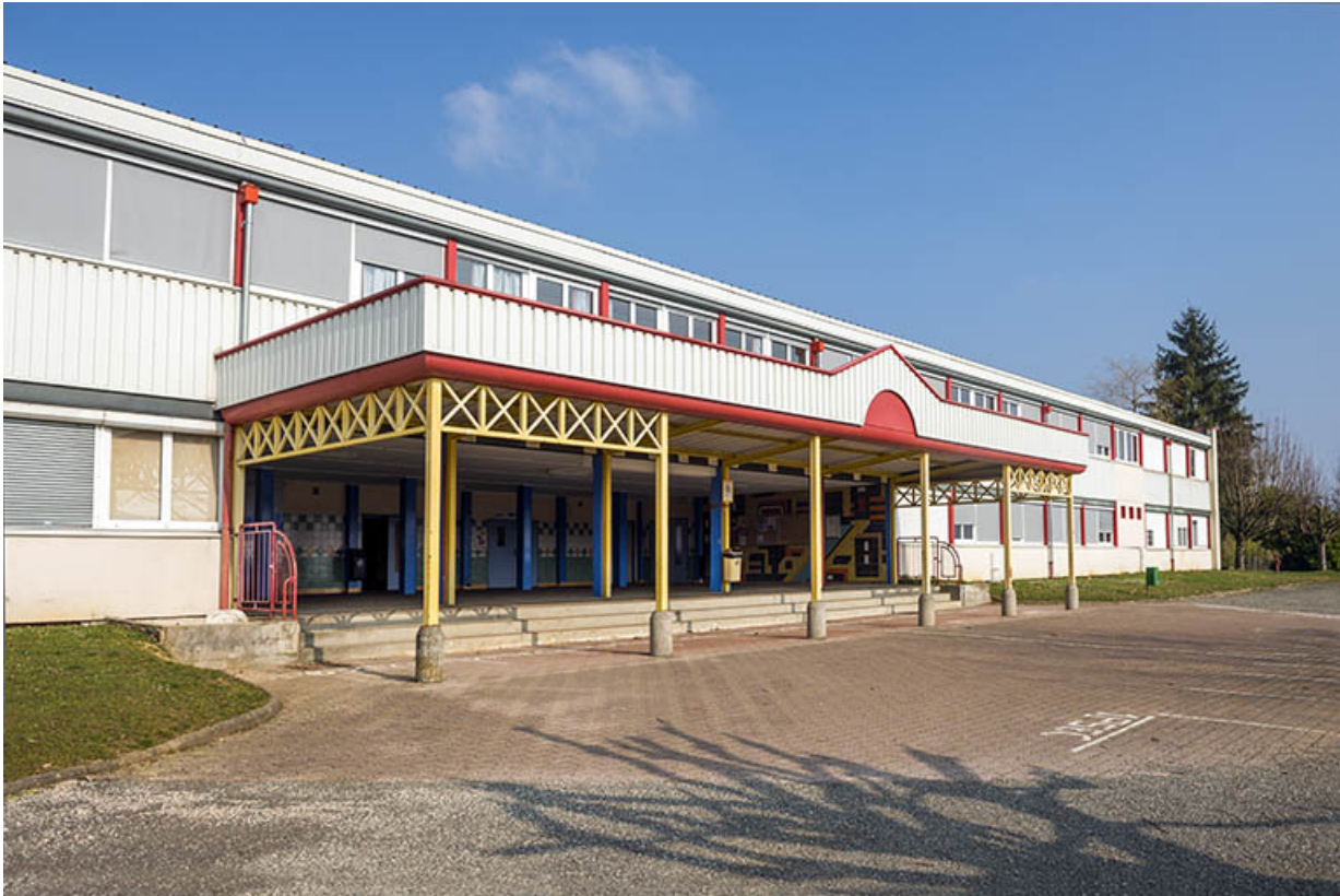
L'auvent et le préau de l'externat nord sur cour.