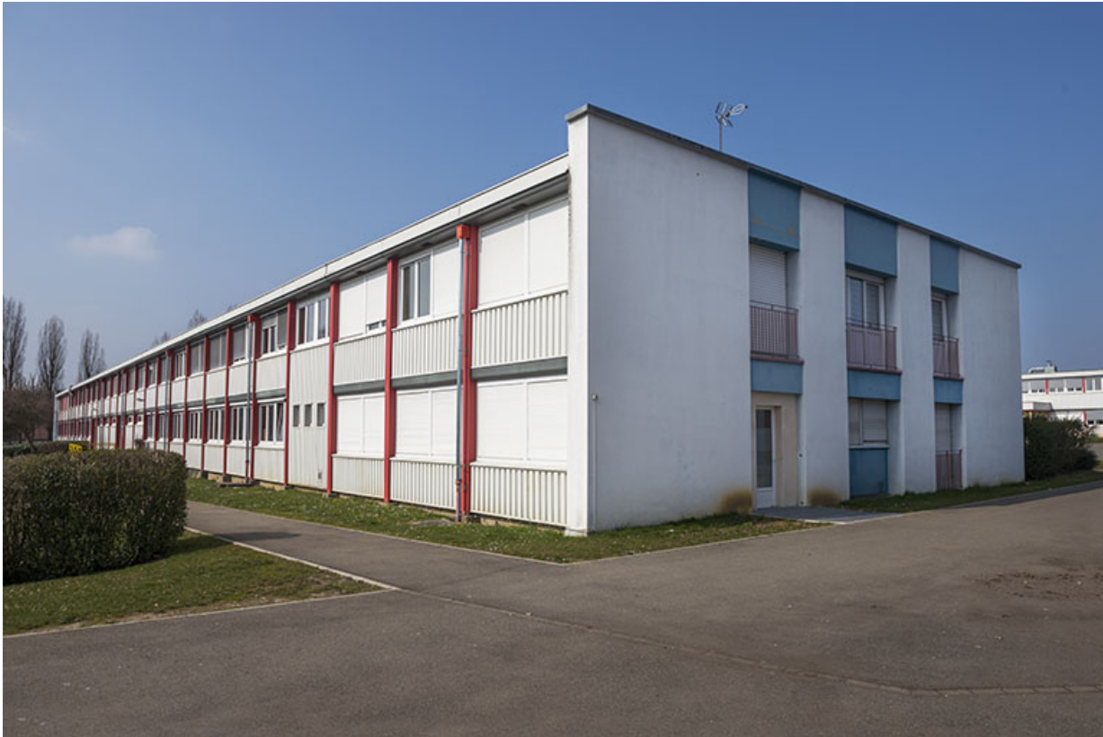
Pignon est de l'externat sud et sa façade sud.