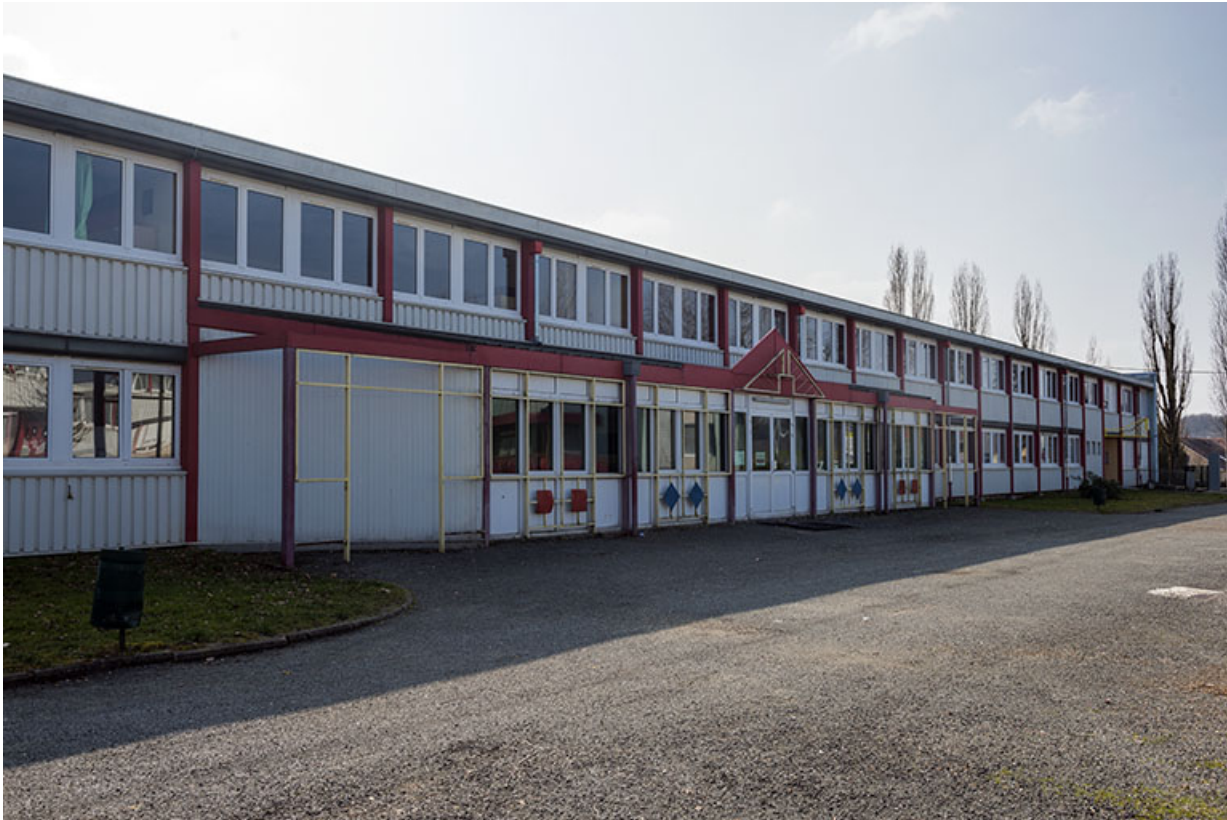
Détail de la façade antérieure nord sur cour de l'externat sud.