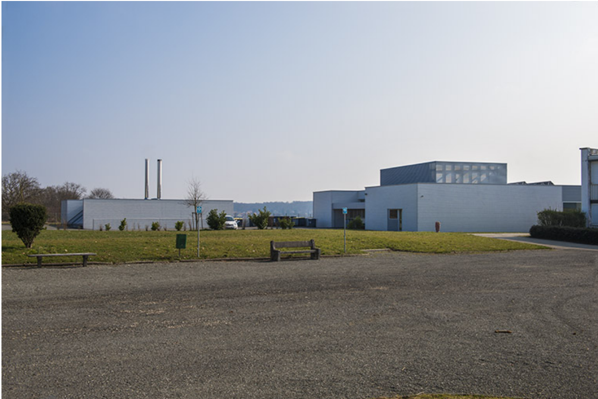
Vue d'ensemble des constructions de Catherine Dormoy : chaufferie et restauration.