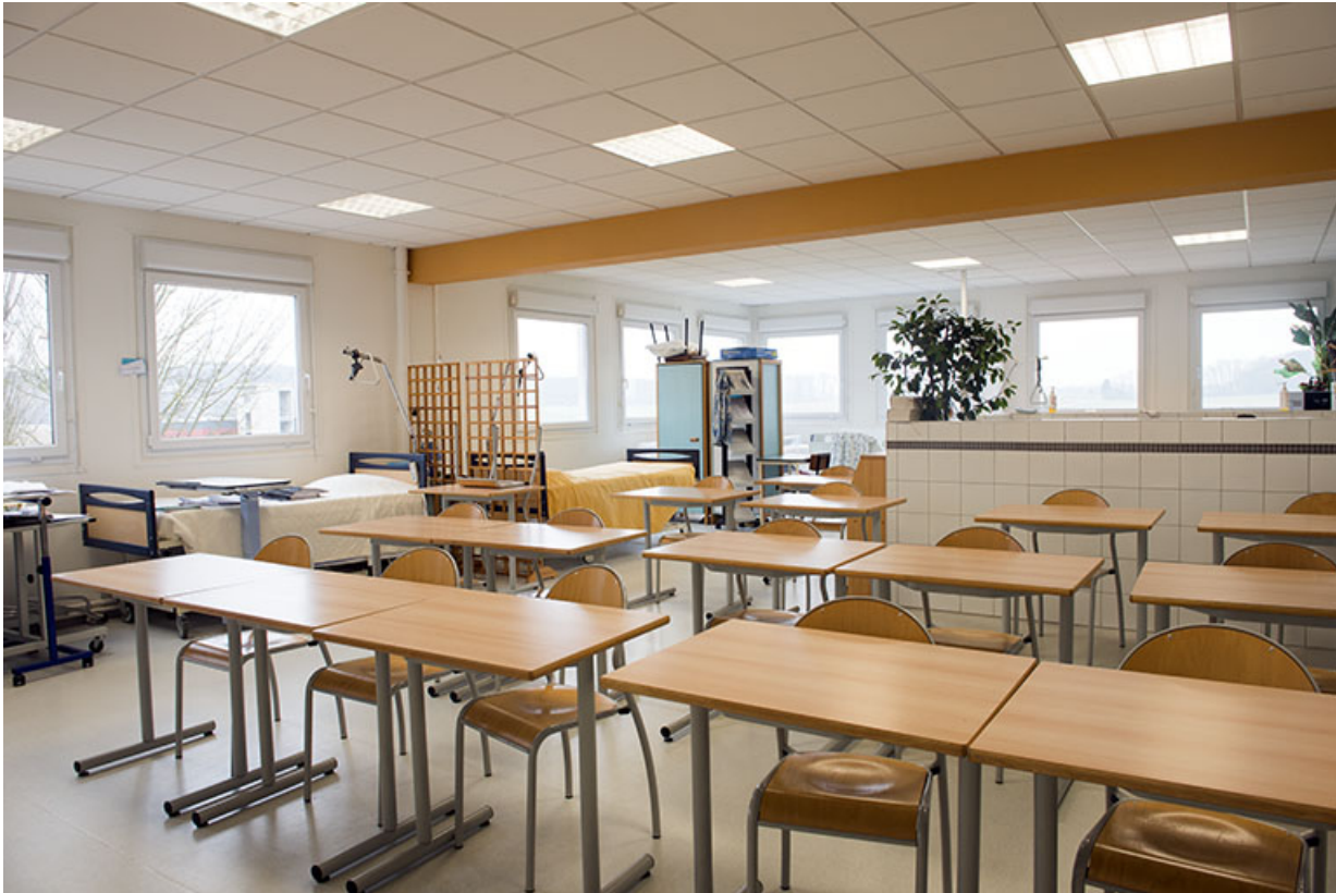
Salle de cours du bac pro accompagnement soins et services à la personne. 90, Delle, 18 rue de Verdun