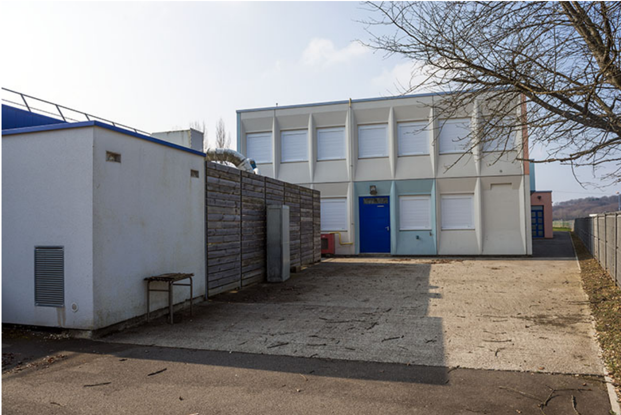
Façade nord-est de l'atelier ouest de peinture et productique.