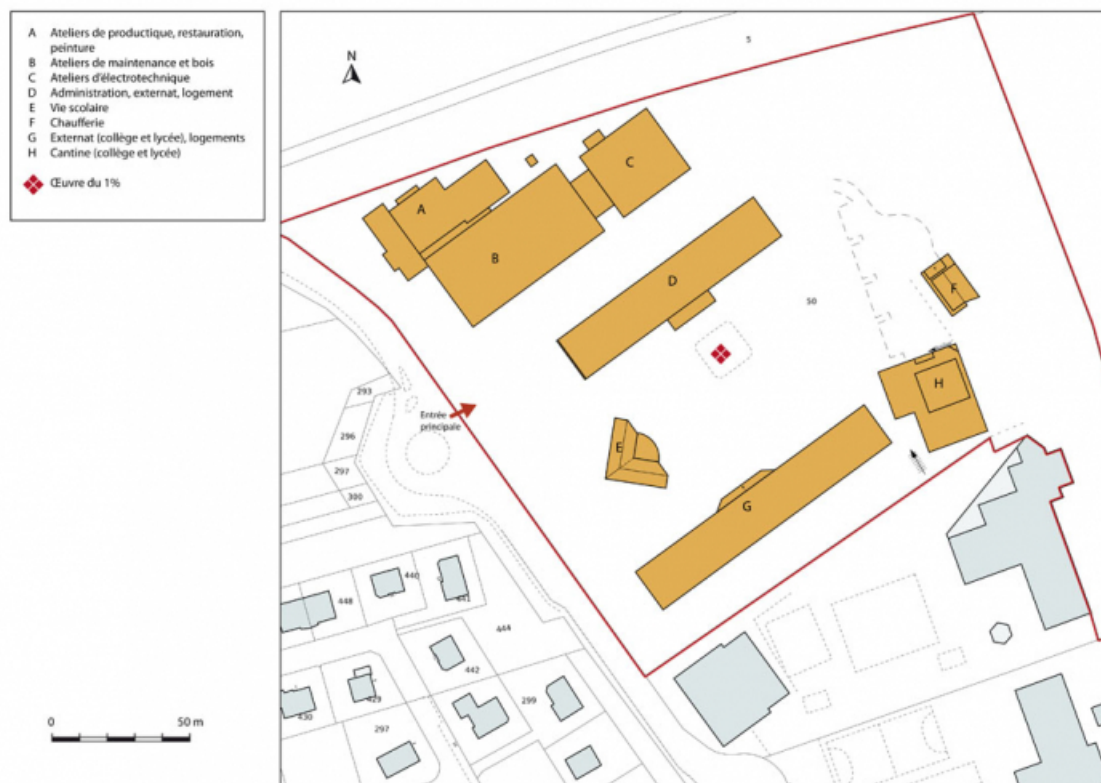
Plan-masse et de situation. Extrait du plan cadastral numérisé, section BC, échelle 1:1000. 90, Delle, 18 rue de Verdun