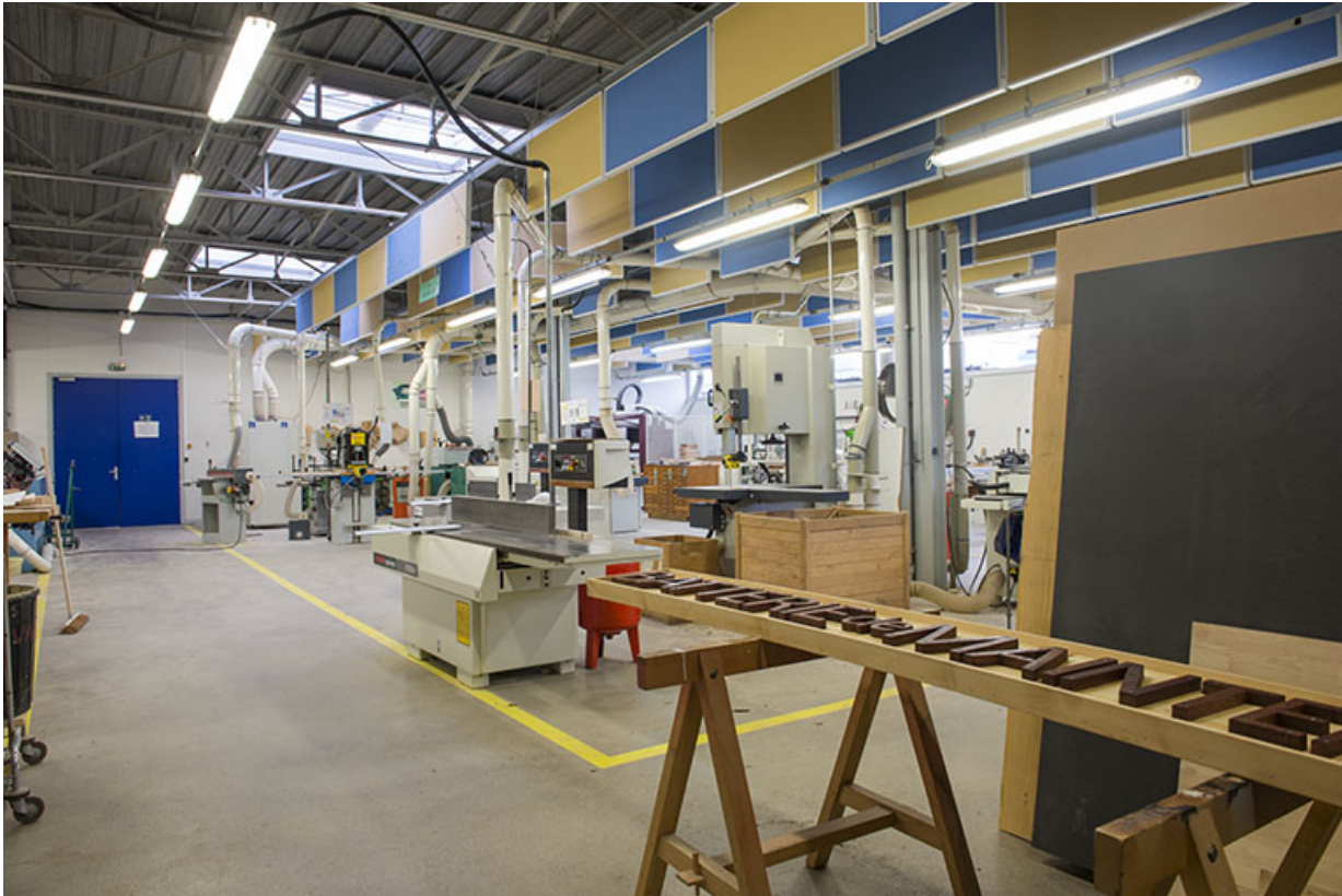
Vue intérieure d'un atelier.