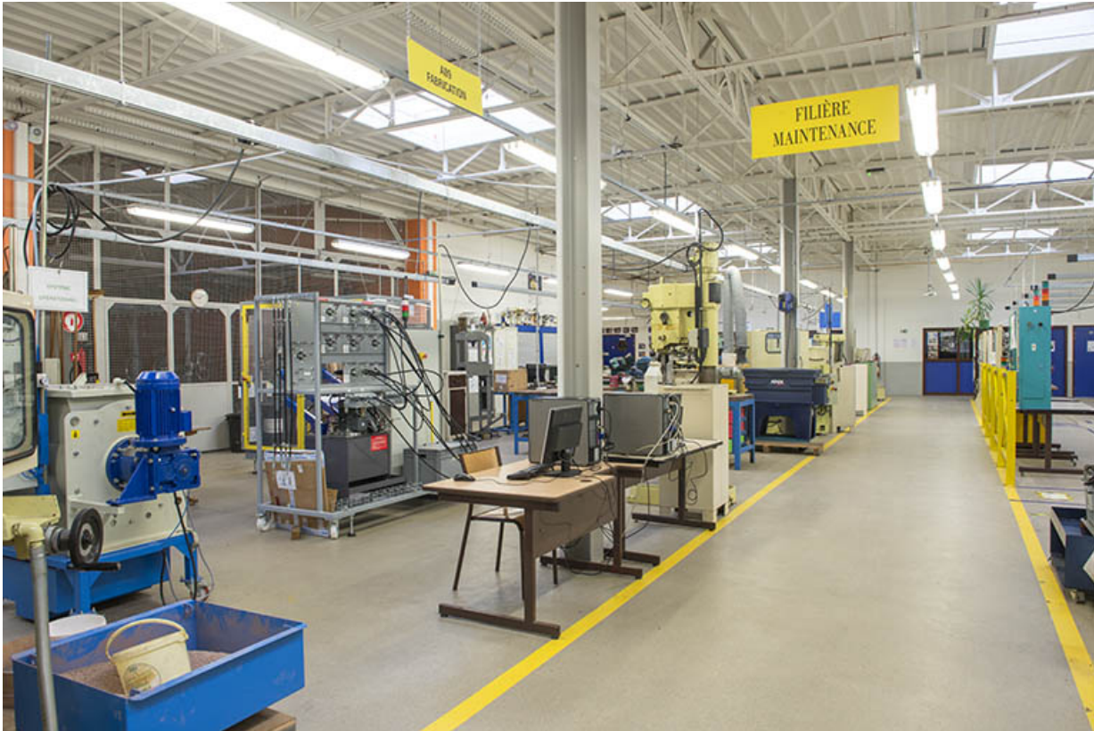
Vue intérieure d'un atelier : maintenance.