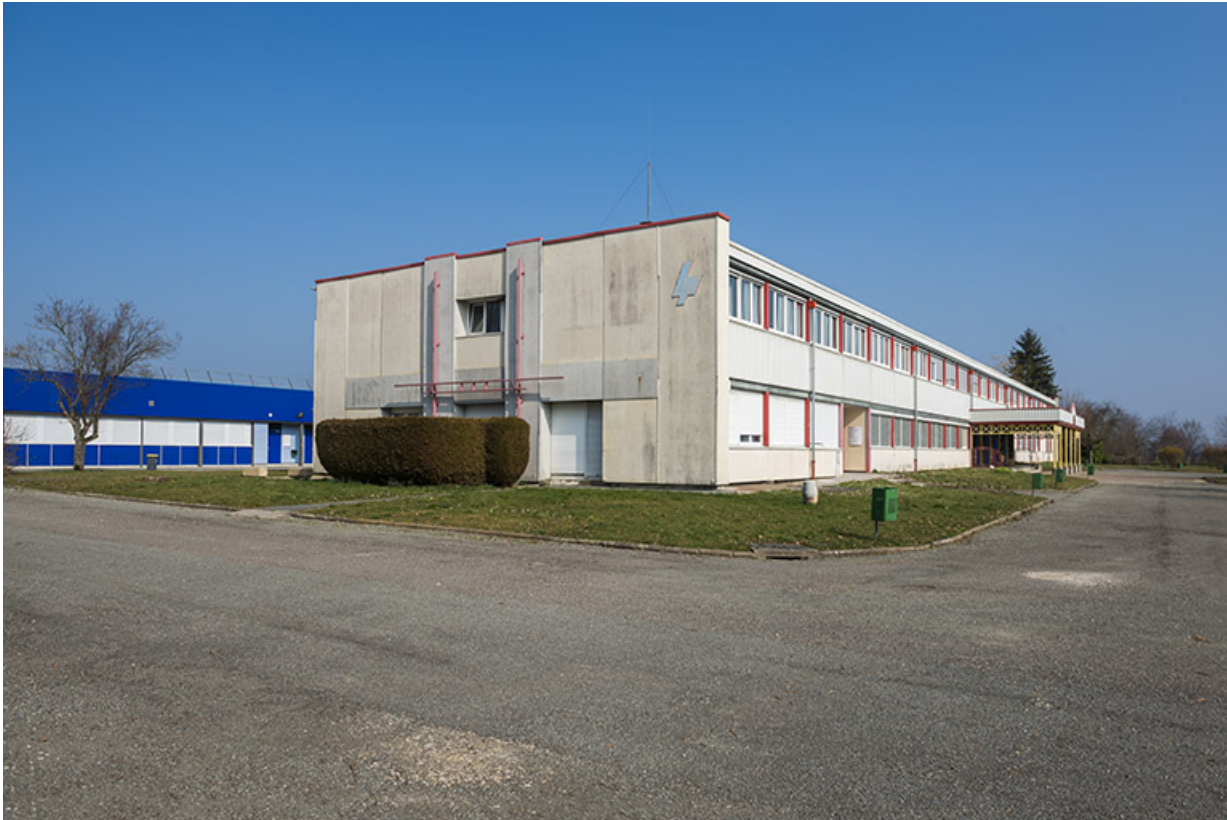
Pignon ouest et façade sud de l'externat nord.