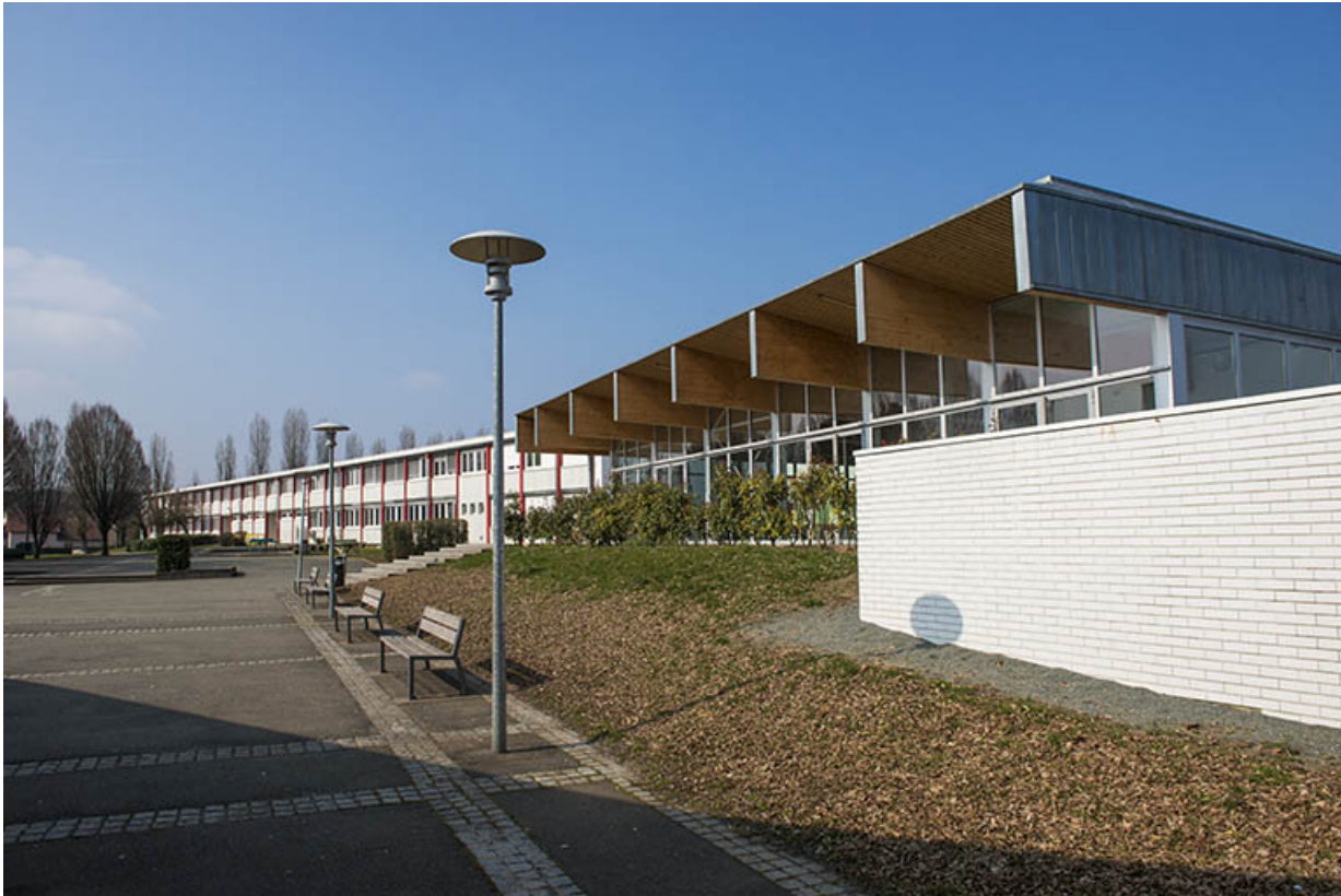
Façade sud de la cantine et de l'externat sud.