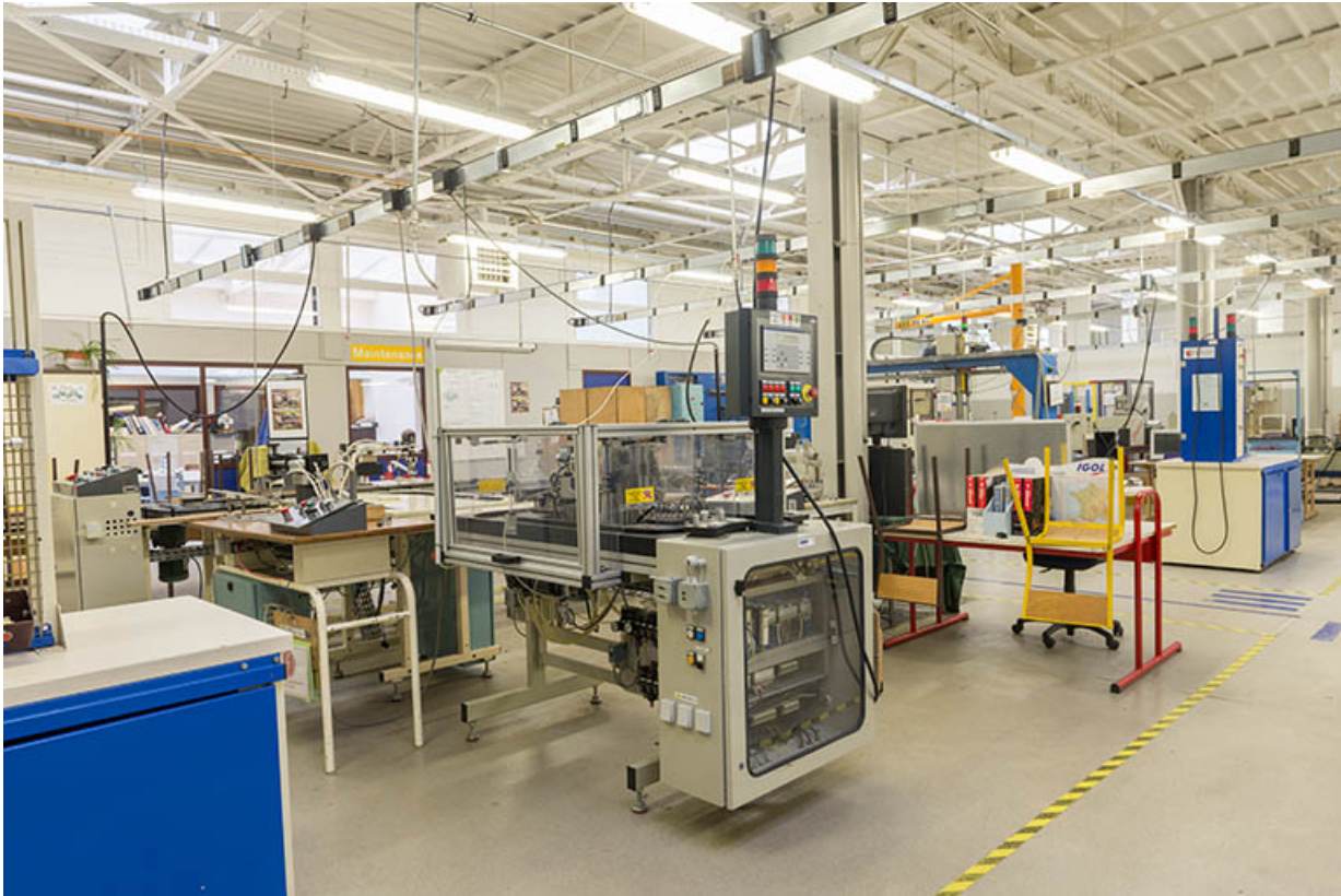
Vue intérieure d'un atelier.