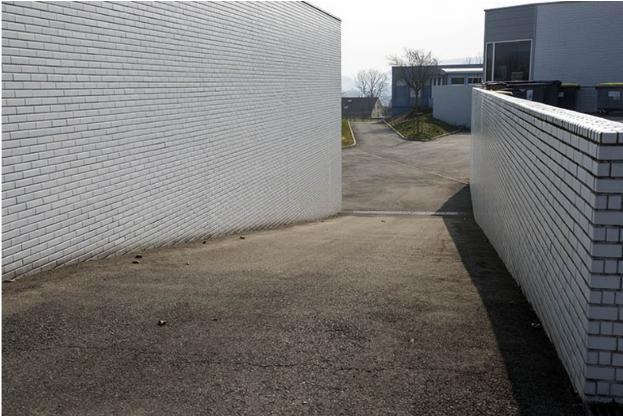
Circulation extérieure à l'ouest de la chaufferie, à l'est de la restauration.