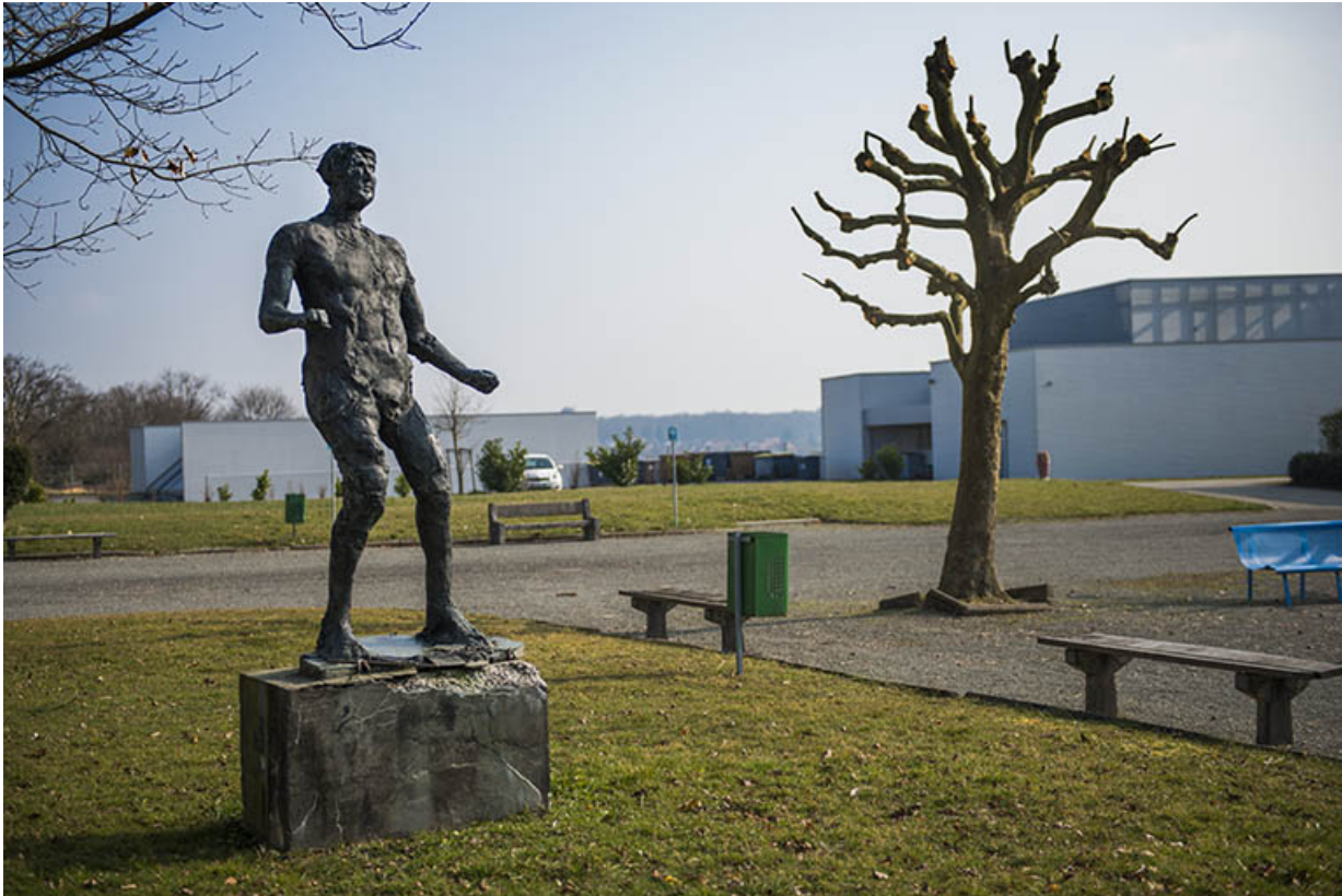
Vue d'ensemble de la face antérieure.