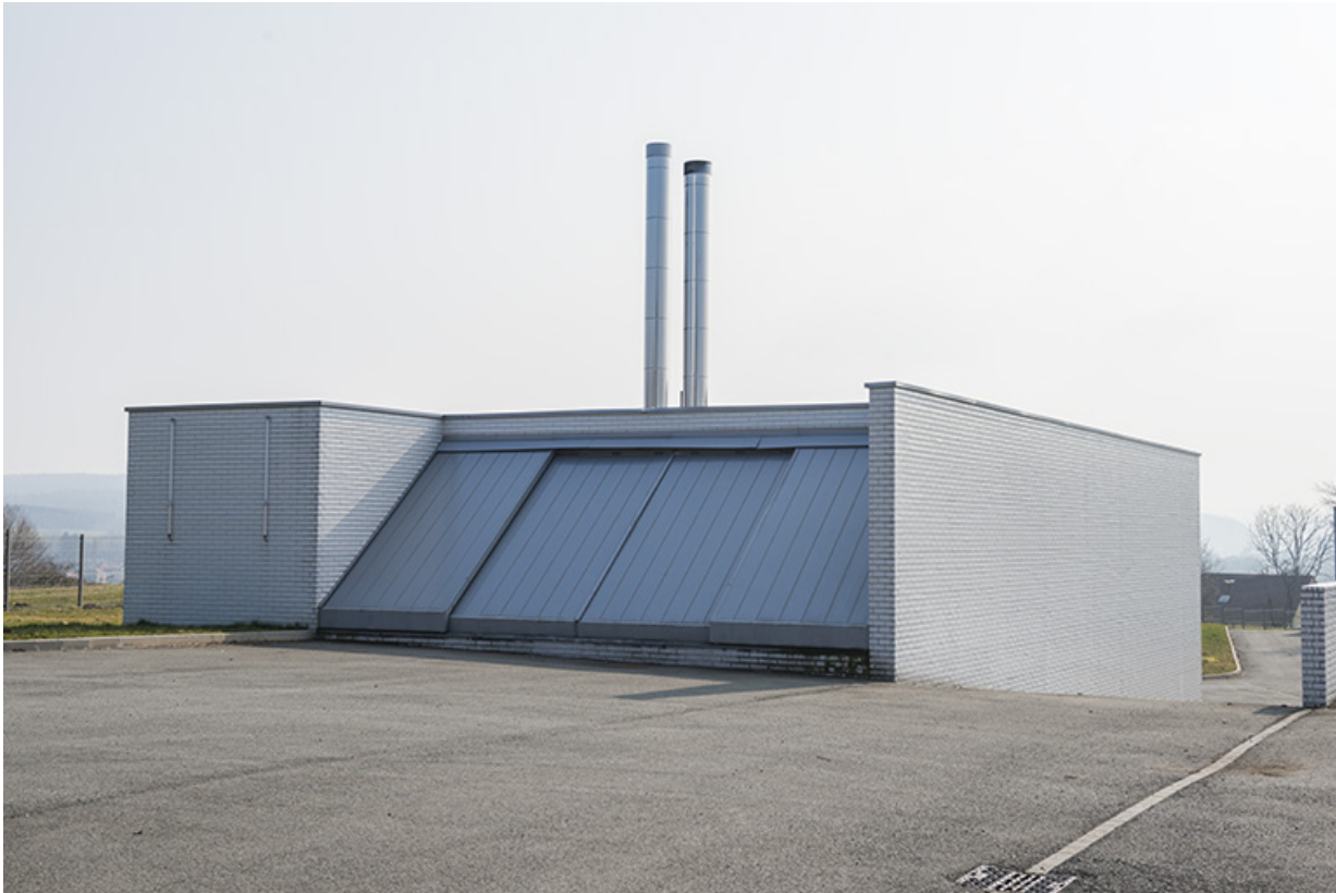
Façade de chargement du combustible et angle nord-ouest de la chaufferie.