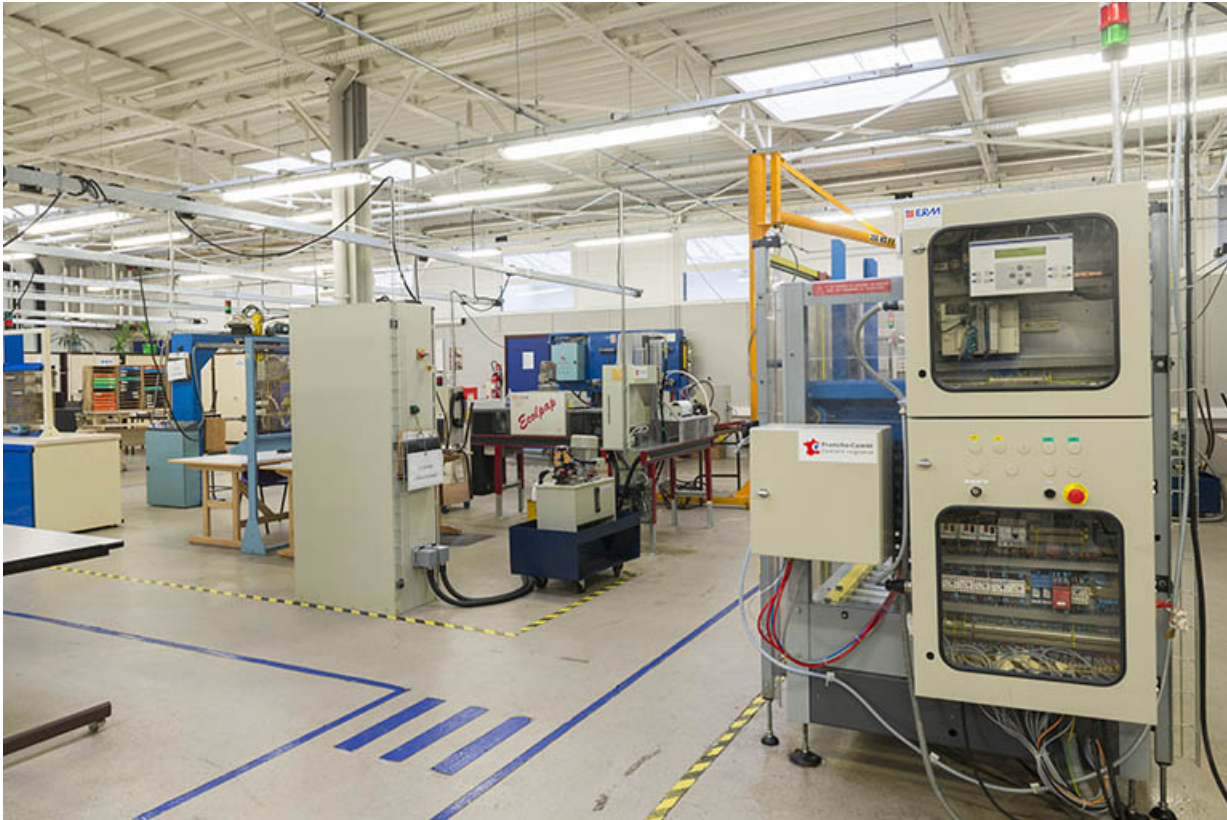
Vue intérieure d'un atelier.