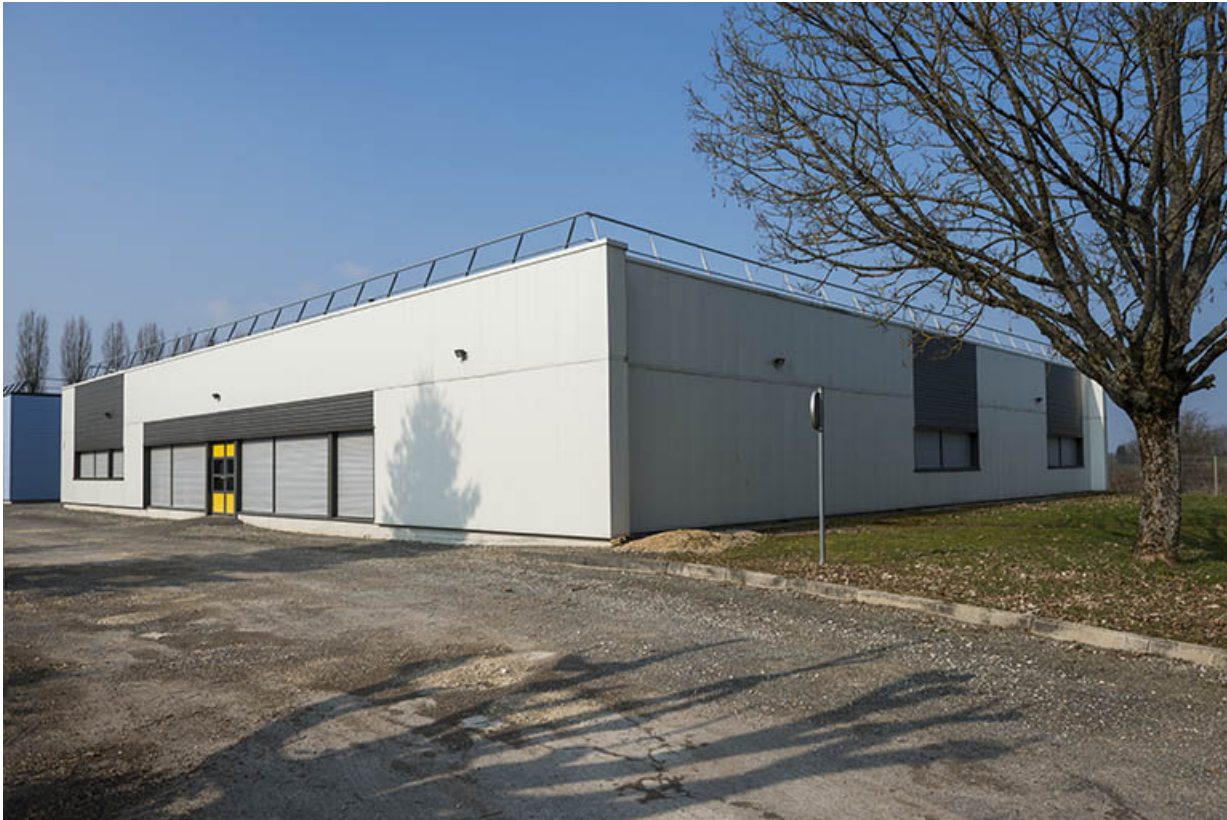
Angle sud-est des ateliers.