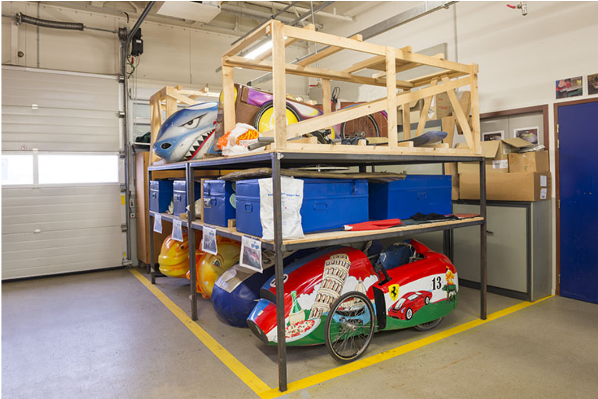
Vue intérieure d'un atelier : travaux d'élèves.