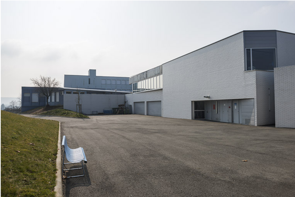
Façade est de la restauration.