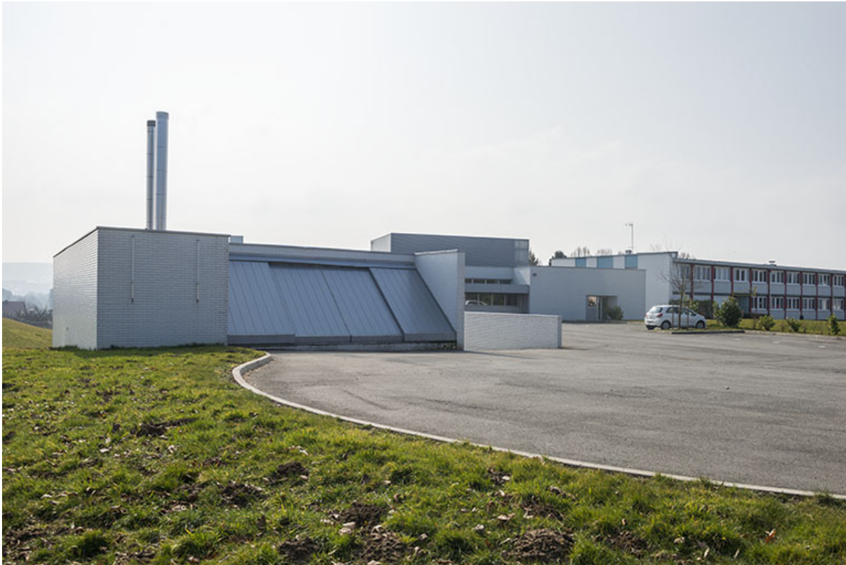
Angle nord-est de la chaufferie, restauration et externat.