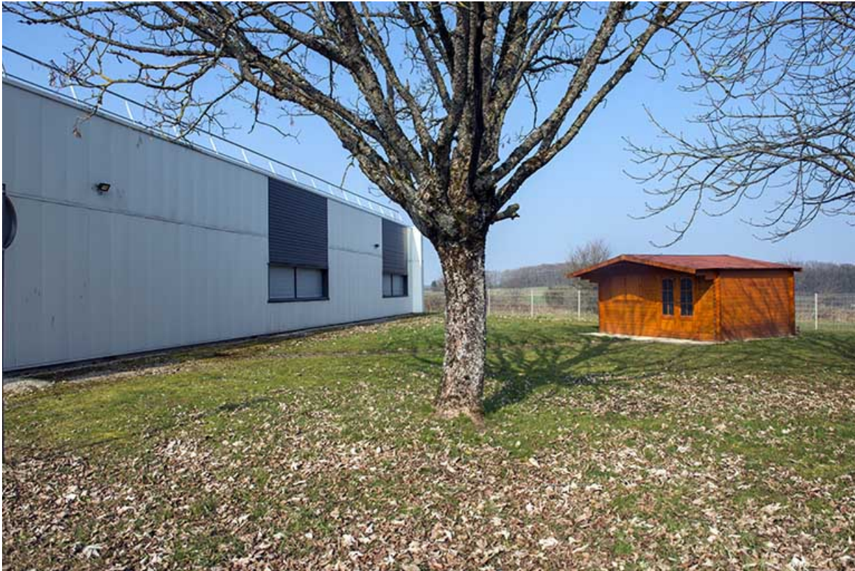
Chalet d'enseignement d'électricité au nord-est de l'atelier est.