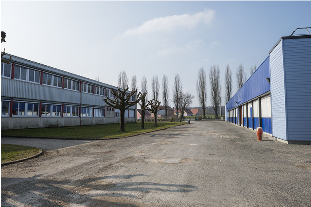
Entre la façade sud de l'atelier ouest et la face postérieure nord de l'externat nord. 90, Delle, 18 rue de Verdun