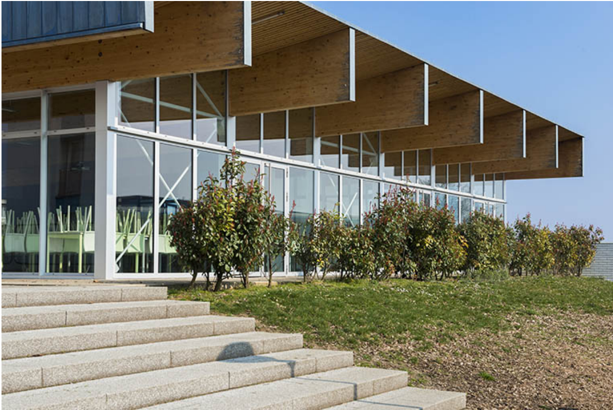
Détail de la façade sud de la cantine.