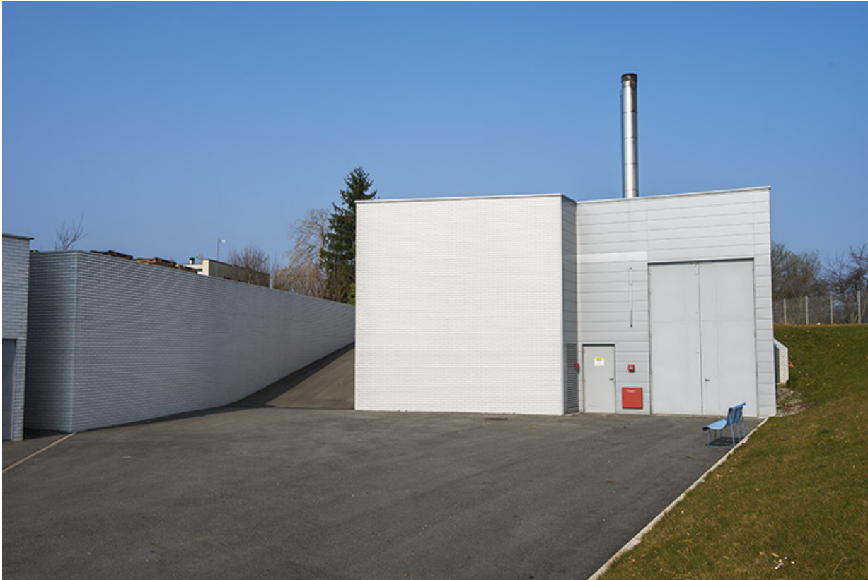
Façade postérieure sud de la chaufferie.