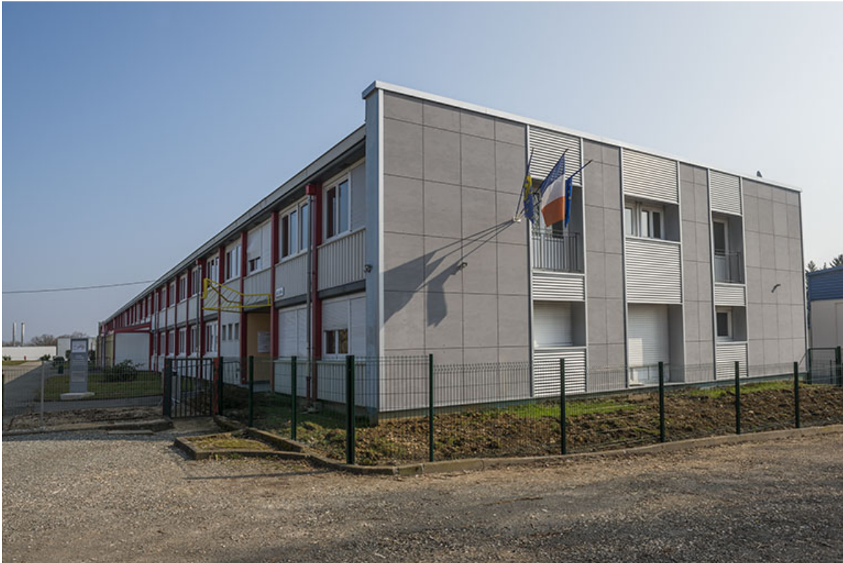
Pignon ouest et façade antérieure nord sur cour de l'externat sud.