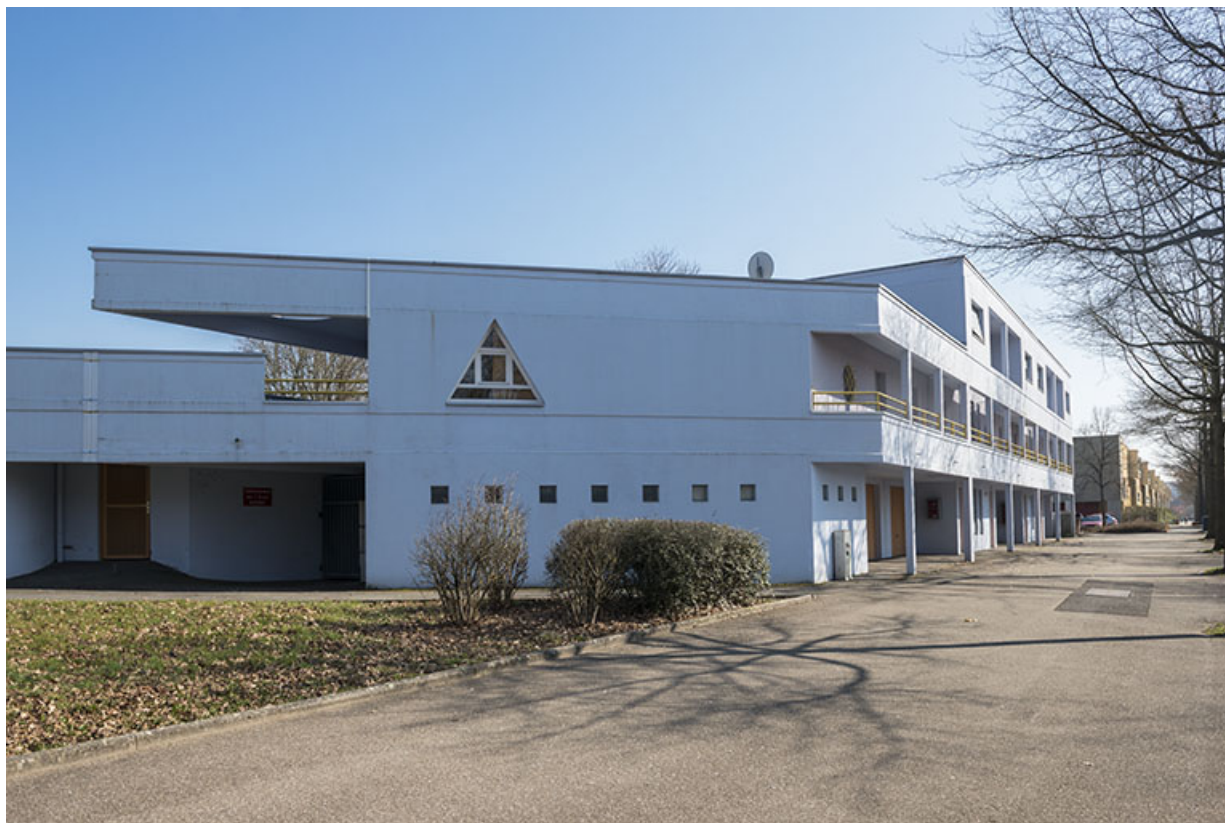
Pignon nord-ouest et façade ouest sur rue des logements sud-ouest.