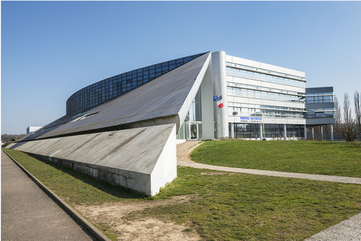
Lycée Gustave Courbet : façade d'entrée et angle nord-ouest du bâtiment socio-éducatif. 90, Belfort avenue du Général Gambiez