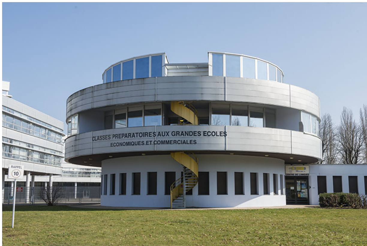
Lycée Gustave Courbet : tour des classes préparatoires.