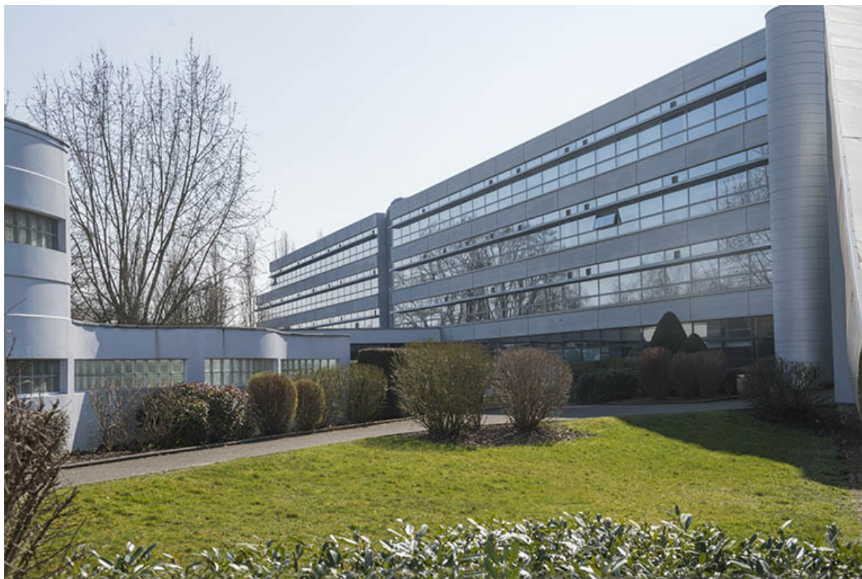
Façade est de l'aile est de l'externat.