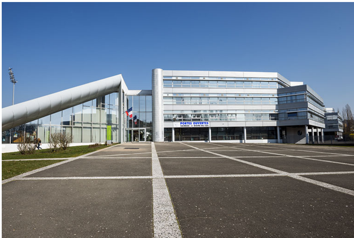
Façade de l'entrée principale sud sur sa place - parvis.