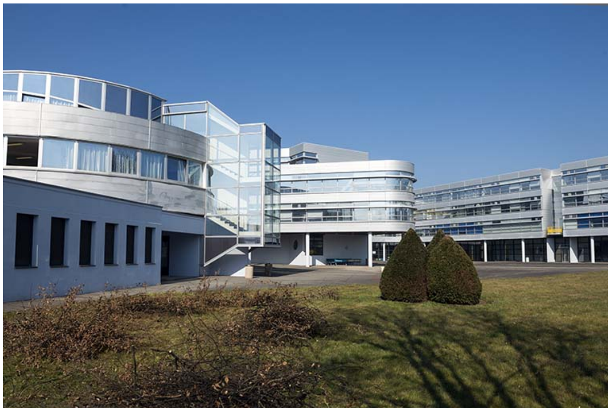
Vue sur la cour, la tour et les externats depuis le sud-ouest.