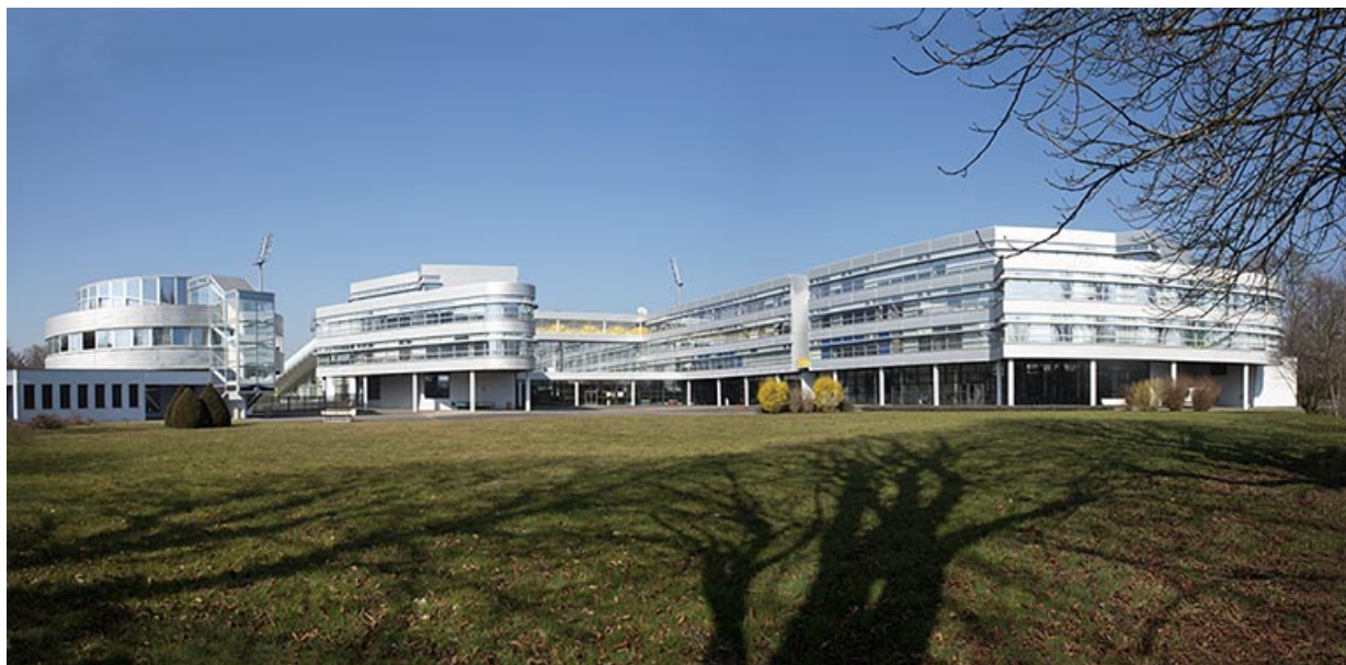
Belfort, lycée Gustave Courbet : vue d'ensemble depuis le sud.