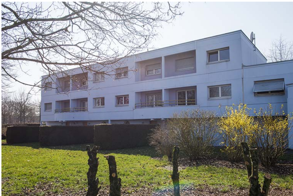
Façade postérieure est des logements sud-ouest.