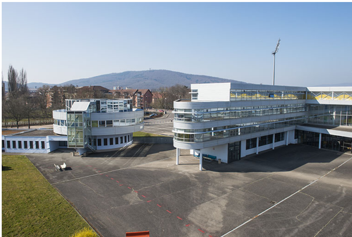
Cour, angle sud-est de l'externat.