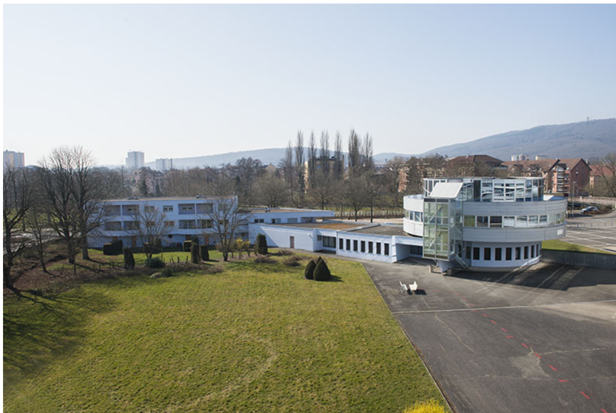
Façade sur cour des classes préparatoires et logements sud-ouest.