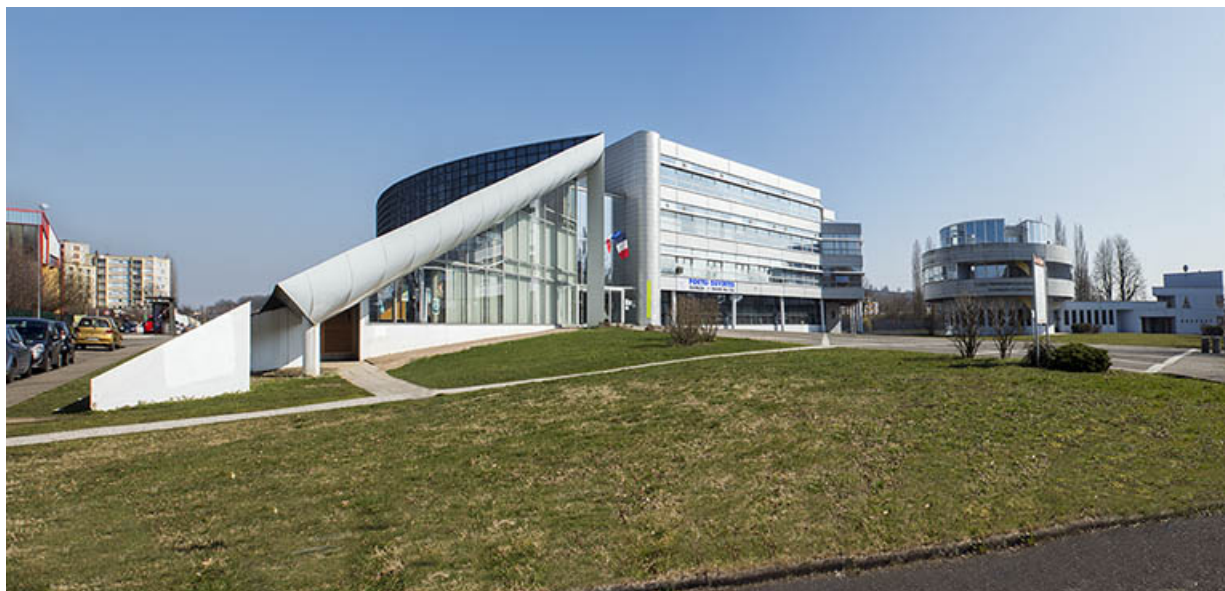
Place-parvis, entrée, tour des classes préparatoires et pignon nord des logements.