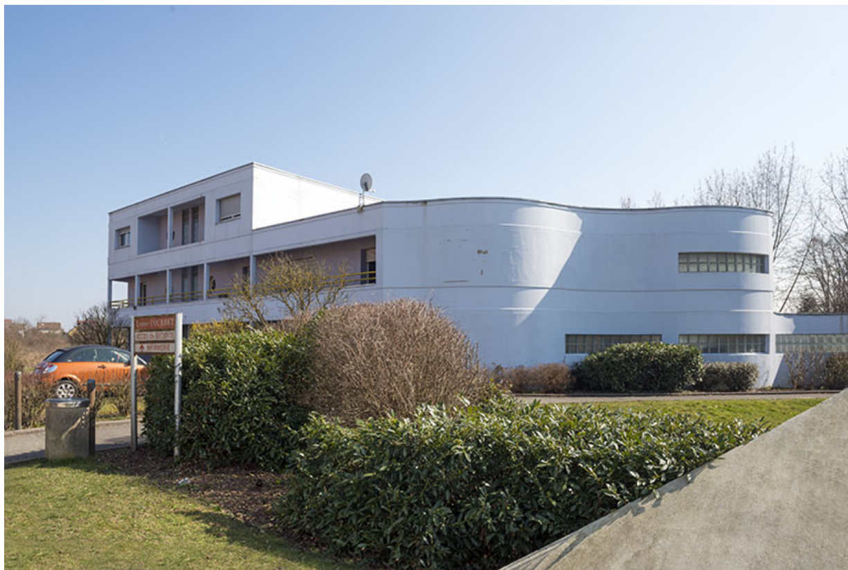
Façade antérieure nord sur rue des logements nord-est.