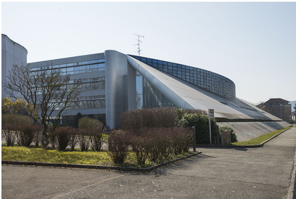
Façade sur rue, angle nord-est du bâtiment socio-éducatif.