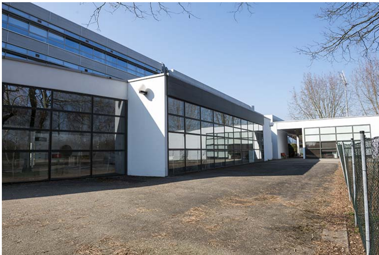
Façade est des cuisines et façade sud des réserves.