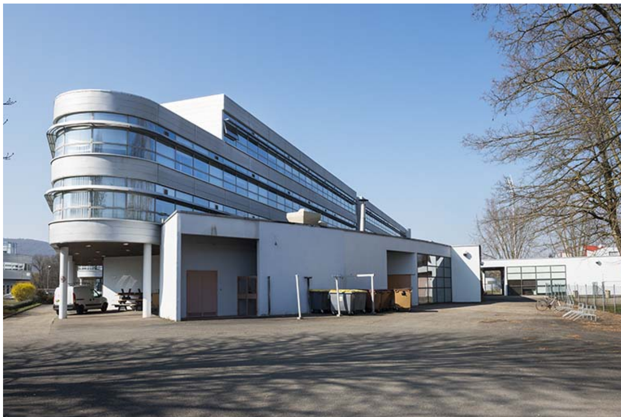
Angle sud-est et façade orientale de la restauration.