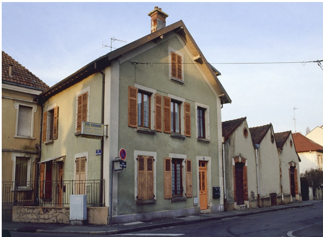
Façade sur rue du logement et de l'atelier de fabrication.