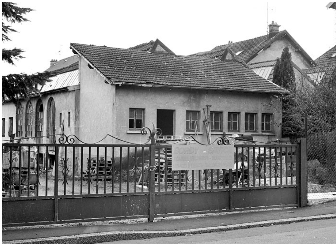
Vue arrière de l'atelier de fabrication.