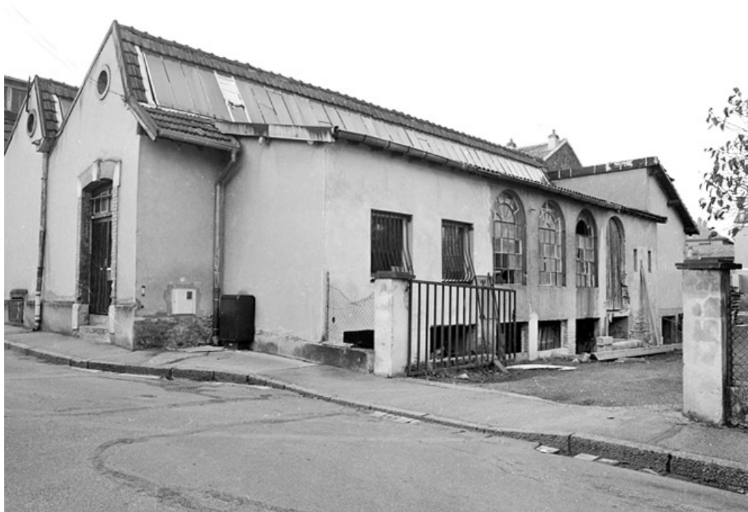
Atelier de fabrication vu de trois quarts.