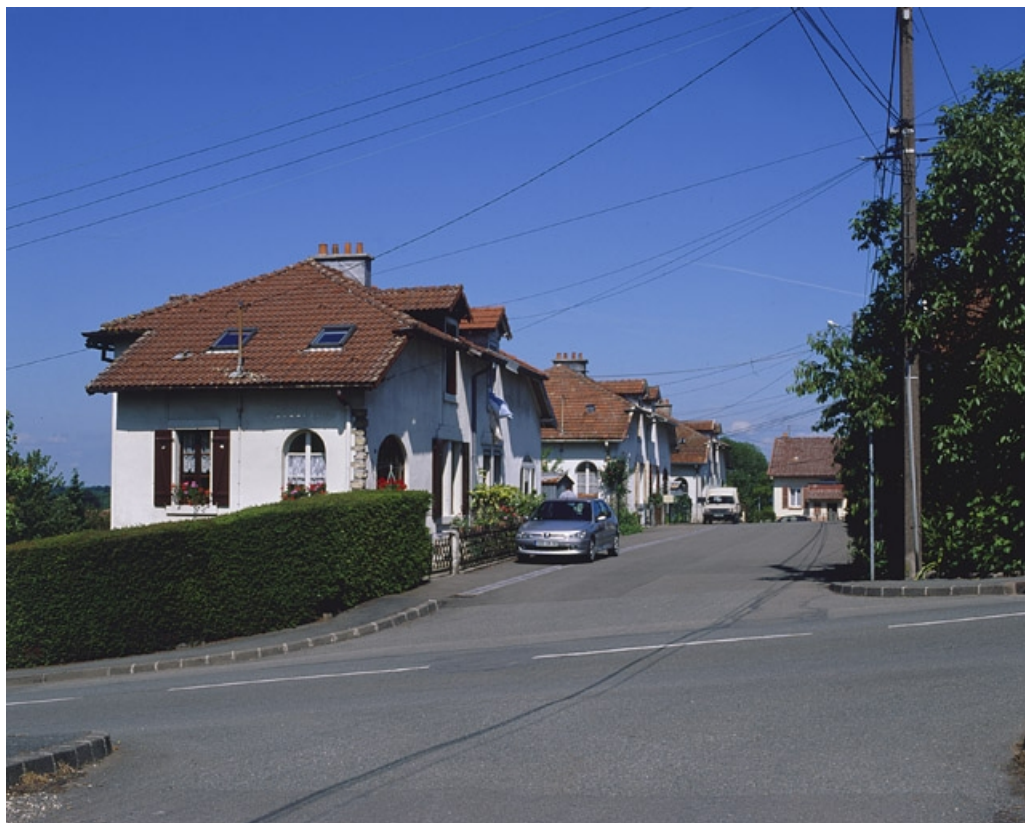
Vue de la rue des Fondeurs depuis l'est.

90, Beaucourt, lieudit : cité Adolphe Japy