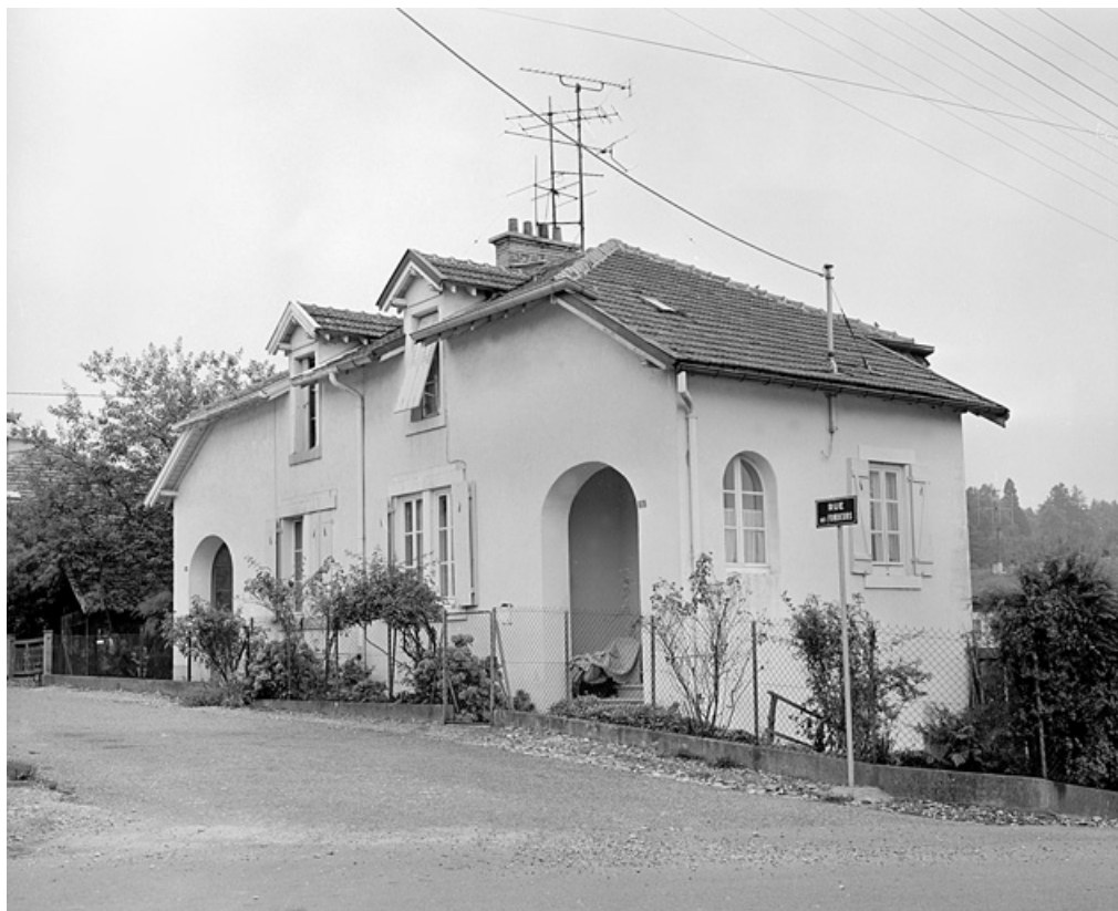
Maison jumelée rue des Fondateurs. SRI. Enquête régionale sur les bâtiments industriels (1979-1981). 90, Beaucourt, lieudit : cité Adolphe Japy