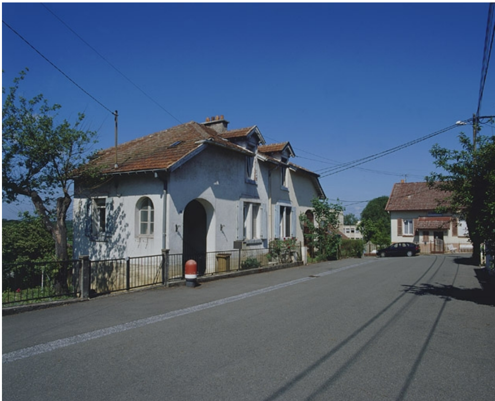
Maison jumelée rue des Fondeurs : vue de trois quarts.

90, Beaucourt, lieudit : cité Adolphe Japy