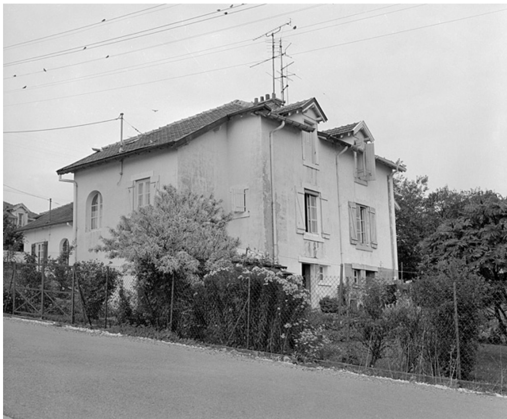
Maison jumelée rue des Fondateurs : façade postérieure. SRI. Enquête régionale sur les bâtiments industriels (1979-1981). 90, Beaucourt, lieudit : cité Adolphe Japy