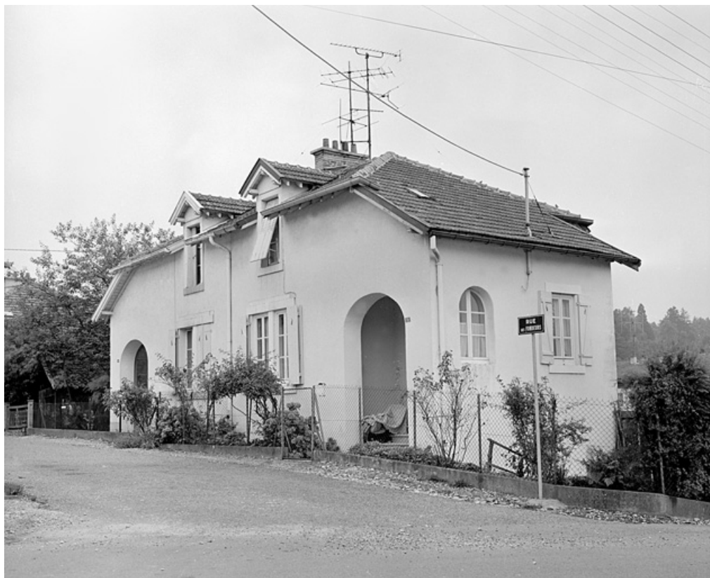
Maison jumelée rue des Fondateurs. SRI. Enquête régionale sur les bâtiments industriels (1979-1981).

90, Beaucourt, lieudit : cité Adolphe Japy