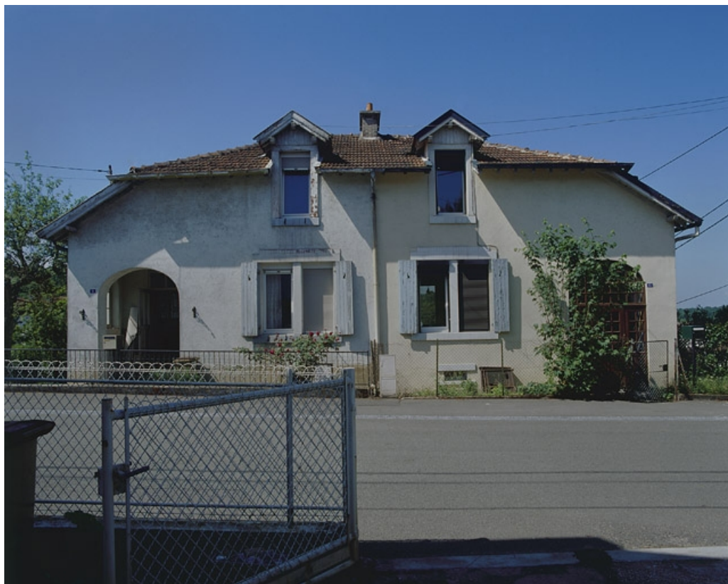
Maison jumelée rue des Fondateurs : vue de face.

90, Beaucourt, lieudit : cité Adolphe Japy