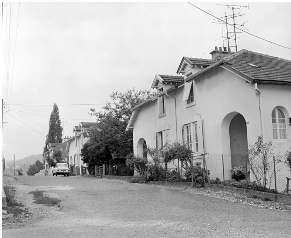
Vue de la rue des Fondateurs. SRI. Enquête régionale sur les bâtiments industriels (1979-1981). 90, Beaucourt, lieudit : cité Adolphe Japy