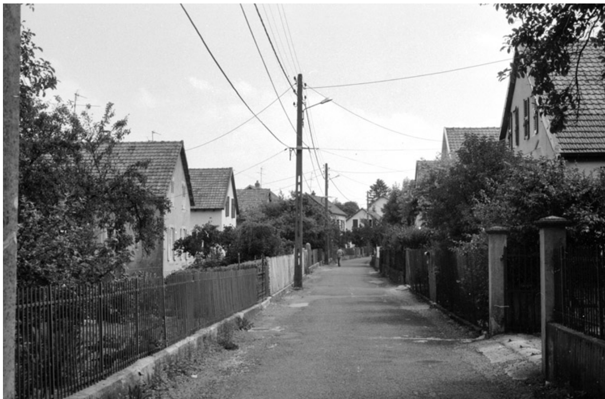
Rue n° 1 de la cité Bellevue. SRI. Inventaire topographique du canton de Beaucourt (1981-1982). 90, Beaucourt, lieu-dit : cité Bellevue