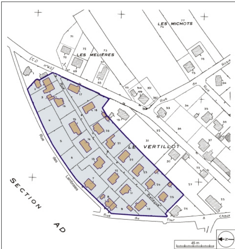
Plan-masse et de situation. Extrait du plan cadastral, 1979, section AE, 1:1500. 90, Beaucourt, lieudit : cité Bellevue