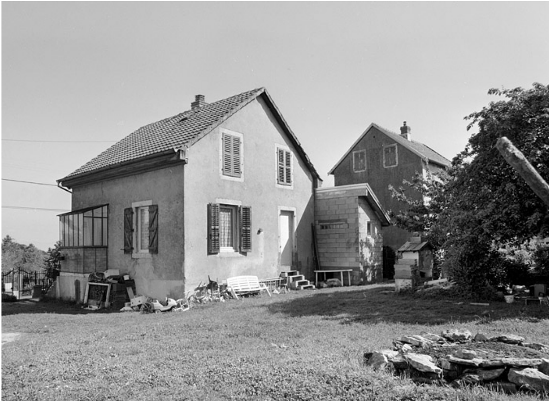
Maison au n° 12 de la rue : vue de trois quarts arrière.