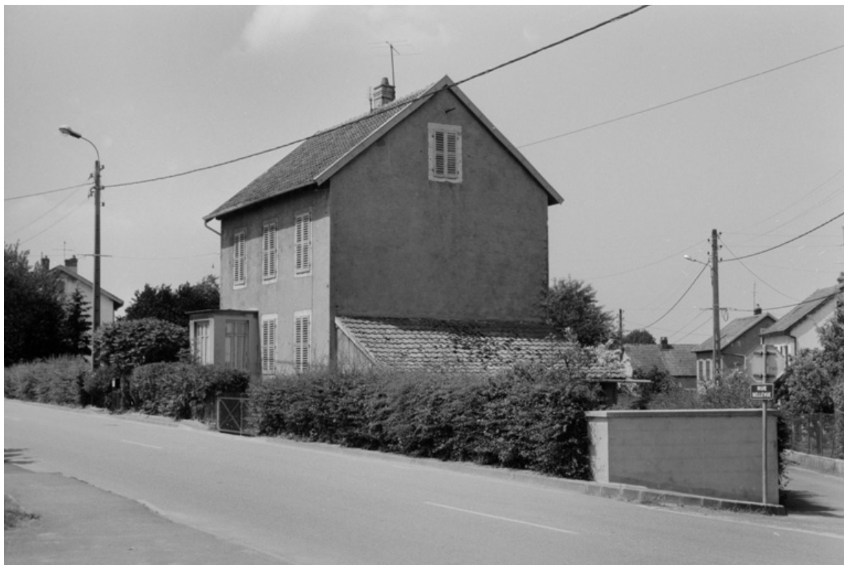
Maison (n° 18) de la rue Bellevue. SRI. Inventaire topographique du canton de Beaucourt (1981-1982). 90, Beaucourt, lieudit : cité Bellevue