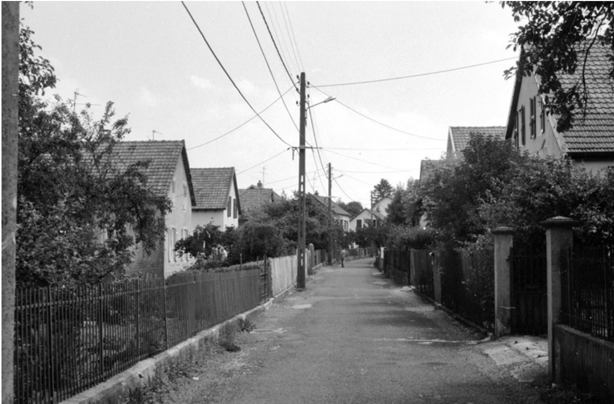
Rue n° 1 de la cité Bellevue. SRI. Inventaire topographique du canton de Beaucourt (1981-1982). 90, Beaucourt, lieu-dit : cité Bellevue