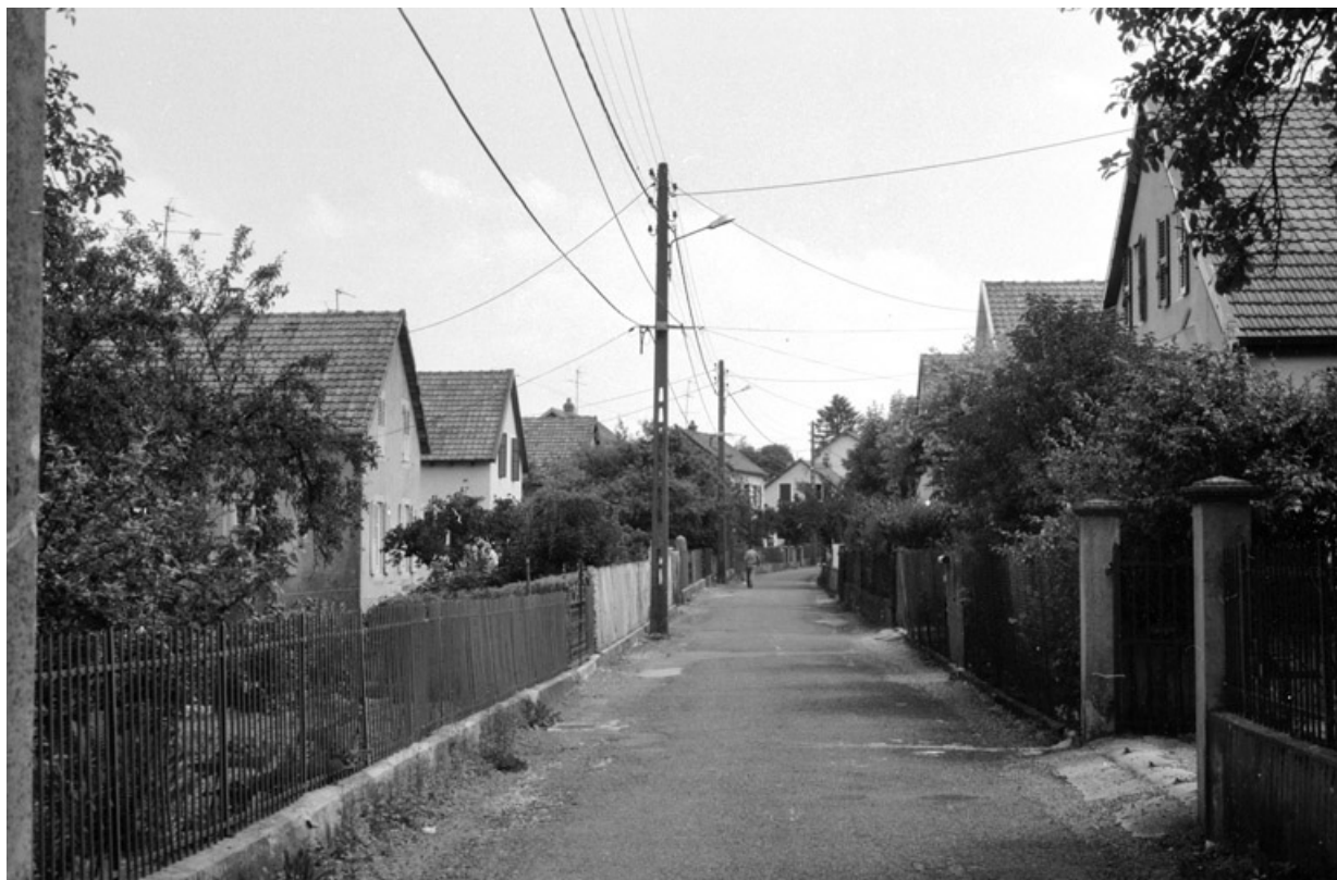
Rue n° 1 de la cité Bellevue. SRI. Inventaire topographique du canton de Beaucourt (1981-1982). 90, Beaucourt, lieudit : cité Bellevue