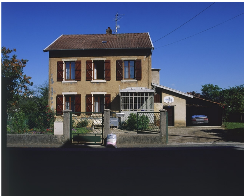
Maison au n° 9 de la rue : vue de face.