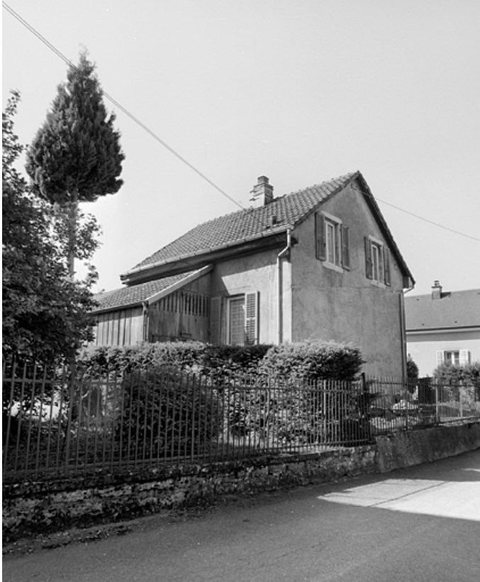
Maison au n° 12 de la rue : vue de trois quarts.