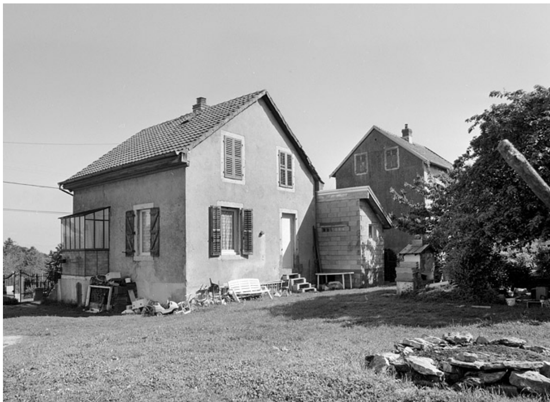
Maison au n° 12 de la rue : vue de trois quarts arrière.