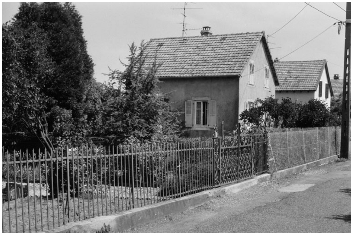
Maison (n° 3) de la rue n° 1 de la cité Bellevue. SRI. Inventaire topographique du canton de Beaucourt (1981-1982). 90, Beaucourt, lieudit : cité Bellevue