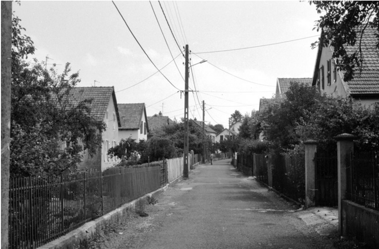
Rue n° 1 de la cité Bellevue. SRI. Inventaire topographique du canton de Beaucourt (1981-1982). 90, Beaucourt, lieudit : cité Bellevue