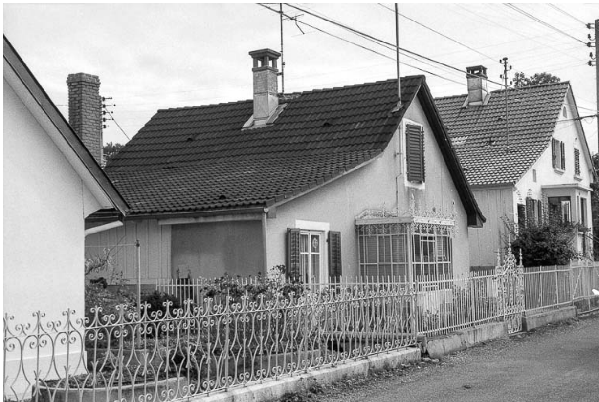
Maison individuelle (cadastre : AH 237) en 1982.