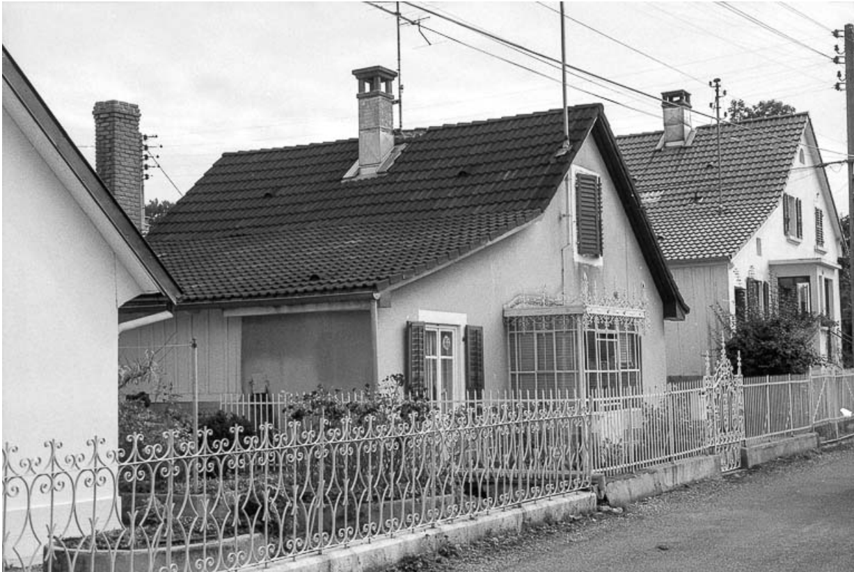
Maison individuelle (cadastre : AH 237) en 1982.