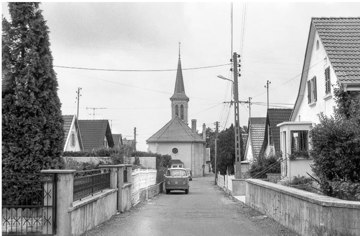
Vue d'ensemble de la rue du Temple en 1982.