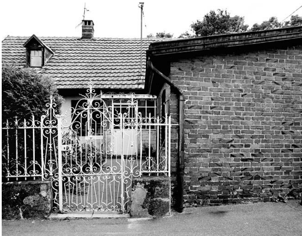
Maison individuelle n° 9 rue du Temple : détail de la grille.