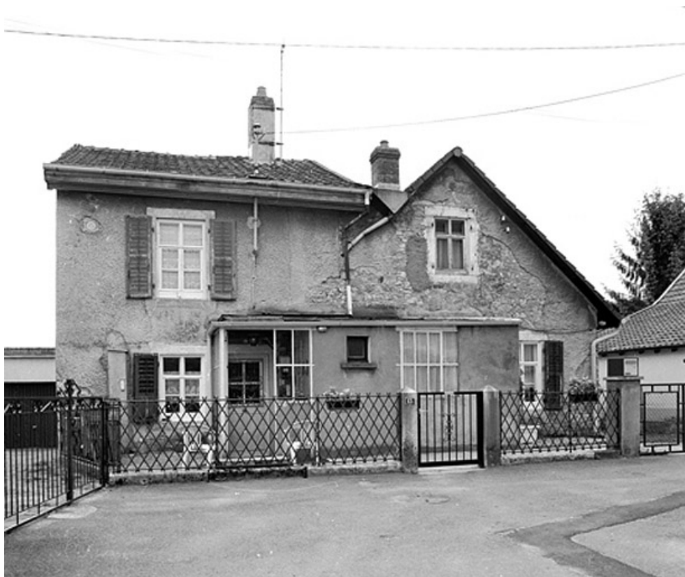
Maison individuelle n° 13 rue du Temple : vue de face.