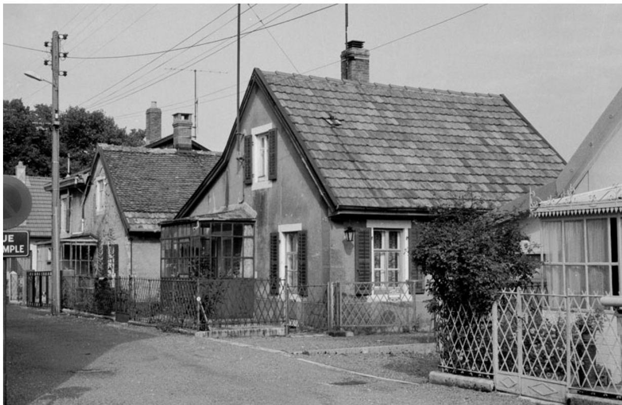
Maison individuelle (cadastre : AH 243) en 1982. SRI. Inventaire topographique du canton de Beaucourt (1981-1982). 90, Beaucourt, lieudit : cité du Temple