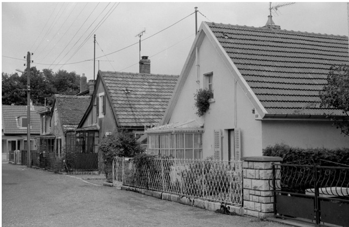
Alignement de maisons rue du Temple en 1982. SRI. Inventaire topographique du canton de Beaucourt (1981-1982). 90, Beaucourt, lieudit : cité du Temple