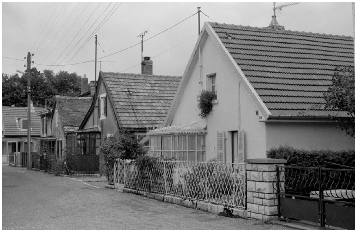
Alignement de maisons rue du Temple en 1982. SRI. Inventaire topographique du canton de Beaucourt (1981-1982). 90, Beaucourt, lieudit : cité du Temple