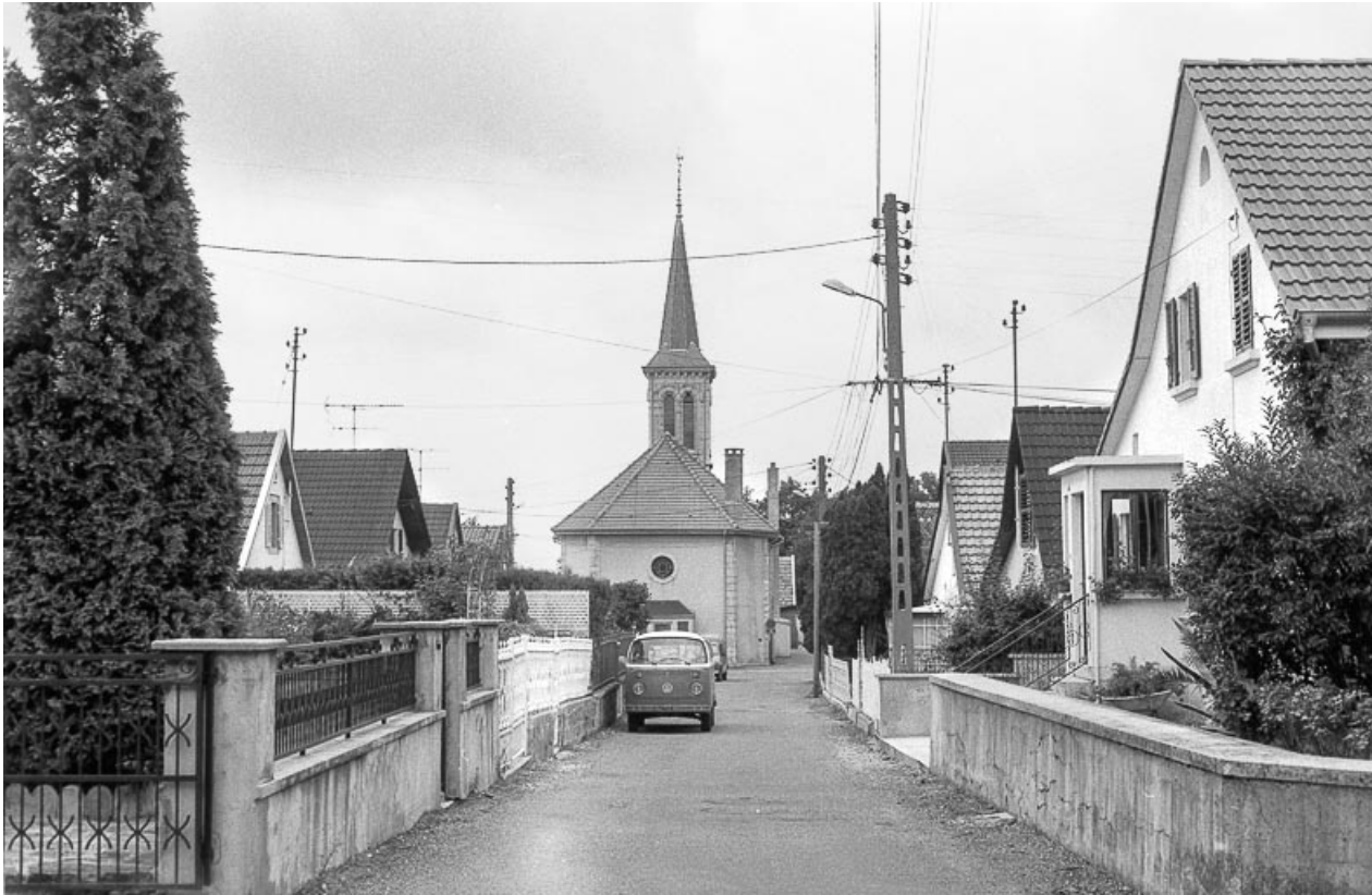
Vue d'ensemble de la rue du Temple en 1982.