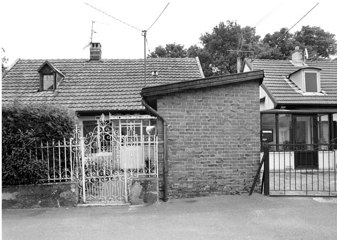
Maison individuelle n° 9 rue du Temple.