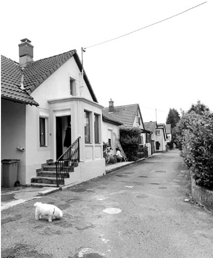
Alignement de maisons rue Bel-Air.