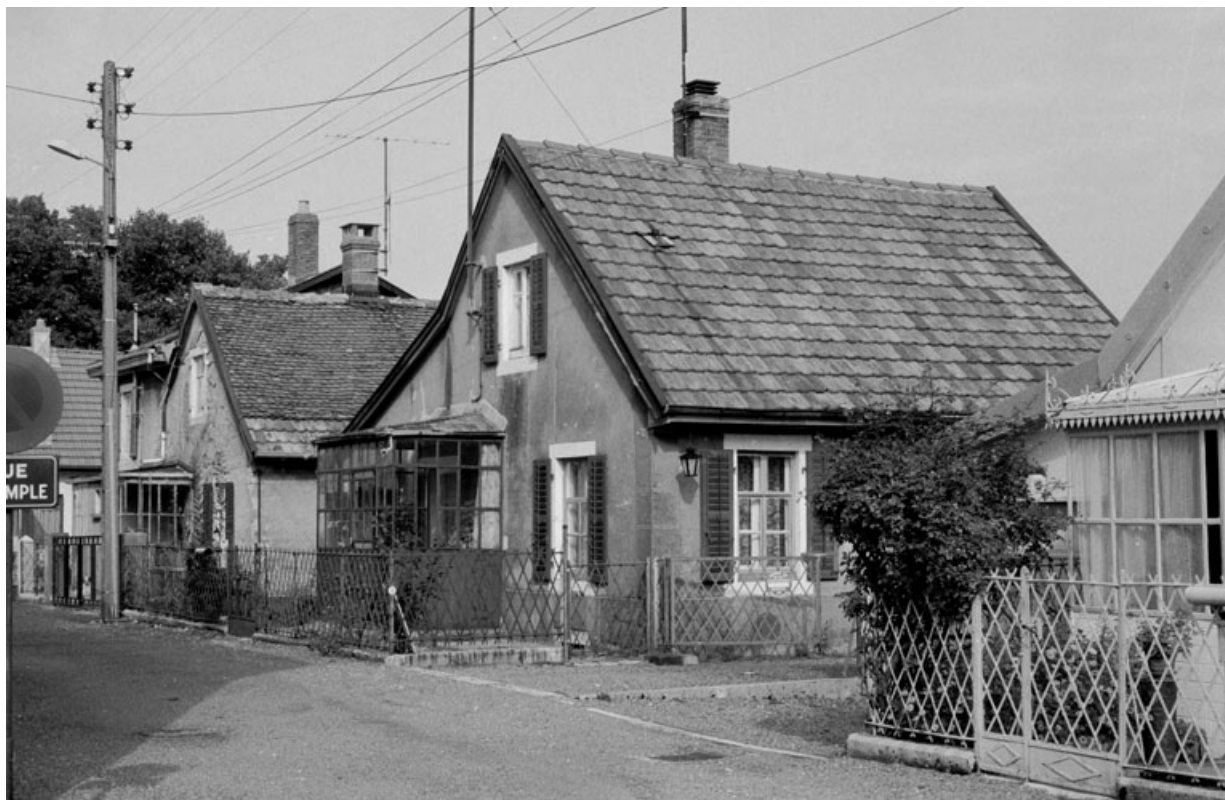
Maison individuelle (cadastre : AH 243) en 1982. SRI. Inventaire topographique du canton de Beaucourt (1981-1982). 90, Beaucourt, lieudit : cité du Temple