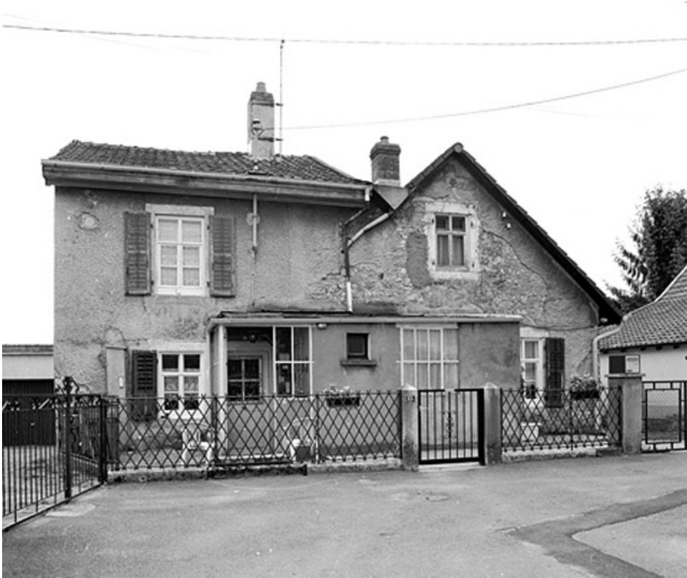
Maison individuelle n° 13 rue du Temple : vue de face.