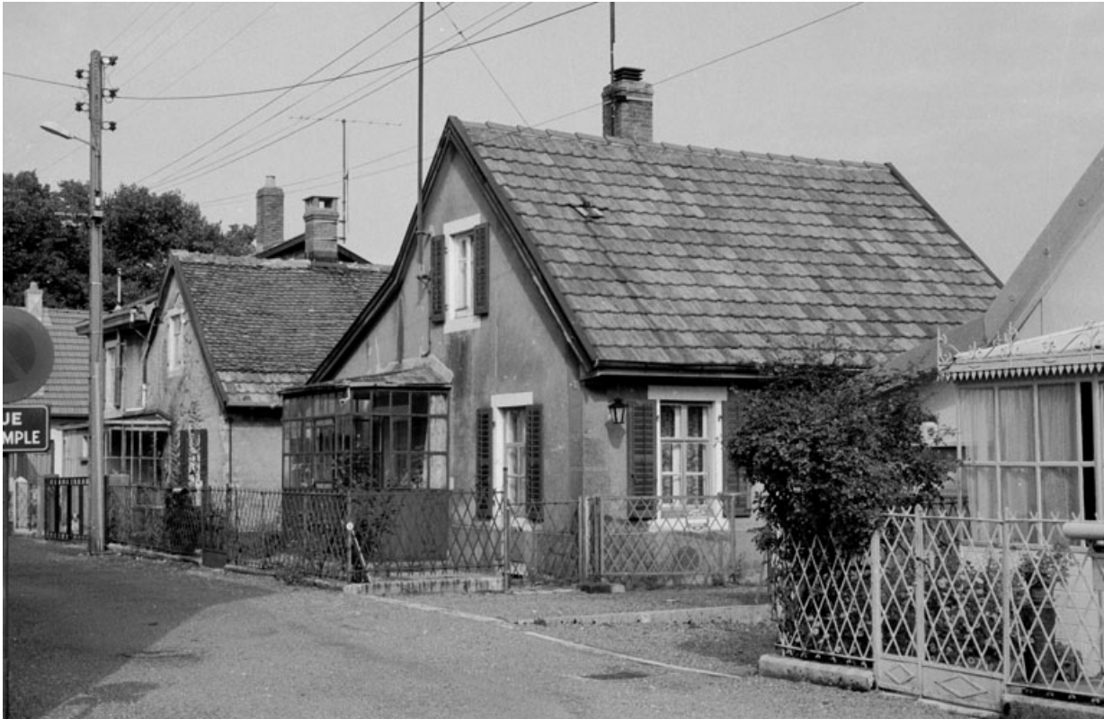
Maison individuelle (cadastre : AH 243) en 1982. SRI. Inventaire topographique du canton de Beaucourt (1981-1982). 90, Beaucourt, lieudit : cité du Temple