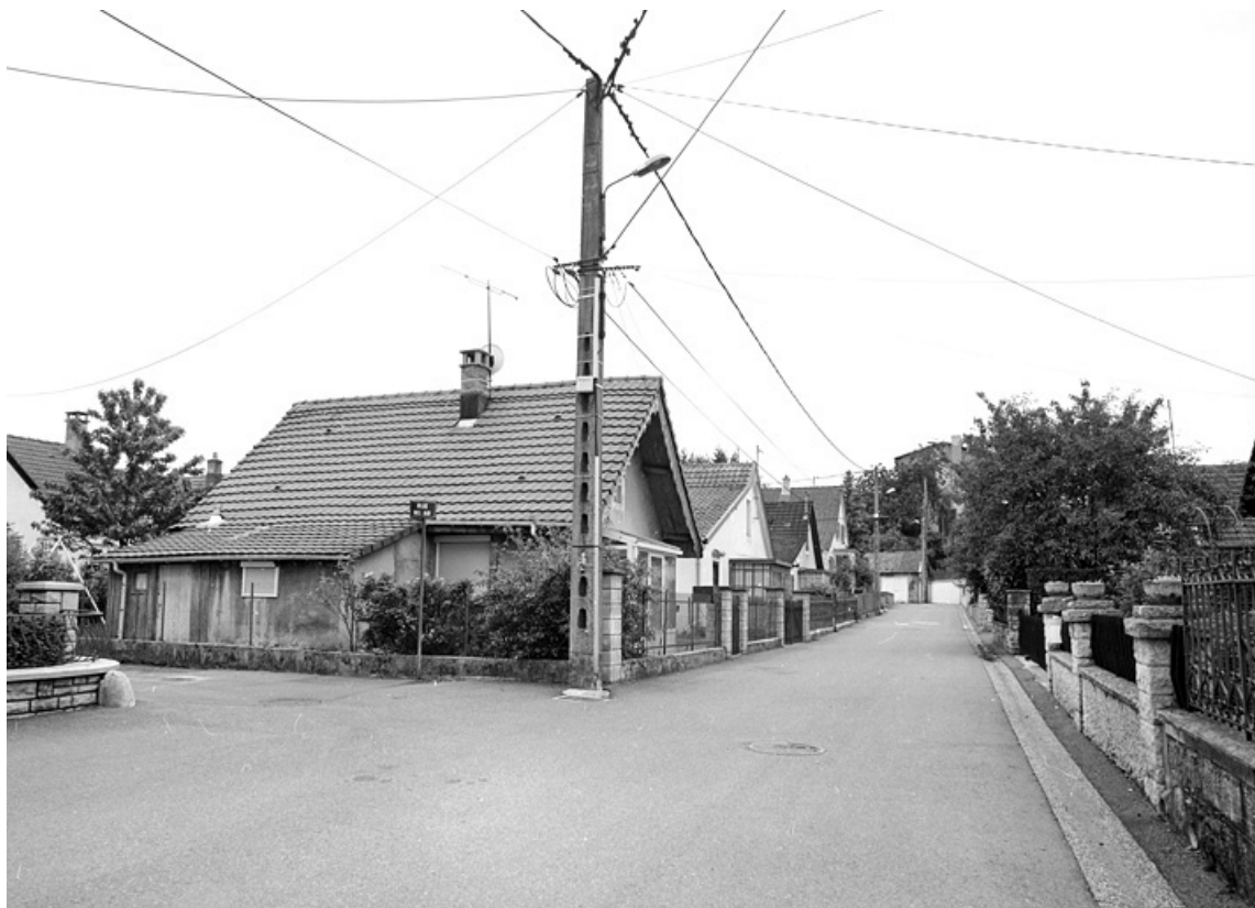
Vue d'ensemble de la rue du Temple.