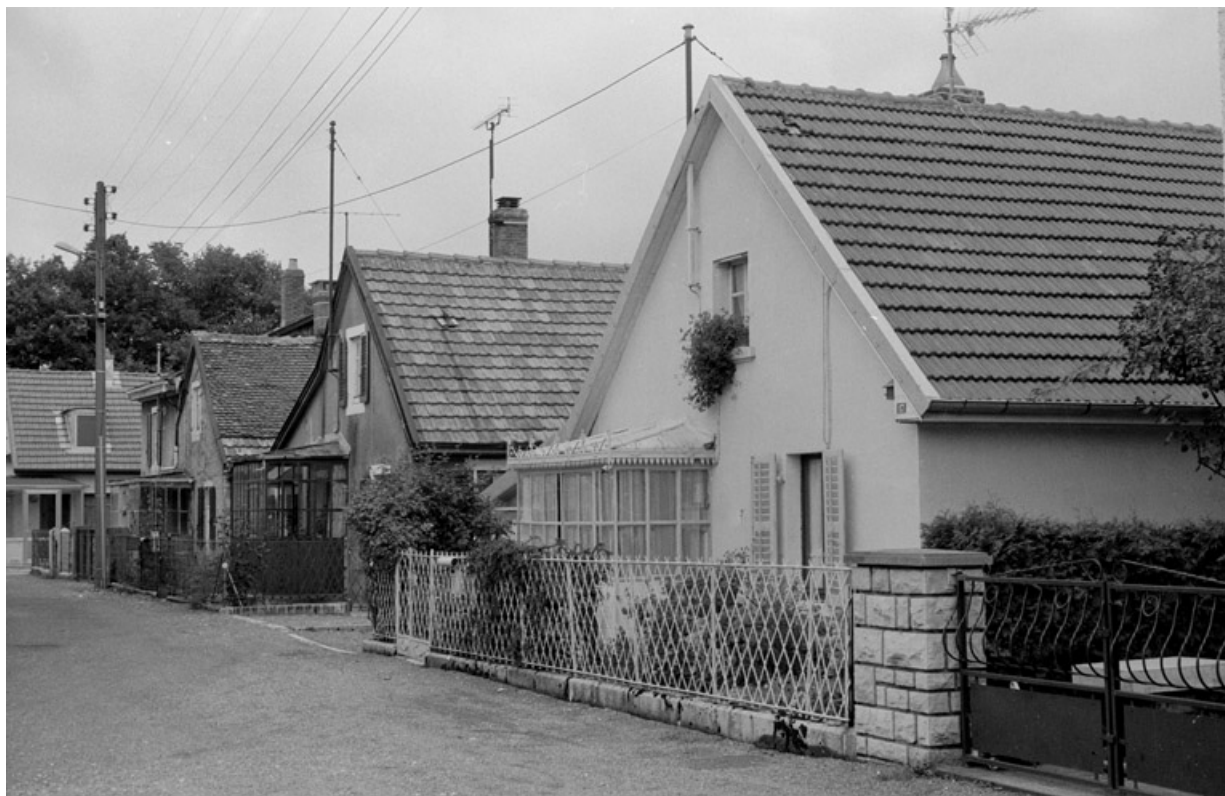
Alignement de maisons rue du Temple en 1982. SRI. Inventaire topographique du canton de Beaucourt (1981-1982). 90, Beaucourt, lieudit : cité du Temple