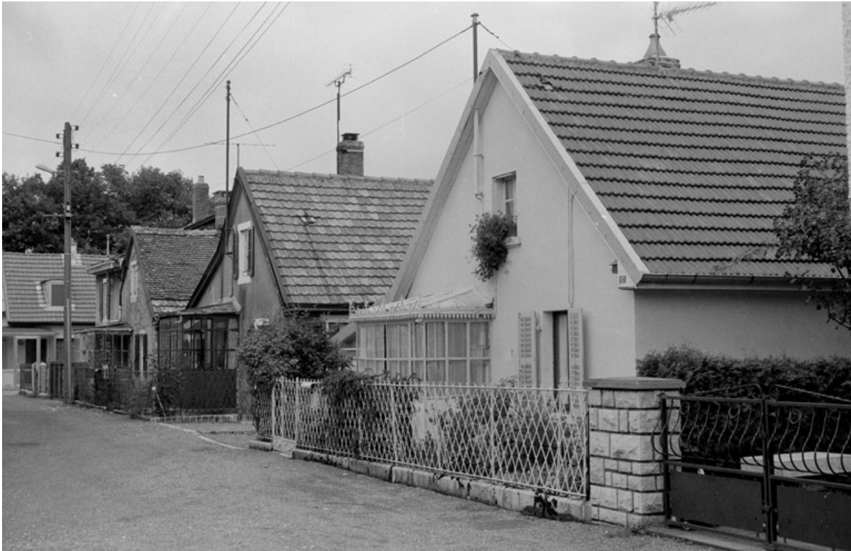
Alignement de maisons rue du Temple en 1982. SRI. Inventaire topographique du canton de Beaucourt (1981-1982). 90, Beaucourt, lieudit : cité du Temple