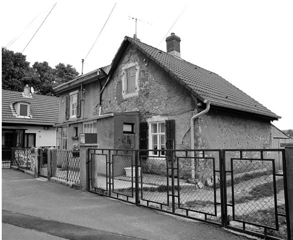
Maison individuelle n° 13 rue du Temple : vue de trois quarts.