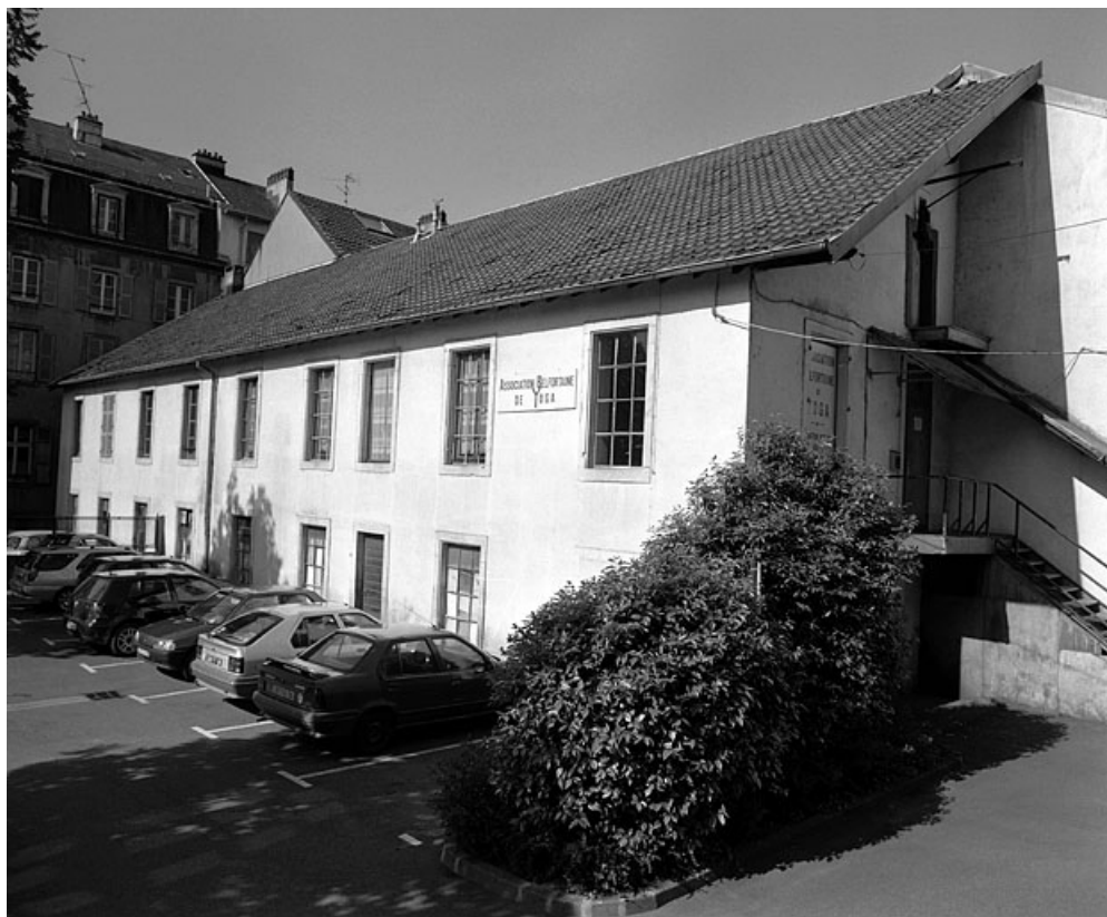
Façade est d'un atelier de fabrication en coeur d'îlot.