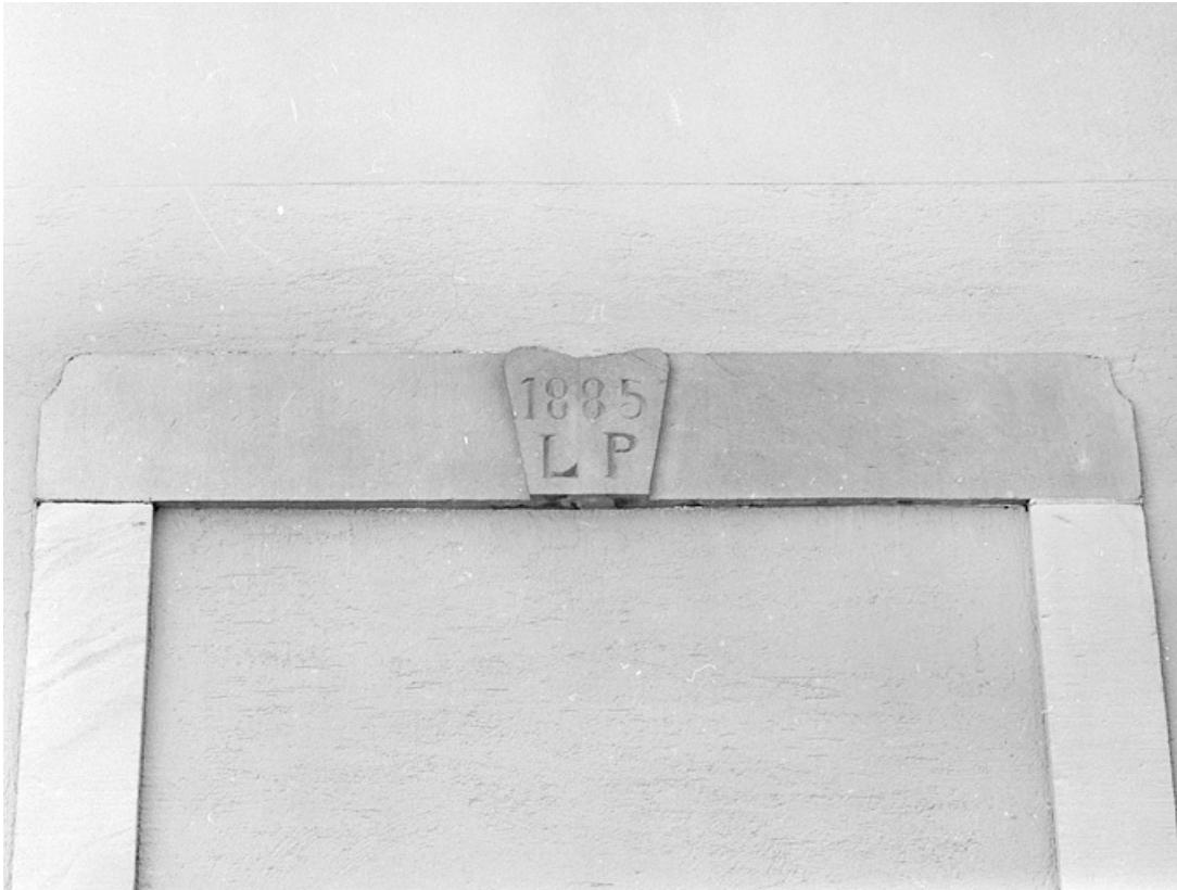
Détail d'un linteau de porte de la cour.