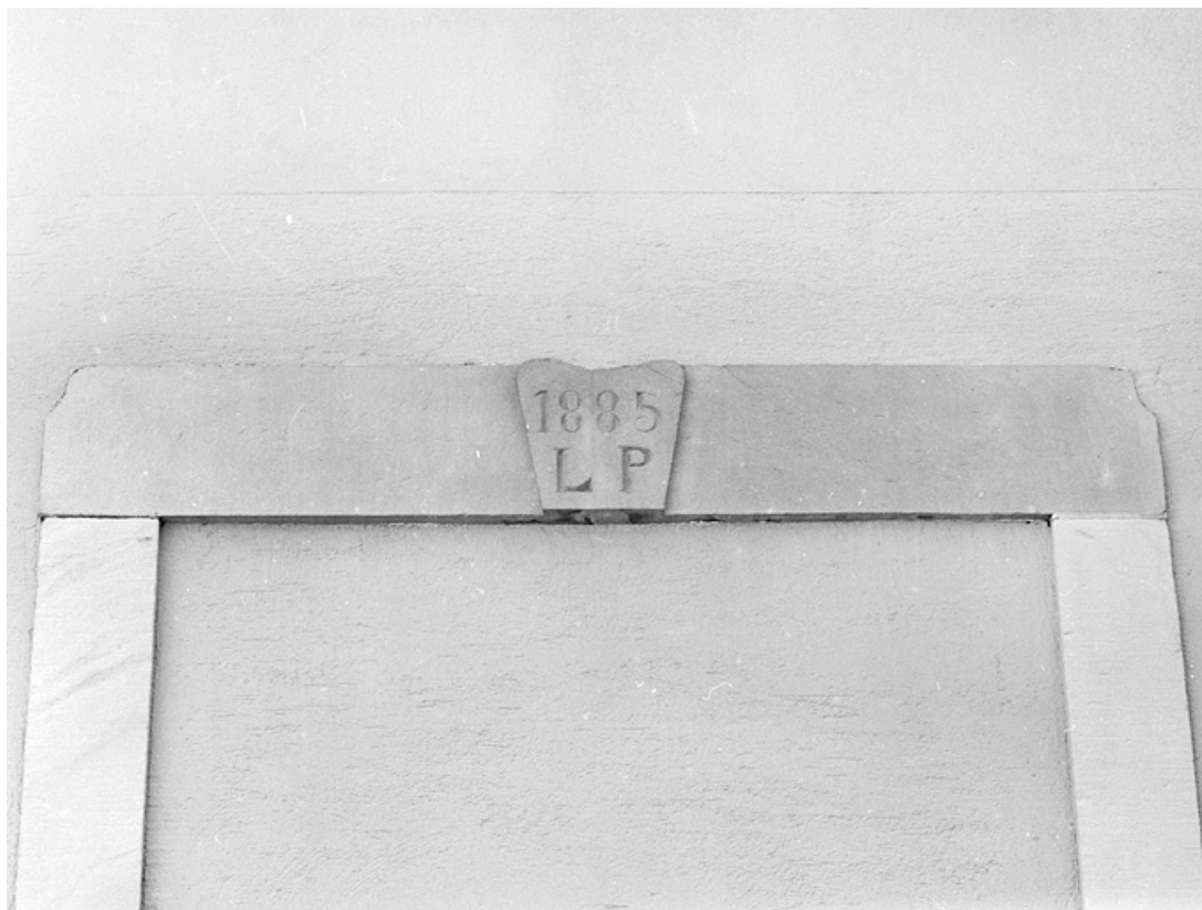
Détail d'un linteau de porte de la cour.