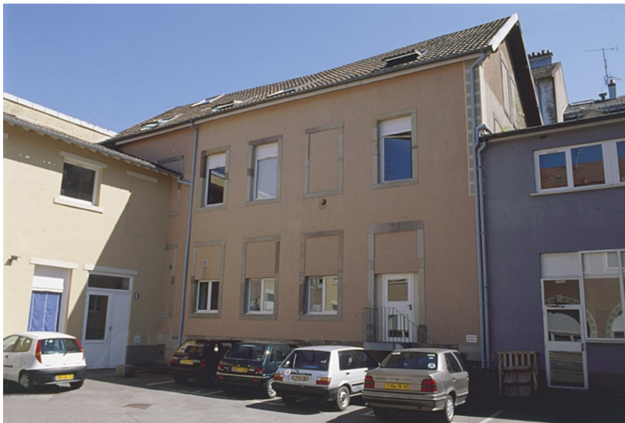
Élévation nord d'un bâtiment depuis la cour. Le linteau porte les initiales du fondateur.