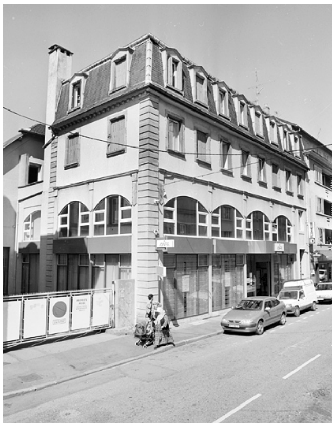
Vue de la façade sur la rue Thiers.