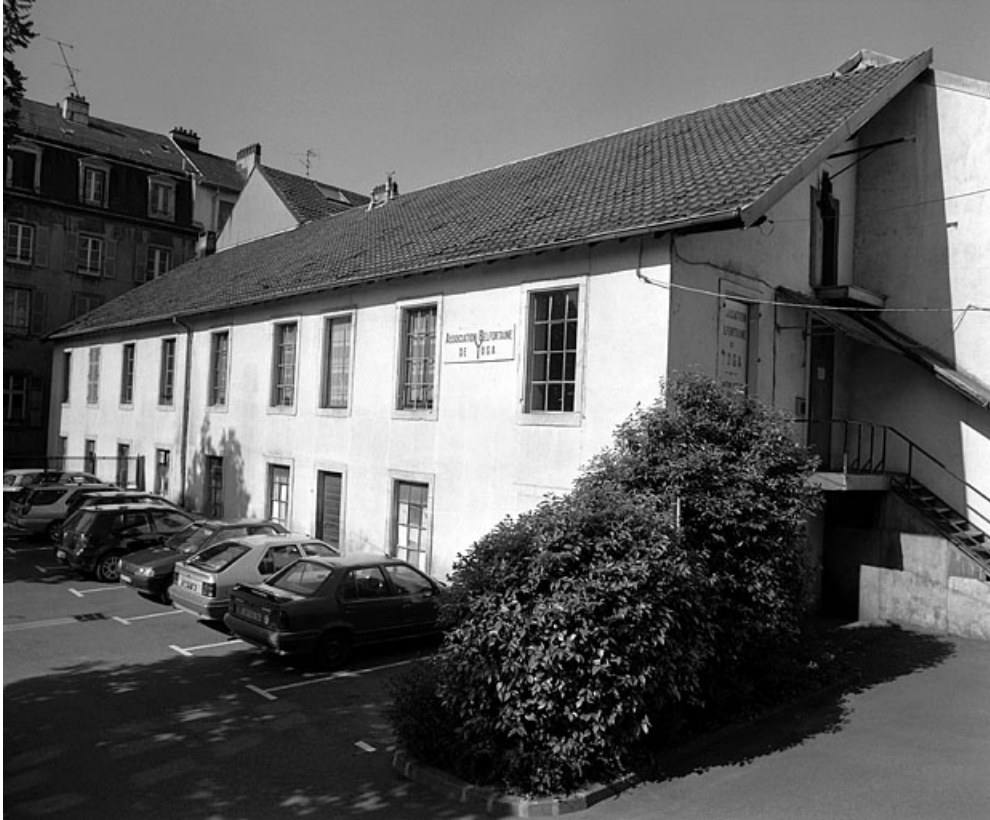
Façade est d'un atelier de fabrication en coeur d'îlot.