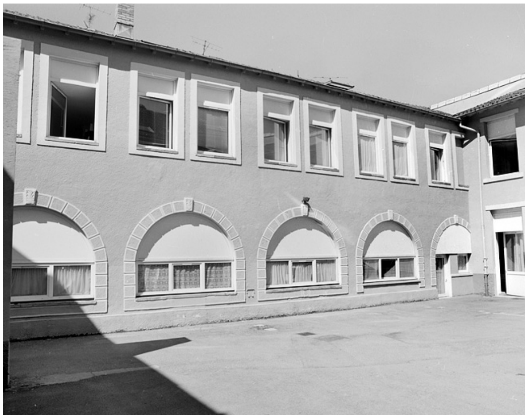
Élévation (remaniée) d'un atelier de fabrication depuis la cour.