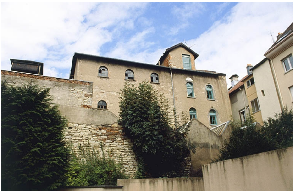
Façade postérieure de l'usine. 90, Belfort, 1 à 5 rue des Capucins