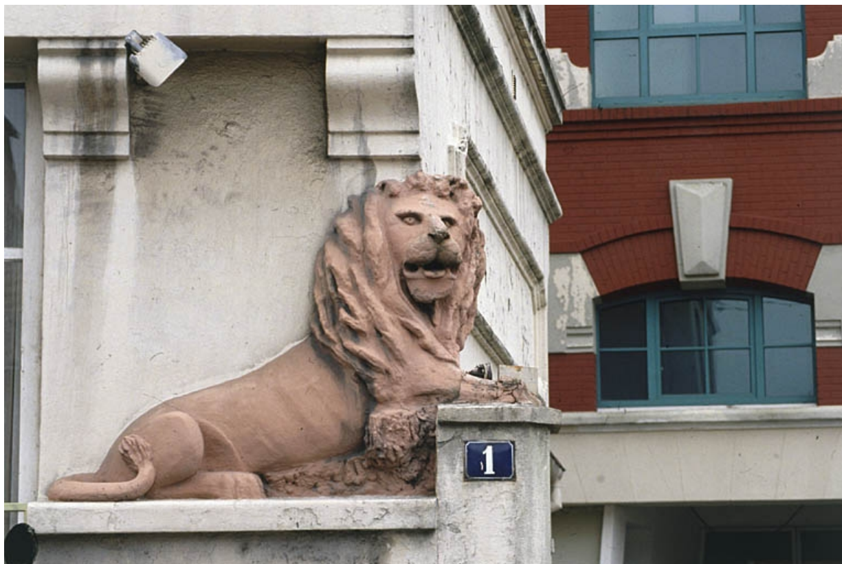
Détail du lion ornant l'entrée de l'usine.