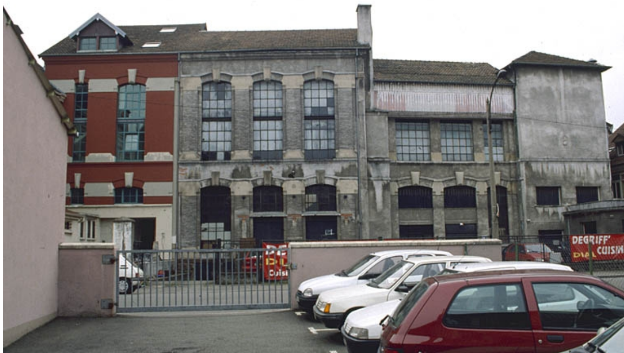
Façade antérieure de l'atelier de fabrication.